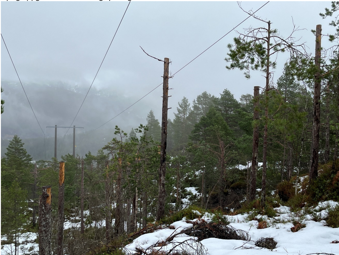
Figur 2 Det er kapp av toppane på furutrea i traseen under kraftlinja Hålandsfossen – Lutelandet som går gjennom det tilrådde området Gyttavatnet som naturreservat. Nokre av furutrea har overlevd, men dei fleste er døde. Linja er relativt nyetablert og er eigd av BKK Nett as.

Det er ei kraftlinje i regionalnettet som går gjennom kandidatområdet i det søraustre hjørnet, det er eigd av BKK Nett AS og linja har namn 66 KV Hålandsfossen – Nedre Svultingen. I tillegg er det ei kraftlinje i regionalnettet mellom Hålandsfossen og Lutelandet, ein hengekabel med 132 kV, som går gjennom arealet på tvers frå aust til vest over Styggehamaren. Denne har eit lengre luftspenn. Under er bilete av linja etter synfaring i kandidatområdet frå februar 2024, der det ser ut til å vere relativt nyleg oppgraderte master og rydding i traseen.