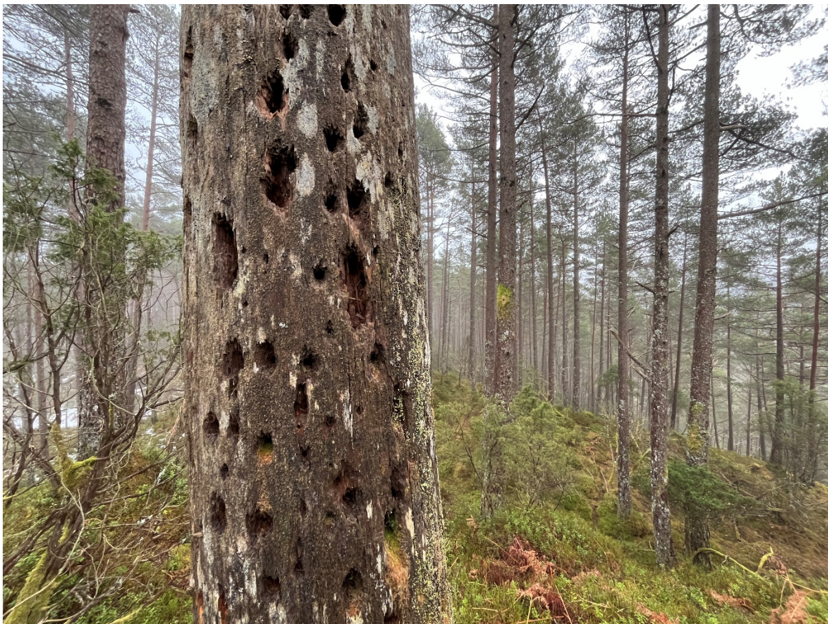
Figur 1 Vi vurderer Gyttavatnet til å oppfylle viktige manglar i skogvernet både i fylket og nasjonalt med gamal og variert rik og fattig edellauvskog, fattig boreonemoral regnskog og forholdsvis intakte område av lågareliggjande skog i boreonemoral og sørboreal vegetasjonssone. Død ved er eit viktig element i skogen fordi så mange insekt, sopp og lav treng dette i livssyklusen sin. Då finn også spettane mat, slik spora på biletet kan vitne om.

Kunnskapsgrunnlaget om naturmangfaldet i verneforslaget er innhenta frå naturbase, der kjeldene mellom anna er frå: