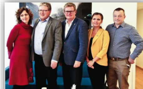
OPPLYSNING: Vi de vil ang utsettes, og det er et mål for samarbeidet som ble etablert i forbindelse med de to fylkene. Kommunen har et ønske om å samarbeide med Rissa kommune for å etablere et nytt fylke. Dette er et viktig spørsmål for innbyggerne i Rissa og Leksvik. Kommunen har et ønske om å samarbeide med Rissa kommune for å etablere et nytt fylke. Dette er et viktig spørsmål for innbyggerne i Rissa og Leksvik. Kommunen har et ønske om å samarbeide med Rissa kommune for å etablere et nytt fylke. Dette er et viktig spørsmål for innbyggerne i Rissa og Leksvik.