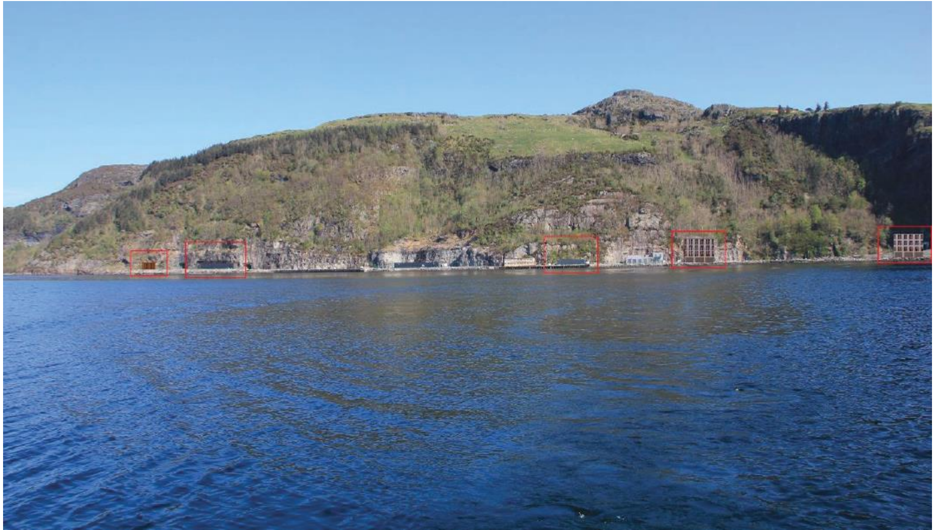
Figur 6. Nye bygg og anlegg er illustrert med rød ramme. Det er bygget helt til høyre som er plassert der dagens småbåthavn er. Bildet er hentet fra planbeskrivelsen.