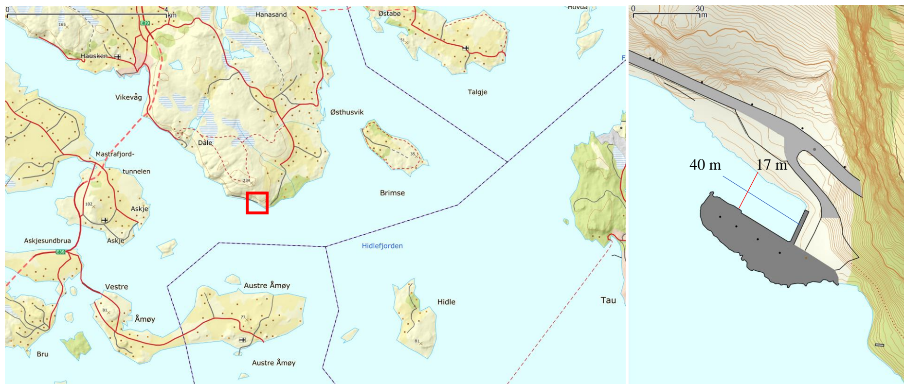
Figur 1. Oversiktskart over tiltaket (rød firkant), samt detaljkart av småbåthavna. Prøvetakingsområde for sediment er innenfor rød strek.