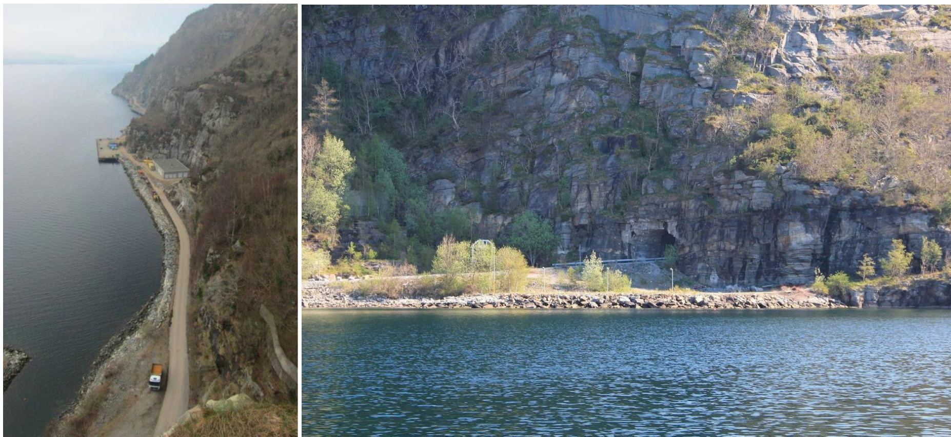
Figur 5. T.v.: Deler av utfyllingsområdet vises i venstre hjørne. T.h.: Moloen og småbåthavna sett fra sør. Bildene er hentet fra planbeskrivelsen.