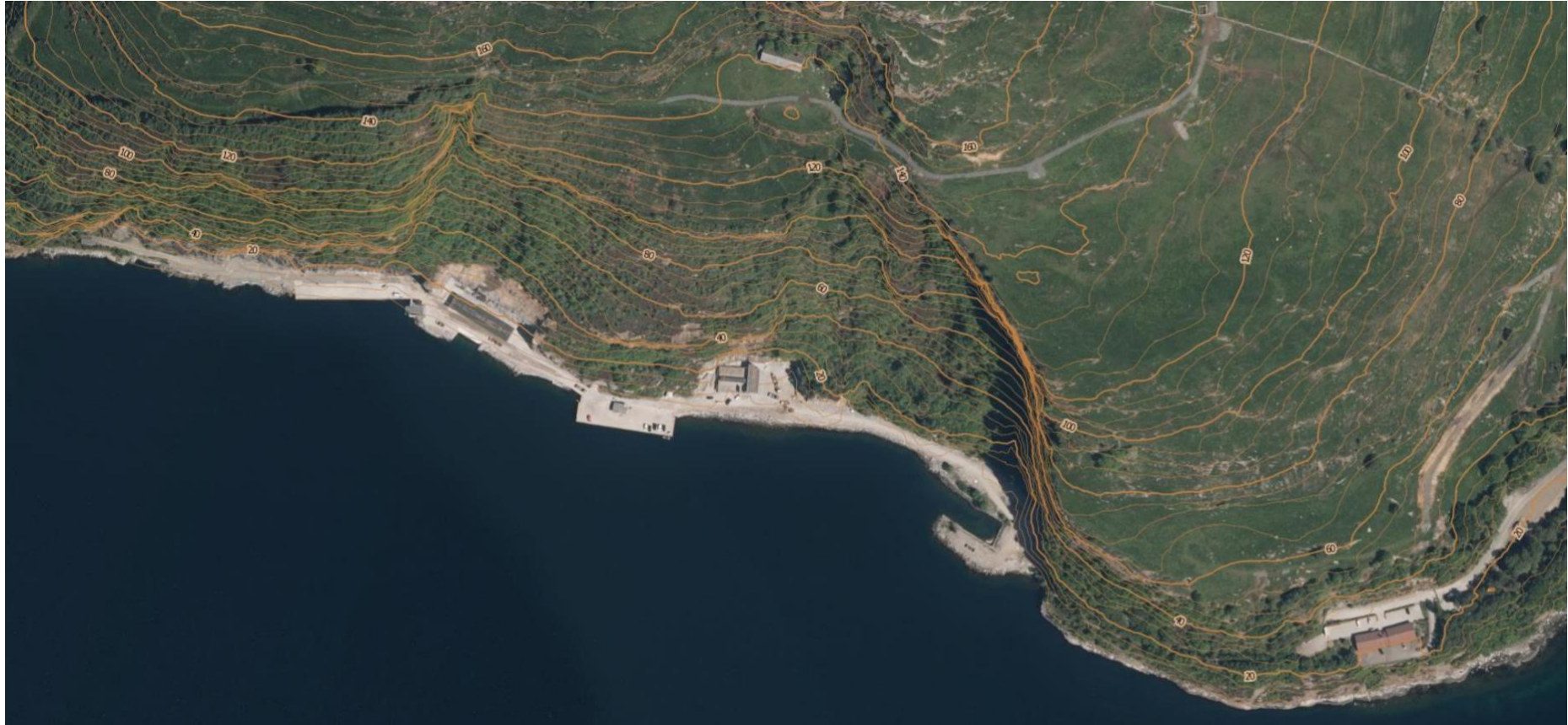
Figur 3. Oversiktsbilde av Hodne næringsområde.