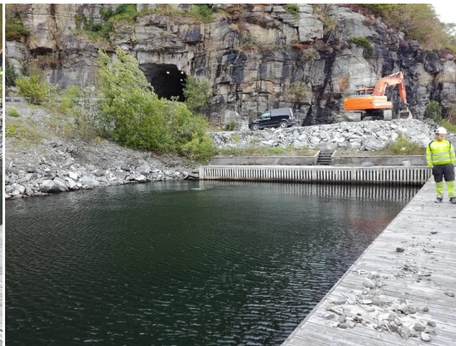
Figur 4. Indre del av småbåthavna som ønskes utfylt.