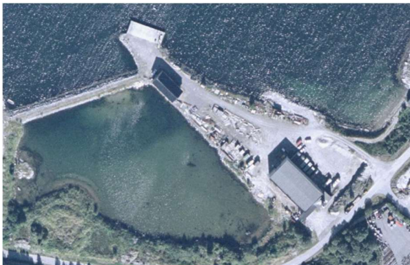
Figur 6. flybilde frå 2003.

Det har med jamne mellomrom blitt gjort utfyllingar i området dei siste 22 åra utan at me finner nokre godkjenningar på dette i innsynsløysingar hjå Miljødirektoratet. Med tanke på det me nettopp har belyst om forureiningskjelder knytt til området er me svært bekymra for kva desse utfyllingane inneheld, og kva dei dekker over. Dette er massar som direkte og indirekte påverkar miljøet, og det må kontrollerast om dette er gjort rett.