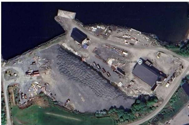
Figur 7. Siste tilgjengelege flybilde.