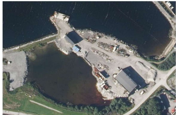
Figur 5. flybilde frå 2020.