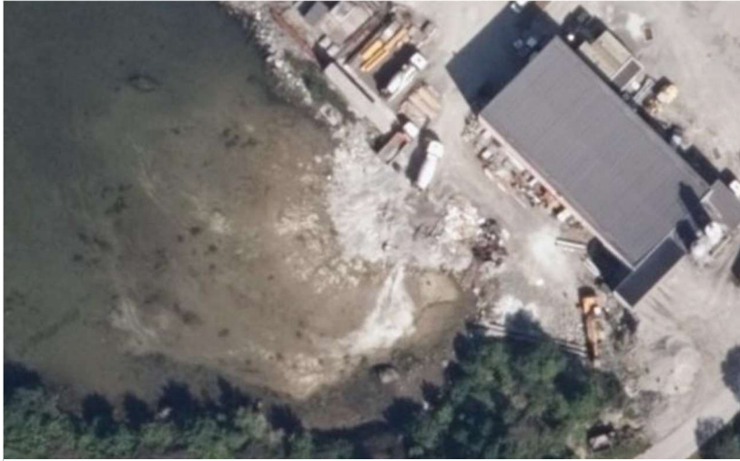
Figur 4. flybilde frå 2014.

Tidlegare flybilde frå 2014 viser at dette har stått på i lang tid. Denne manglande varsamheita eller manglande empati for naturen speglast og i den mangelfulle søknaden.