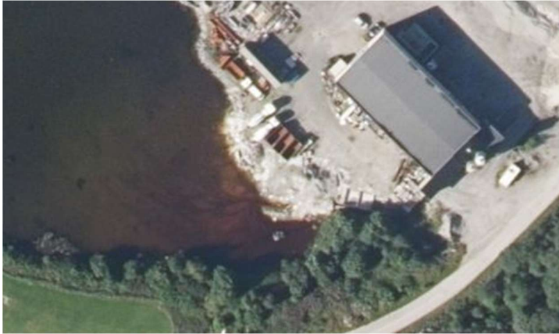
Figur 2. flybilde frå 2020.

Bildet i figur 2 er frå 2020, her ser ein tydeleg fargenyansar ein normalt ikkje ser i ikkje forureina vatn. Dette har også forandra seg over få år. Me stiller derfor spørsmålsteikn om kva dette er?