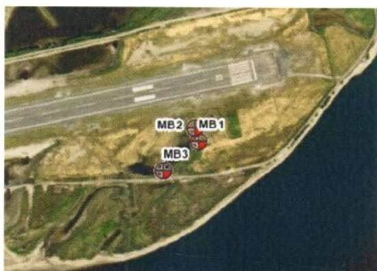
Figur 2. Plassering av grunnvannsbrønner ved det nedlagte brannøvingsfeltet.

Ved akutte utslipp vil dette registreres i Avinors avvikssystem og følges opp iht. sentrale rutiner. Det vil gjennom denne oppfølgingen bli vurdert om det er fare for at det har oppstått en ny, varig grunnforurensning.