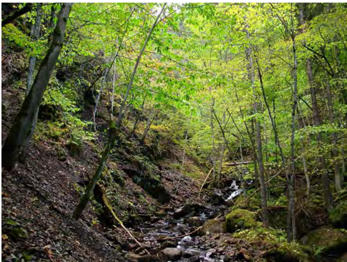
Melåa 1 Parti i midtre del av kløfta.