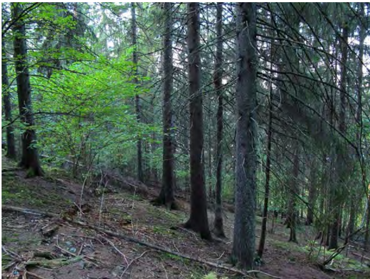
Melåa V 1 Området har tørr kalkgranskog.