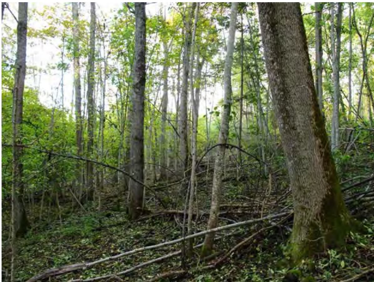
Melålia 4 Relativt gammel or-askeskog i nedre del.