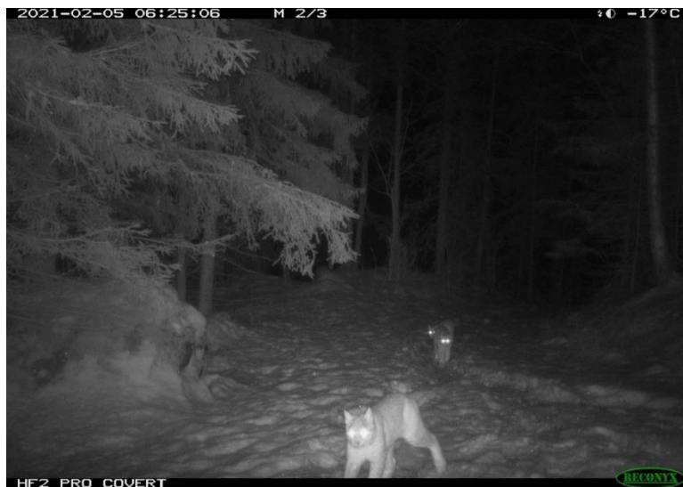
Gaupefamilien fotografert på Fåberg/Hunderfossen (Scandcam-viltkamera)

Kartbilde fra Rovbase viser hvor SNO har dokumentert spor fra familiegrupper 20/21