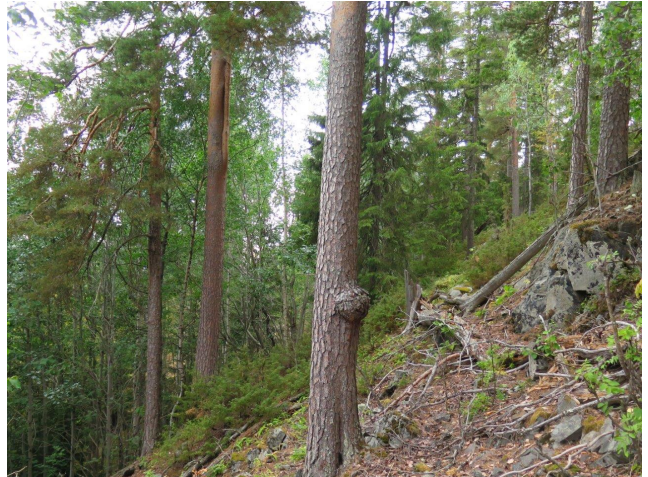
Gammel grovvokst furuskog på lågurtmark oppunder Bølltjennåsen (kjerne 18).