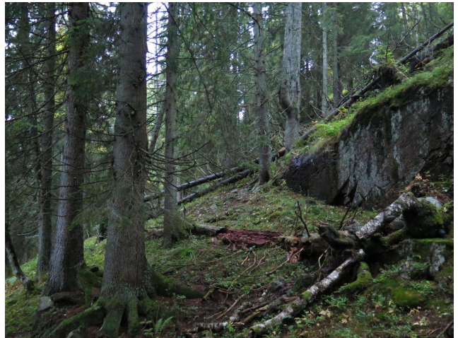
Gammel, rik lågurtgranskog i Langtjennlia (kjerne 14).