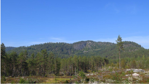
Flaghylla er et markant åsparti, særlig her fra sør.