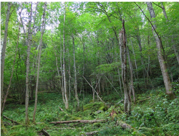
Lia under Flaghylla har rik blandingskog og edellauvskog, her nederst i lia med rik lågurt-edellauvskog og or-askeskog (kjerne 4, 6).