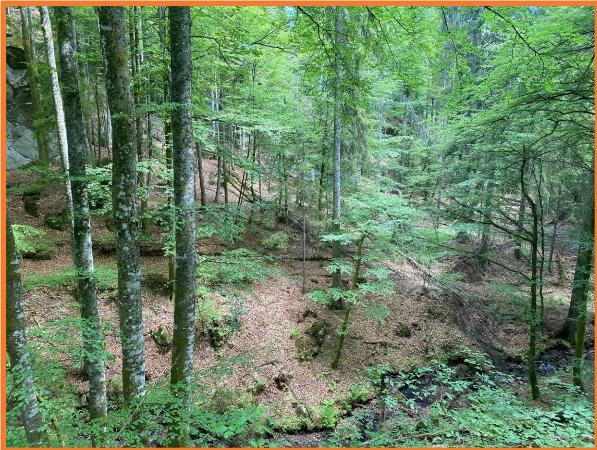
Eldre bøkeskog i Bakke vest