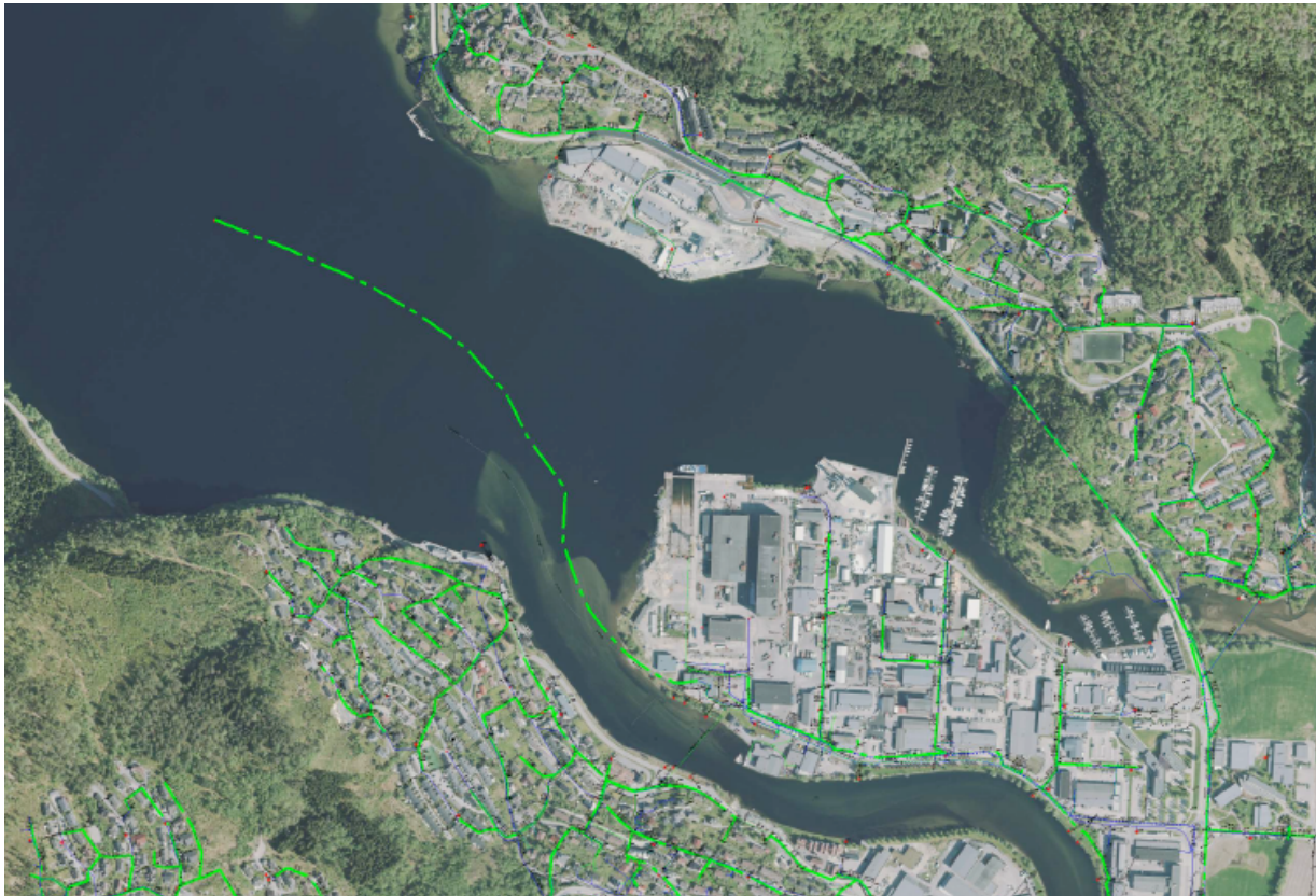
Figur 1: Kart over utsleppspunktet til Førde kommunale reinseanlegg henta frå søknad om endra utsleppsløyve datert 30.9.2020.