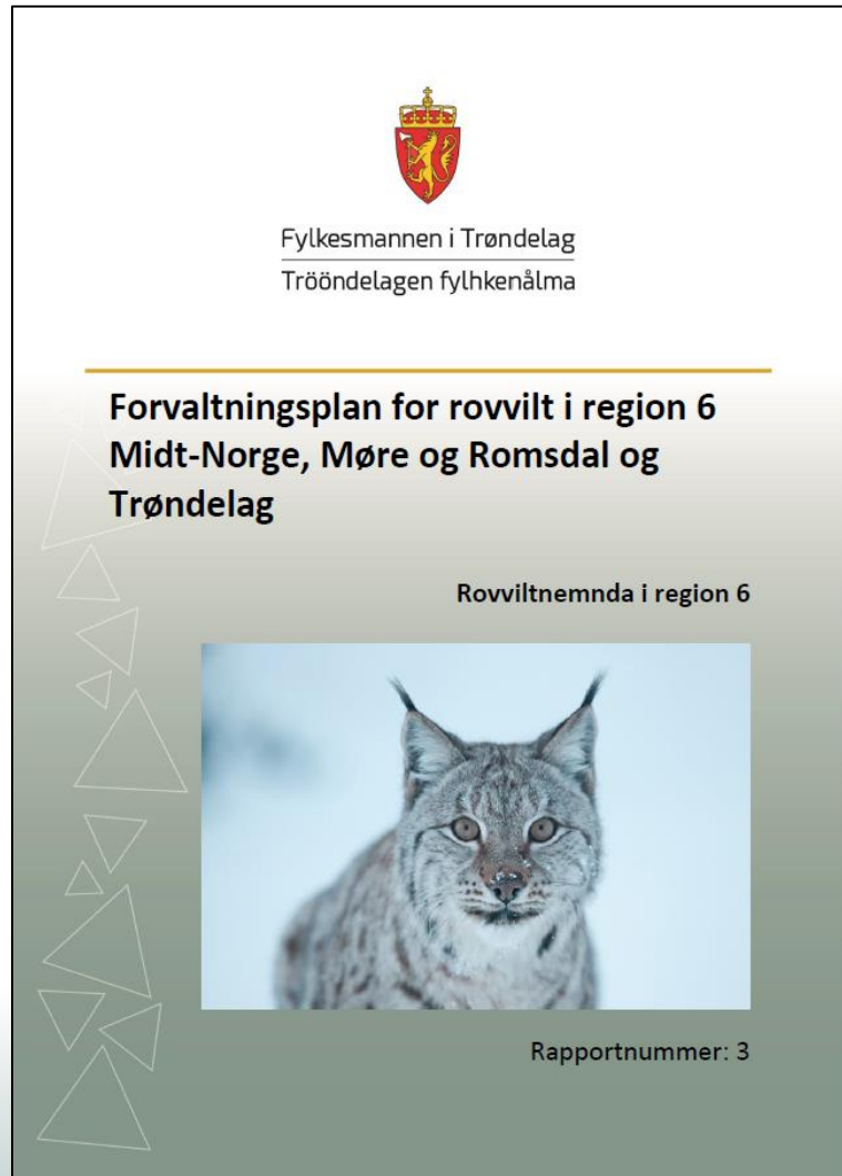
10 Forvaltningsområder for rovvilt i region 6 Midt-Norge