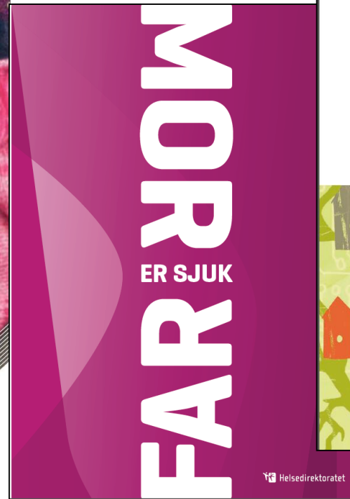
Regelverk om barn som pårørende 2010