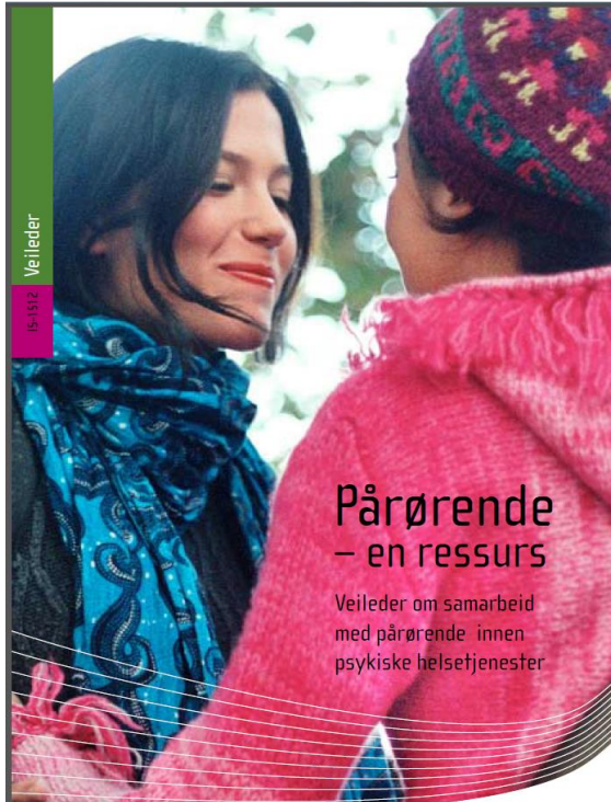
Forrige pårørendeveileder 2008