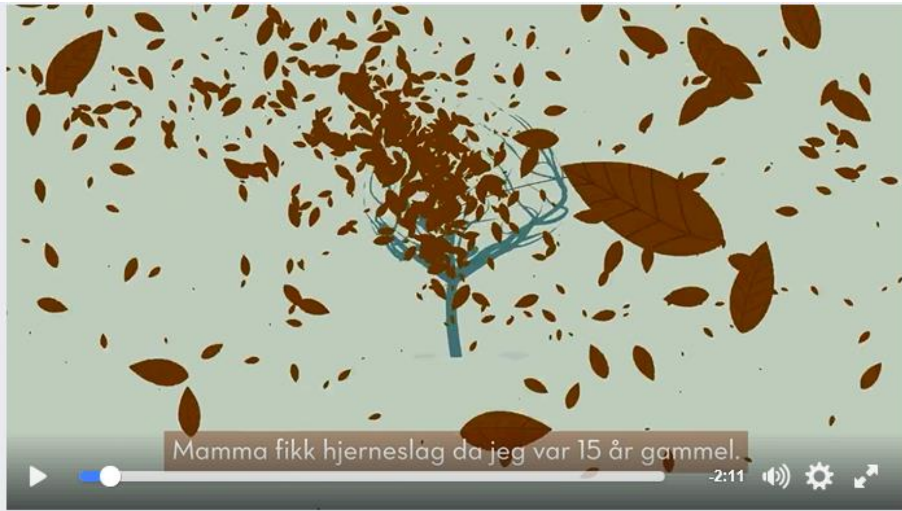
Film om pårørende – 2 minutter (Youtube)