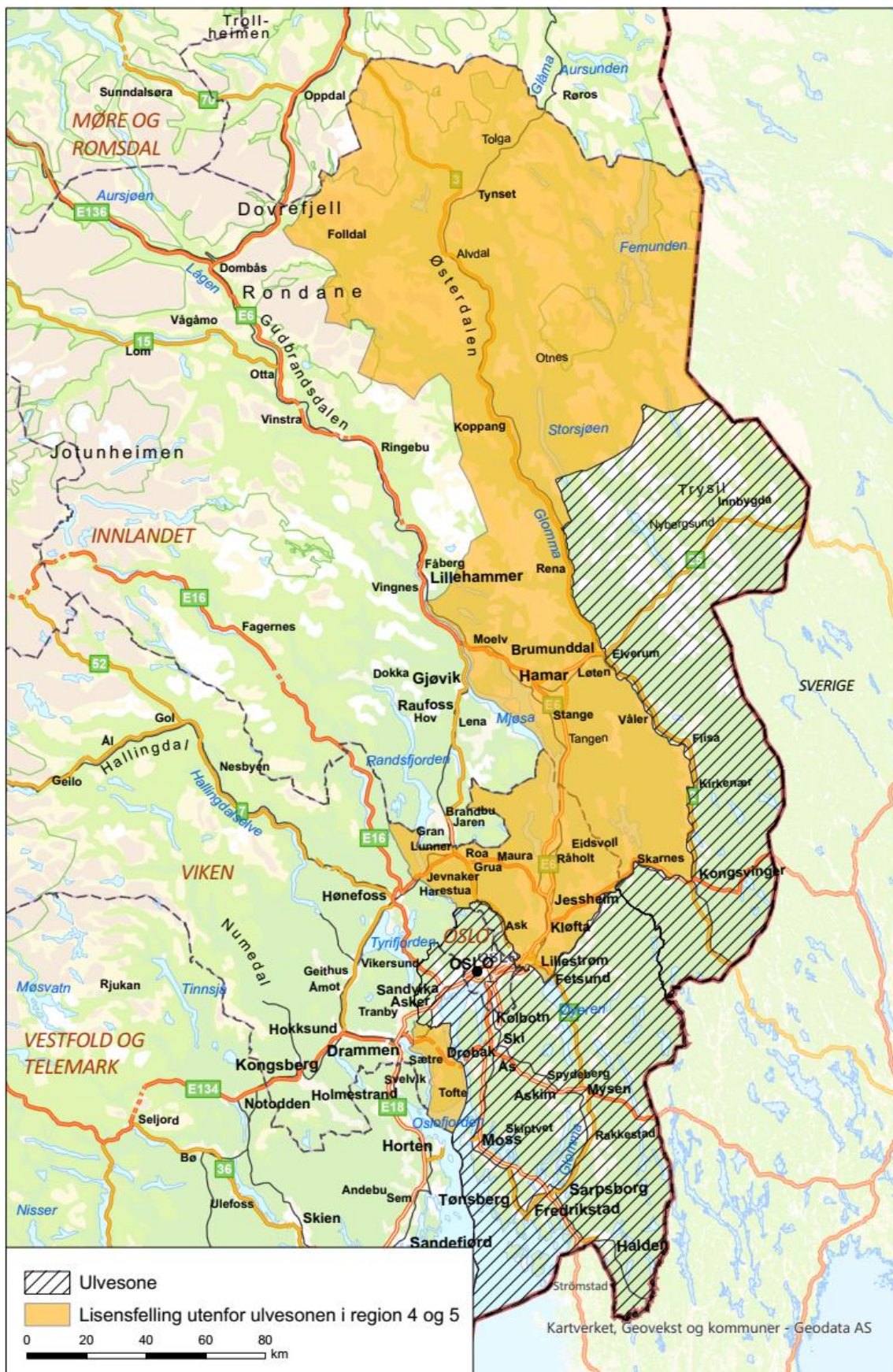
Kart over foreslått område for lisensfelling av ulv utenfor ulvesonen i region 4 og 5 i 2023/2024.