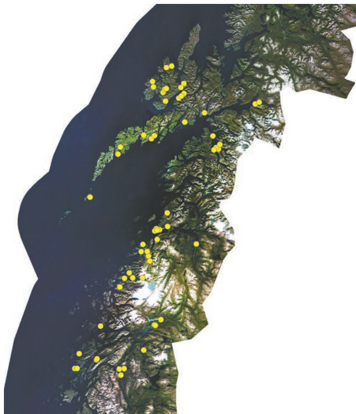
Lokaliteter hvor Fylkesmannen i Nordland har utført forurensningstilsyn i 2018.