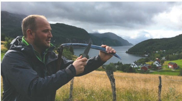
Statsråd Jon Georg Dale på Engan-Ørnes.