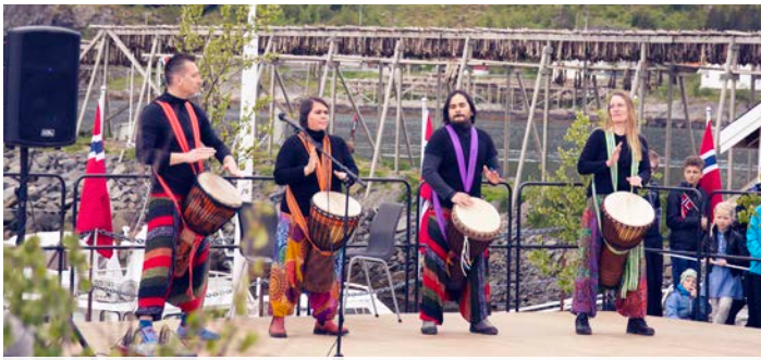
Kulturfest i Moskenes.