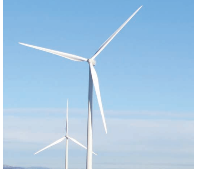
Det skal utarbeides en nasjonal ramme for vindkraft på land.