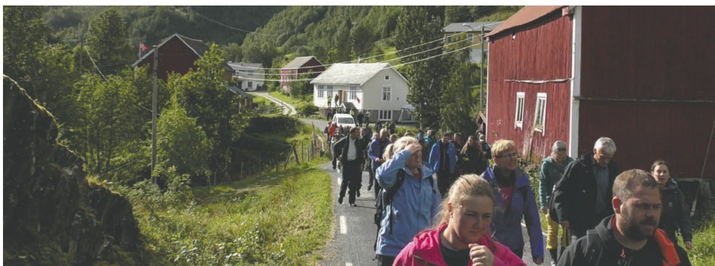
Fottur på Engan-Ørnes.

I 2018 var landbruks- og reindriftsavdelinga involvert i planlegging og gjennomføring av en stor samling for landets 46 utvalgte kulturlandskap i jordbruket og de to verdensarvområdene Vegaøyen og Vestnorsk fjordlandskap.