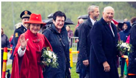
Kongeparets fylkesbesøk startet i Sørfold.

I løpet av tre hektiske og flotte dager i juni 2018 fikk folk i Sørfold, Steigen, Røst, Værøy og Moskenes besøk av Kong Harald og Dronning Sonja.