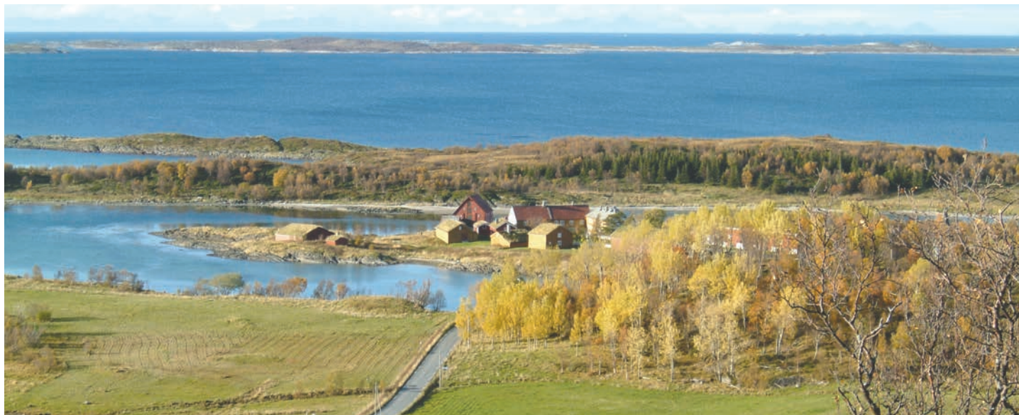
Landbruket i Nordland er ei viktig næring, både for enkeltkommuner og for hele fylket.

Embetet er organisert i sju avdelinger og ledes av fylkesmann, assisterende fylkesmann, avdelingsdirektører og underdirektører. Strategisk ledergruppe består av embetsledelse og avdelingsdirektører. Avdelingene er ulik organisert. Noen er seksjonert, andre ikke. Avdelingsdirektørene har økonomiansvar i samtlige avdelinger.