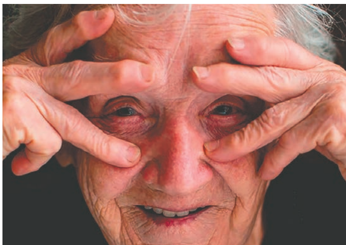
Leve hele livet er en kvalitetsreform for eldre. Illustrasjon fra Stortingsmelding 15 (2017-2018).

Tidligere reformer har ofte handlet om systemer. Leve hele livet handler om mennesker. Det som er viktigst i livet. Med Leve hele livet skal eldre få mulighet til å mestre eget liv der de bor, hele livet.