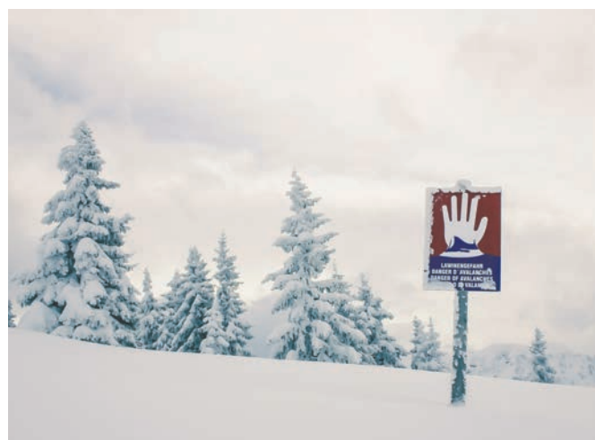
Snøskredfare er ikke alltid merket.

Torsdag 19. april 2018 sendte NVE ut varsel om snøskredfare faregrad 5 på Helgeland. Dette var første gang i Norge at NVE tok i bruk høyeste nivå på fareskalaen.