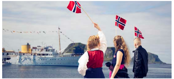
Befolkningen på Røst hilste Kongeparet velkommen i strålende solskinn.