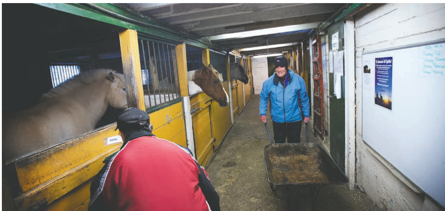
Stell i stall.