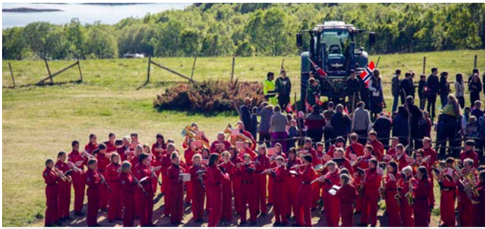
Flere hundre personer hadde møtt opp på Vollmoen i Steigen.