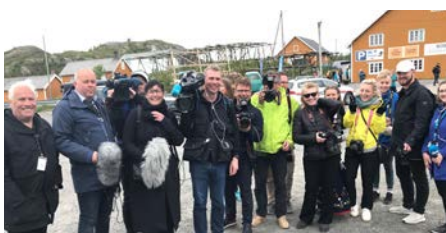
En stor gruppe med pressefolk fulgte Kongeparet under fylkesturen.