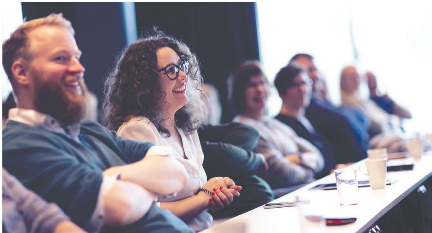
Totalt jobber det 165 medarbeidere hos Fylkesmannen i Nordland.

De ulike fagdepartementene og direktoratene gir oppdrag til Fylkesmannen innenfor sine politikkområder og sektoransvar. Det betyr at Fylkesmannen har arbeidsoppgaver innenfor mange sektorer og samfunnsområder.