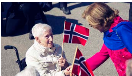
En eldre dame på Røst hilser på Dronningen.

Hvert år gjennomfører Kongeparet en fylkestur. I 2018 var det Nordlands tur igjen. Da var det ti år siden forrige fylkesbesøk.