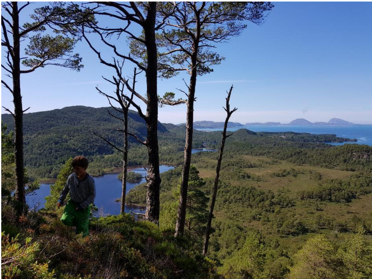
Figur 1 På Svanøy, populært kalla Sunnfjords perle, er vi i gang med frivillig skogvern på ein stor del av øya. På biletet kan ein sjå Kvalstadmyrene til høgre og Vågsfjellet om lag midt i biletet bak furutrea. Nordveggen av Vågsfjellet er særskild rik på raudlista artar.

Svanøy har vore kartlagt fleire gonger gjennom tidene og skogen har alltid vore vurdert som ein biologisk «hotspot». Tilbudsarealet på Svanøy inkluderer 14 naturtypelokalitetar med m.a. fattig og rik boreonemoral regnskog, rik edellauvskog, gammalskog av både boreal barskog og lauvskog, låglands- og kystfuruskog, samt ein lokalitet av gamal svartorsumpskog. Det finst ikkje tilsvarende skog med kombinasjon av denne storleiken, alder, berggrunn, variasjon og klima på Vestlandet, noko det høge talet av sjeldne, sårbare og truga artar er levande bevis for.