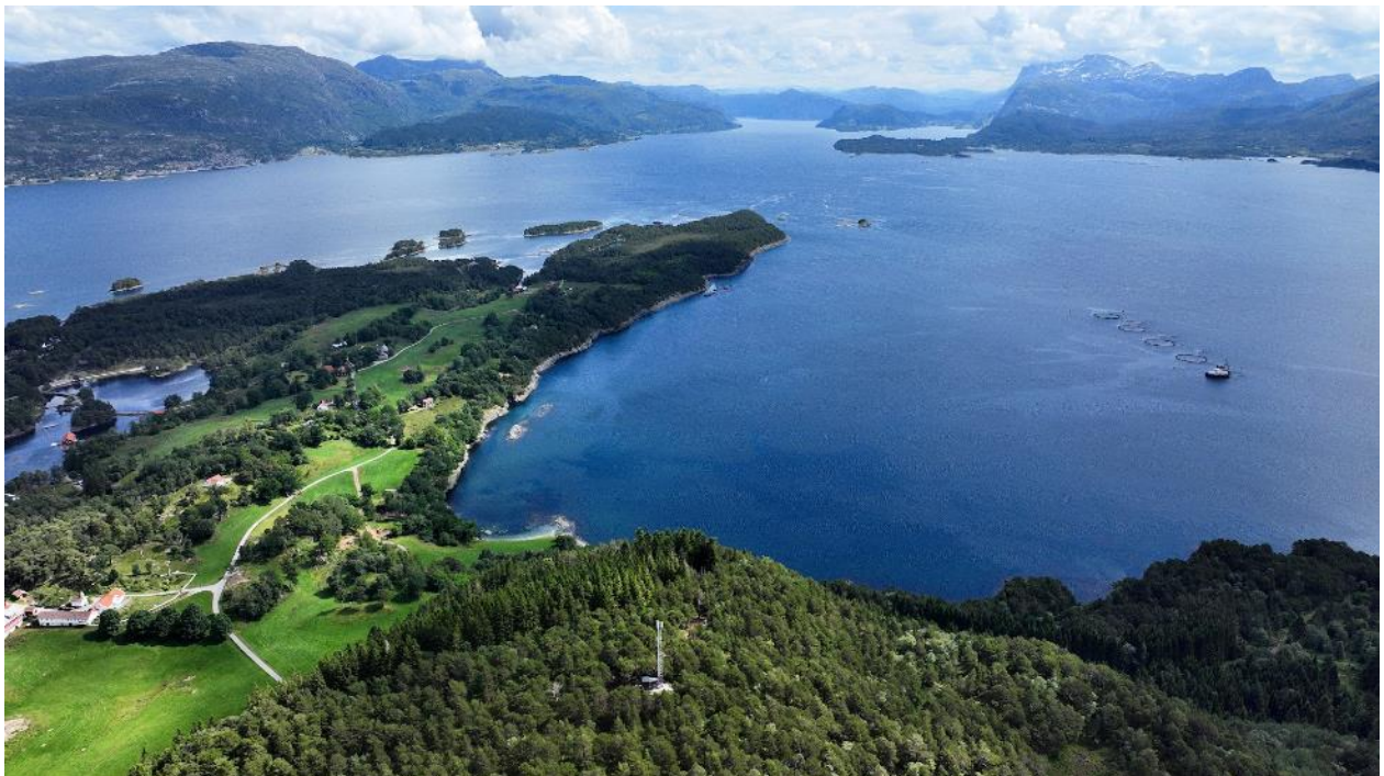
Figur 4 Storåsen i framgrunnen, der mobilmasta og granbestanden er synleg. Det austlege arealet av Svanøya naturreservat ligg på Austneset midt i biletet. Dei store, kvite bygningane nede til venstre er Svanøy hovedgård.

På Storåsen er det ei mobilmast. Den er relativt nyleg sett opp, og det var eit vilkår frå lokalbefolkninga og grunneigarane at den skulle setjast opp for at igangsettinga av verneprosessen skulle bli realisert. Det vil vere mogeleg å drifte og halde denne ved like på same måte som med kraftleidningar.