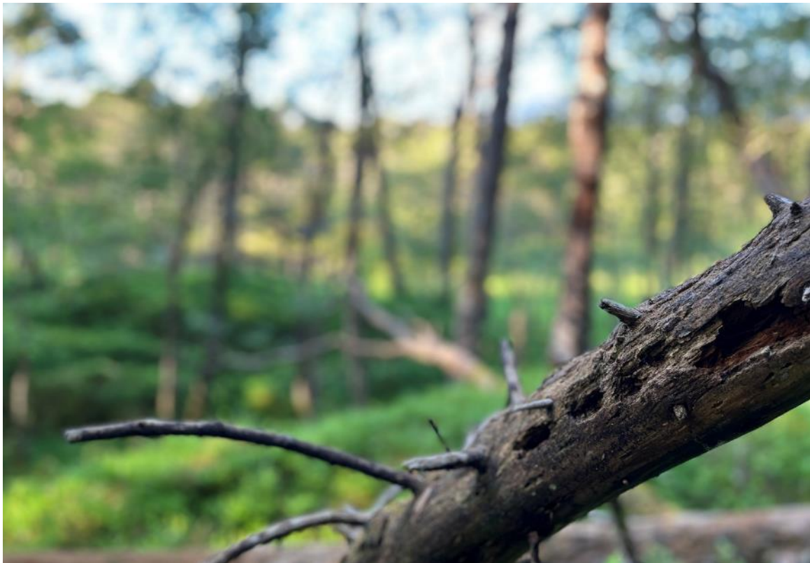
Figur 2 Det er registrert ulike naturtypar i skogen på Svanøy som til dømes varmekjær kjeldelauvskog, frisk rik edellauvskog, boreonemoral regnskog og gamal boreal barskog. Død ved er eit viktig element i skogen fordi så mange insekt, sopp og lav treng dette i livssyklusen sin. Då finn også hakkespettane mat, slik spora på biletet kan vitne om.

Svanøy ligg i kjerneområdet for fattig boreonemoral regnskog, ei truga naturtype som Noreg har eit spesielt ansvar for. Tilbudsområda er i si heilskap lågtliggjande, dei grenser mot fjorden på fleire sider av øya og det høgaste punktet er Vågsfjellet på 235 moh. Ingen øyer mellom Bergen og Molde har liknande variert og rik skogdekning som Svanøy. Føremålet med naturreservatet vil vere å ta vare på denne trua, sjeldne og sårbare naturen for framtida.