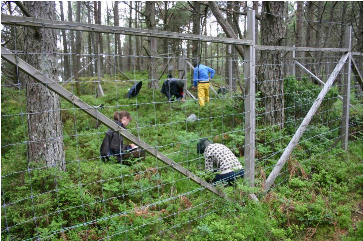
Figur 3 I skogane på Svanøy er det 10 hegn slik som den på biletet. Disse vart sett opp for 23 år sidan og har medverka til fleire artiklar om vegetasjonsdynamikk i skog.

Det meste av friluftsliv kan gå føre seg som tidlegare. Bålbrenning vil være lov med tørrkvist frå bakken eller med medbrakt ved i samsvar med gjeldande lowverk. Det er mange som nyttar seg av stinettverket på Svanøy når dei går på tur. Sidan det sjeldan er snø på Svanøy er stiane i bruk stort sett heile året. Fleire av stiane er merka og omtalt på Ut.no. Merking og rydding av eksisterande stiar er lov, og om det er behov for å merke og/eller rydde nye stiar som ikkje er avmerkt på vernekartet kan forvaltningsstyresmakta gje løyve til dette dersom vilkåra for dispensasjon er til stades. Forvaltningsstyresmakta kan gje løyve til tilretteleggingstiltak og oppsetting av turpostar på eksisterande stiar. Det vil vere mogeleg å ri med hest og sykle på stiane som er avmerkt på vernekartet, men ikkje utanfor disse.