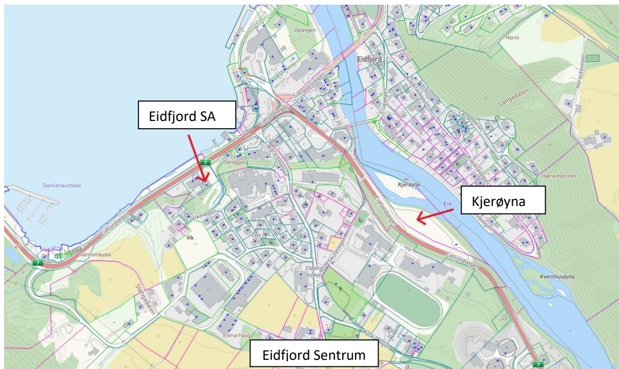
Figur 2 Eidfjord Sentrum med innmerka lokasjonar