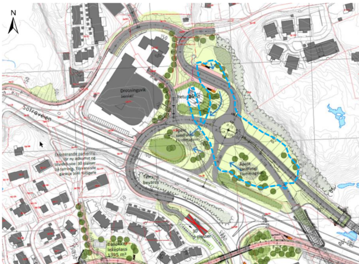
Figur 3. Utsnitt av landskapsplan for Drotningvik. Omrisset av Stivatnet er markert med blå, stiplede linje. Skjermdump fra søknad.

Under vegfyllingen vil det bli behov for å mudre/fjerne bløte bunnsedimenter som blir tørrlagt når vannet er nedtappet. Volum er usikkert, men antatt volum er ca. 50 000 m 3 . Mudringsmetode er enda ikke bestemt. Et alternativ er å bruke sugemudring til å fjerne det forurensede topplaget, og deretter bruke gravemaskin eller grabb. Sedimentprøver viste organisk materiale med sortbrun farge og høyt vanninnhold. Det er påvist konsentrasjoner av forurensing i de analyserte sedimentprøvene, sink og tunge oljeforbindelser (alifater >C12-C35) er registrert med tilstandsklasse 3, og benzen er registrert med tilstandsklasse 5.