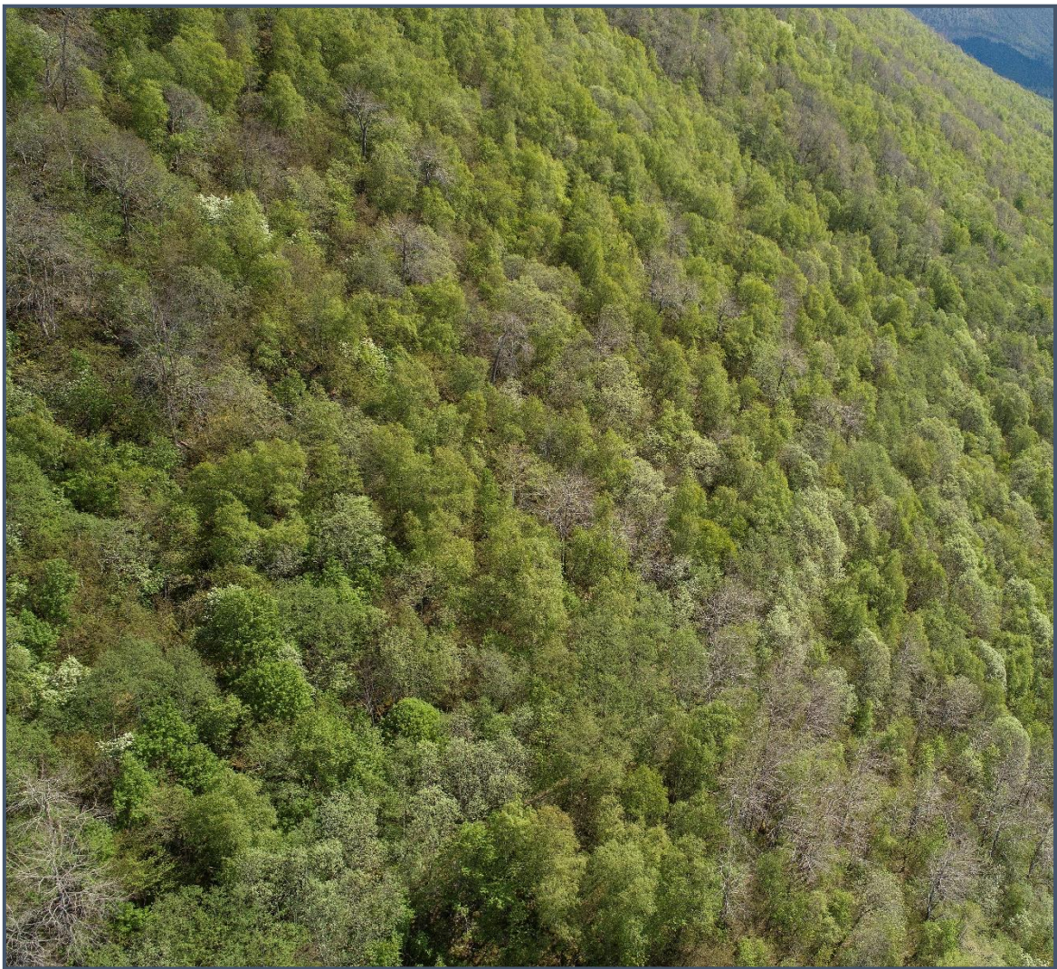
Rik edellauvskog ved Grisetstranda sett mot sør.