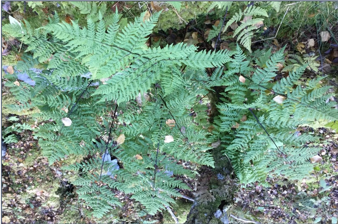
Bruntelg Dryopteris expansa (NT) funnet ved Grisetstranda naturreservat.