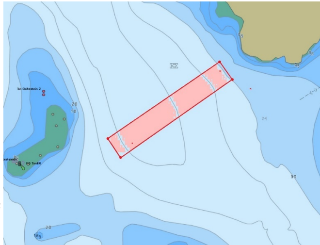
Figur 1: Plassering av anlegget ved Dyrholmen Vest etter utviding. I tillegg kjem fortøyingane som kan vere til hinder for fritidsfiske.

Merknaden frå Kjell Lieberg var at plasseringa av anlegget ville vere til hinder for båttrafikk i området. Det utvida anlegget vil fylle Utviding av anlegget vil ta mykje av plassen mellom Dyrholmen og Galtstein, men passasje med fritidsbåt mellom anlegget og Galtstein skal vere mogleg.