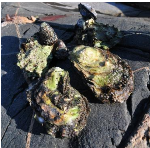
Figur 10 Stillehavsøsters.

Det finnes en rekke marine arter som ikke har kjent forekomst i regionen, men er problematiske som for eksempel kan introduseres gjennom ballastvann. Videre er det registrert flere fremmede marine arter i regionen hvor tiltak kan vurderes i noen områder, eller hvis det er en direkte trussel. Disse er lagt ved som vedlegg siden det ikke er hovedfokus i handlingsplanen. Se vedlegg 4 for mer informasjon om fremmede marine arter.