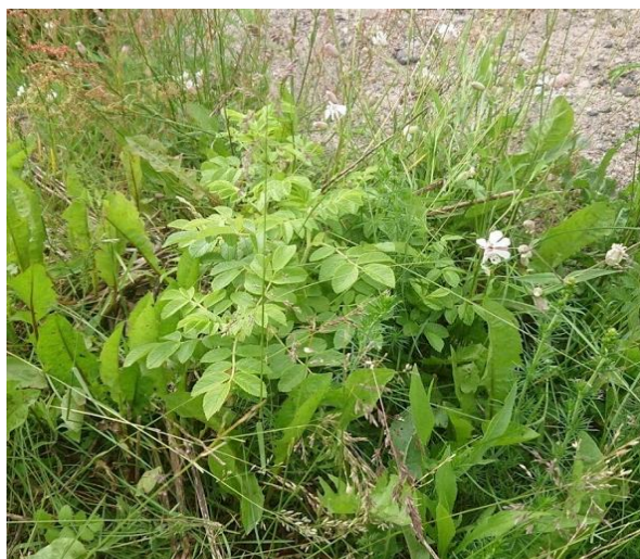
Figur 64 Liten rynkerose som fort kan øke i utbredelse. På et slikt stadie er det lite ressurskrevende og enkelt å fjerne.

Det finnes per i dag ingen enhetlig oversikt over beste praksis for bekjempelse. NINA laget en utredning på bestilling fra Miljødirektoratet i 2017 som er en kunnskapssammenstilling over bekjempelsesmetodikk og spredningshindrende tiltak for et utvalg av fremmede skadelige karplanter (se vedlegg 1). Databladene på fagus.no har tidligere vært en god referanse for bekjempelse, men databladene er ikke oppdatert i nyere tid. Det finnes for øvrig mye nyttig informasjon både på nettsidene til NIBIO, Plantevernleksikonet og Mattilsynet. Forsvarsbygg og Statens vegvesen har laget konkrete planer på praktisk bekjempelse innen sine ansvarsområder og har lang erfaring med fremmede karplanter.