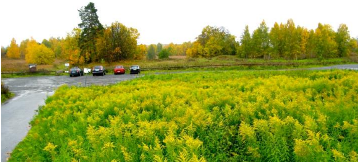
Figur 1 Eksempel på fremmed art som danner tette bestander som skygger for andre arter. Her fra en gammel eng på Fornebu som har grodd helt igjen.