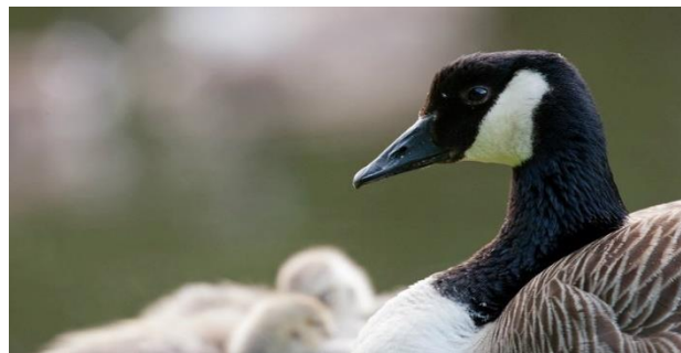
Figur 7 Kanadagås med unger.