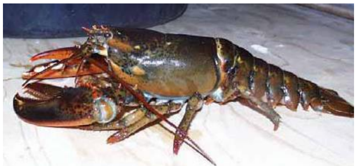
Figur 11 Amerikahummer.