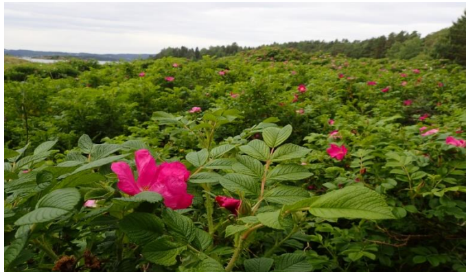
Figur 12 Stort rynkerosekratt på Langåra. Bekjempelse startet i 2017.

Noen ganger er det åpenbare spredningskilder nær viktig natur (i.h.t punktene over). Dersom det er fare for gjentatt spredning, skal slike forekomster ha høy prioritet.