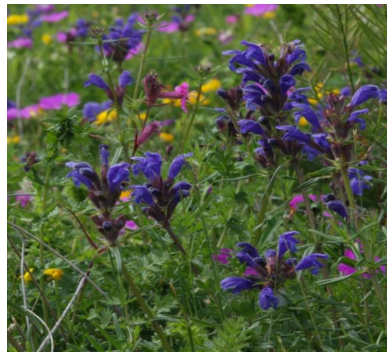
Figur 3 Dragehode

Hvitmure, oslosildre, dvergtistel, ru jordstjerne, ulljordstjerne, storporet flammekjuka og dragehodeglansbille er eksempler på eksklusive arter som i Norge har sin eneste eller viktigste utbredelse i Oslofjordområdet. Her møtes blant annet nordlige, sørlige og vestlige plantearter. Øyene her representerer noen av de rikeste områdene vi har i landet, både når det gjelder flora, fauna og geologi. Vi vet at omkring 80 prosent av alle landets arter finnes i de kalkrike områdene i Oslofjorden, med insekter som den største gruppen. Det ble blant annet registrert 445 karplantearter i 2011, hvorav 28 er oppført på Rødlista fra 2010.