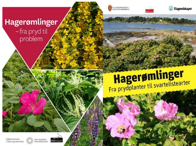
Figur 13 Brosjyrer til hageeiere med formål om å øke kunnskap om fremmede arter

Bevisstgjøring og informasjon om de bestemmelser som gjelder fremmede arter er også viktig å få ut i næringslivet; til entreprenører, gartnæringsnæringen, jord- og skogbruksnæringen, enkeltpersonsforetak og bønder.