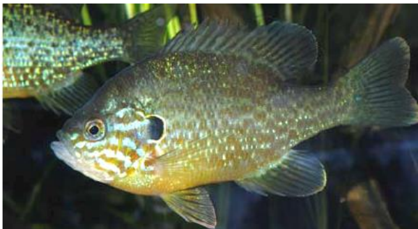
Figur 8 Rødgjellet solabbor.

Svanemat er en vannplante som flyter på overflaten. Ble først observert i Gjølssjø i Østfold, men er senere funnet i nordenden av Øyeren. Så langt vi kjenner er spredningen av arten relativt effektiv, men vi kjenner ingen negative økologiske effekter av arten.