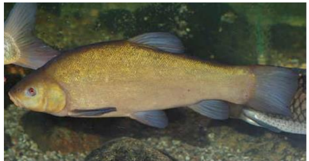
Figur 9 Suter.