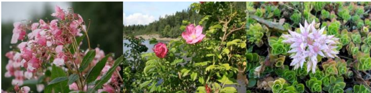
Figur 4 Prydplanter som opptrer invaderende i naturen i deler av Oslo og Viken. Venstre bilde: Kjempe-springfrø finnes mest i innlandsnaturen og sprer seg langs veier og vassdrag. Midtre bilde: Rynkerose sprer seg blant annet med nyper i vann og er blitt særlig problematisk på strender. Høyre bilde: Gravbergknapp opptrer i kalkrike miljøer, og danner tette matter på mange øyer i Oslofjorden.

Arter som er knyttet til forstyrret mark og samferdselsårer, slik som russekål, kanadagullris og vinterkarse, har vist seg å ha relativt stor utbredelse i regionen. I tillegg har karplanter som syrin, gravbergknapp og russesvalerot vist seg å være invaderende på de kalkrike øyene og kystsonen på vestsiden av Indre Oslofjord og utgjør nå en stor trussel mot det rike og unike biologiske mangfoldet. Rynkerose er en annen problemart og er utbredt langs hele kysten i Oslo og Viken.