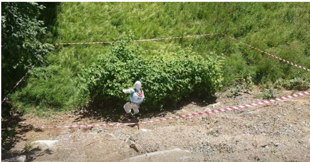
Figur 75 Kjemisk behandling av parkslirekne sommeren 2019.

Luking/oppgraving og innsamling, slått, beiting, tildekking og varmtvann er andre metoder som brukes i kampen mot fremmede arter. Hvilken metode som benyttes avhenger av hvor og hvilken fremmed art som skal bekjempes. Ved luking/oppgraving er det viktig at avfall som kan gi opphav til nye planter, og ikke dør ved kompostering, blir samlet opp og levert til forbrenning på et godkjent avfallsmottak.