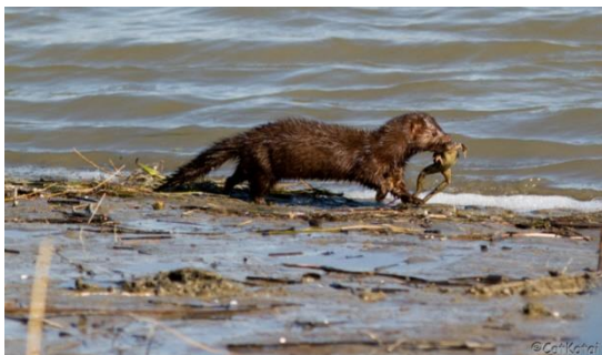
Figur 6 Mink.

Følgende arter er det ikke prioriterte tiltak mot, men bør vurderes ved neste revisjon av neste handlingsplan: Ribbesåtemose