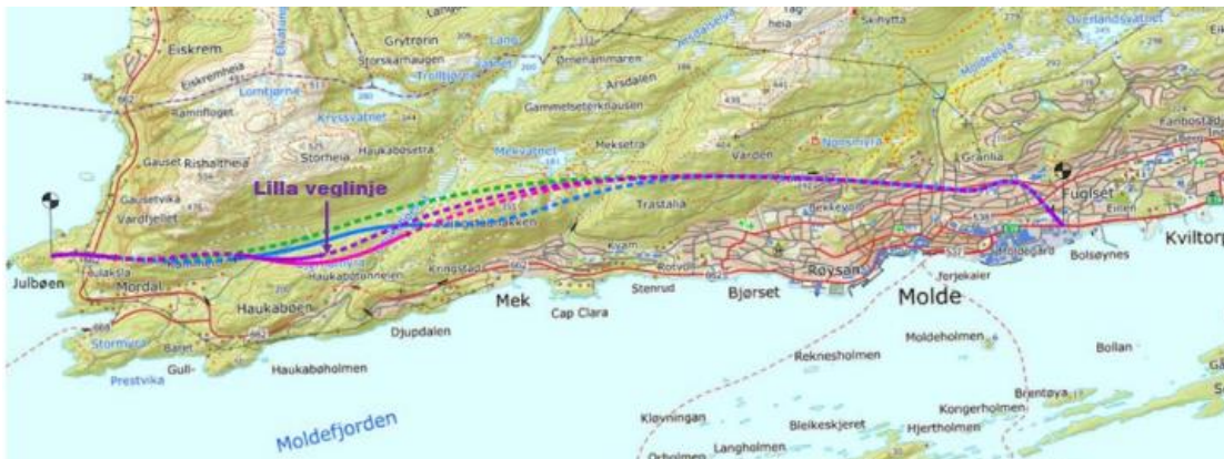
Kartet viser reguleringsområdet fra Julbøen til Bolsønes med de alternative traséene som ble vurdert, og den Lilla veglinje som ble vedtatt i kommunedelplanen.

Den aktuelle veglinjen som ble vedtatt i kommunedelplanen (planID 1502_K2020-01) er omtalt som Lilla veglinje. Traséen innebærer en kortere dagsone i Mordalen enn flere av de alternative forslagene som høringsinstansene hadde innsigelser mot.