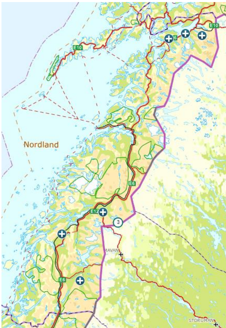
Kart over kjent avgang av jerv siden 28. mai, per 16. november 2020.