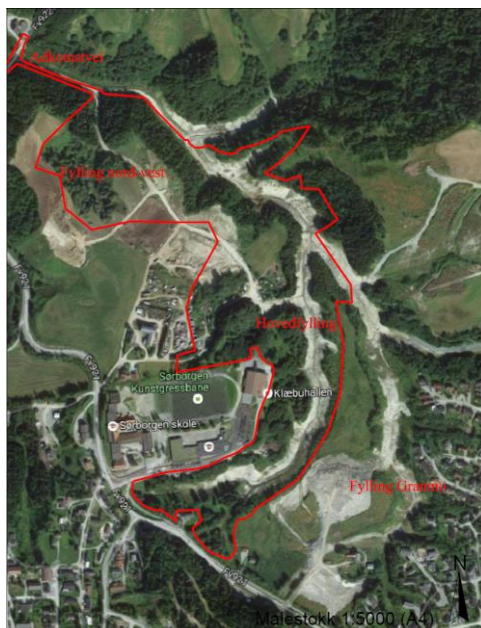
Figur 1. Planens avgrensning, fra planbeskrivelsen vedtatt 13.12.2018

T +47 73 84 10 00 https://no.ramboll.com