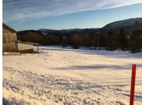
Fulldyrka jord på gnr10 bnr16