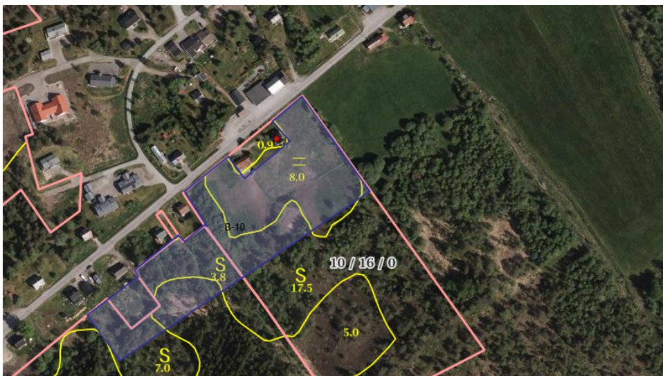
Utsnitt av B-10 henta frå gardskart.