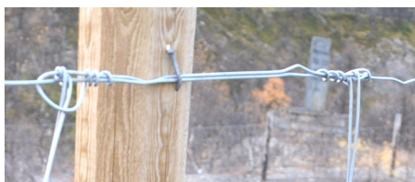
Detalj som viser skjot og festing av netting med spiker.

Spiker er anbefalt framfor kramper. Ved store snømengder, eller når elg presser på gjerdet, vil spikeren bøyes ut uten at netting eller stolper ryker