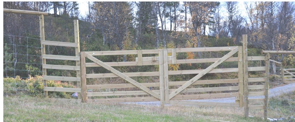
Et eksempel på dobbel grind. Merk forsterkningene på begge sider av grinda.