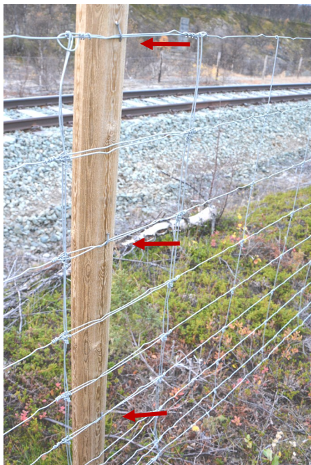
Gjerdet festes med 3 spikre (røde piler) - spikerdimensjon 2,8x75 mm. Skjøten har minst ei nettingrute overlegg.

Spiker er anbefalt framfor kramper. Ved store snømengder, eller når elg presser på gjerdet, vil spikeren bøyes ut uten at netting eller stolper ryker