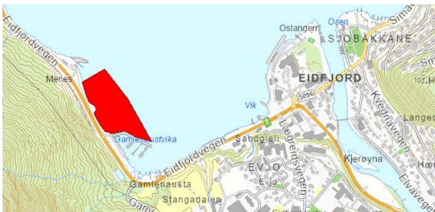
Figur 4: Kart over låssettingsplass nord for småbåthamna.

Fiskeridirektoratet påpeiker i si uttale at kommunen bør ta kontakt med Sør-Norges Fiskarlag og det lokale fiskarlaget i god tid før anleggsarbeidet startar, for å koordinera utfyllingsarbeidet med fiskeriinteressene. Dette skal sikra at merdar i låssettingsplassen nord for småbåthamna i Gamlenaustvika ikkje påverka.