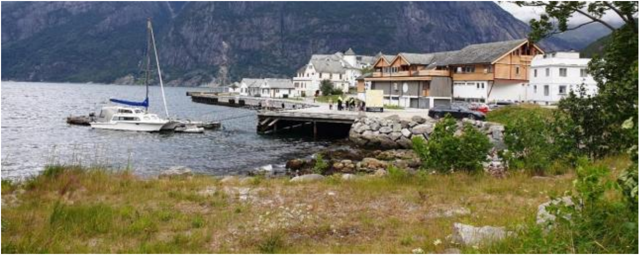
Figur 1: Området der det skal etablerast torg og tilbakeførast strand.

Delar av tiltaket har fått innvilga dispensasjon frå reguleringsplanen.