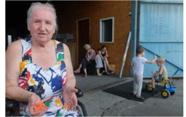
Dette bildet av Ukjent forfatter er lisensiert under CC BY-SA