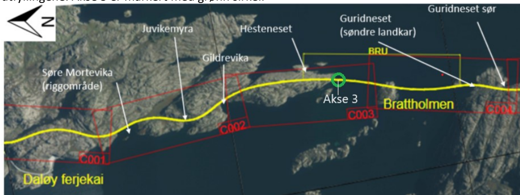
Figur 2. De seks lokalitetene for utfylling og mudring i sjø som er ferdig utført markert med hvite piler, samt utfyllingstiltaket det nå søkes om markert med grønn sirkel.

Figur 2 viser hvor utfyllingen det nå søkes om er lokalisert i forhold til de tidligere utførte utfyllingene. Akse 3 er markert med grønn sirkel.