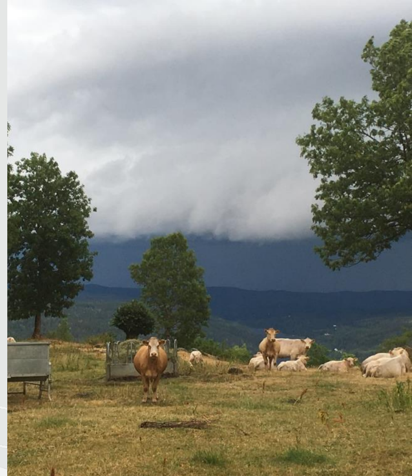
Melås i Gjerstad

Formålet med tilskudd etter forskriften er å bidra til å ivareta jordbruket sitt kulturlandskap, biologisk mangfold, kulturmiljøer og -minner, tilgjengelighet i jordbrukslandskapet, samt redusere bruk av plantevernmidler og utslipp til luft og avrenning til vann fra jordbruket.