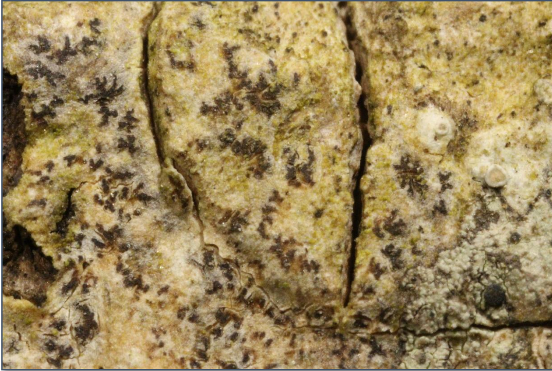
Stjerneflekklav Arthonia stellaris (VU) er registrert i den fattige boreonemorale regnskogen.

blåbær/storfrytledominert vegetasjon, men høgstaude- og storbregnevegetasjon. I dei flate partia ned mot vatnet er ein blandingsskog med sumpmark, fuktmark og i myrsig med fleire vasskjelder. Mangfaldet knytt til lav, mosar og karplanter uvanleg artsrikt og svært godt utvikla Signalartar for skogtypen som er registrert her er til dømes stjerneflekklav Arthonia stellaris (VU). Dette området er vurdert som nasjonalt viktig for ivaretagelse av regnskog i Noreg (MU2016-16).