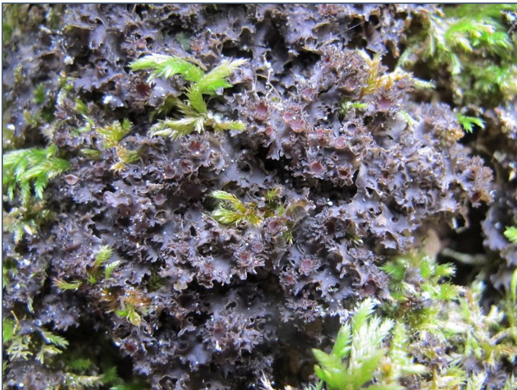
Kranshinnelav Leptogium burgessii (VU)- der en ekstrem nordgrense for kranshinnelav Leptogium burgessii (eneste i MR)

Lengst aust i tilbudsområdet som grenser til eksisterande verneområde finn vi den einaste kjende lokaliteten med rik boreonemoral regnskog i Møre og Romsdal (med verdi A) med si nordlegaste kjende grense. Skogen er karakterisert av mye grov alm (EN) opp mot 20 meter høge og ein diameter opp mot 80-90 cm. Andre mengdetreslag er bjørk, rogn og selje. Her er et enormt stort artsmangfold knytt til regnskog og gamle tre som til dømes kranshinnelav Leptogium burgessii (VU) med si nordlegaste grense for utbreiing.