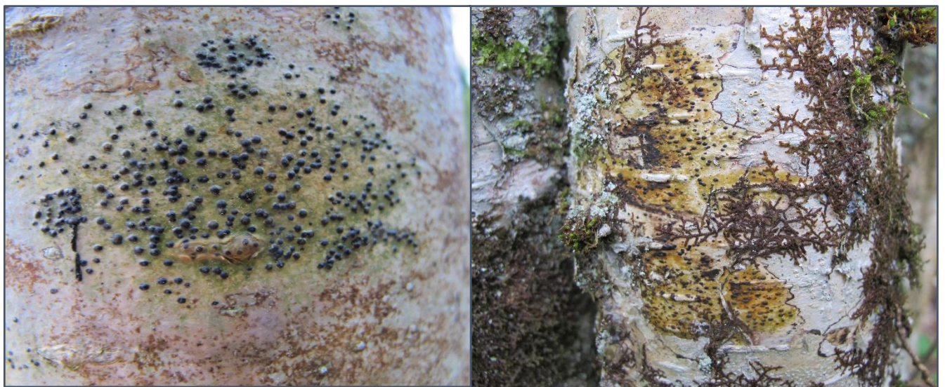
Gul pærelav Pyrenula occidentalis (NT) er funnet her i rik boreonemoral regnskog.