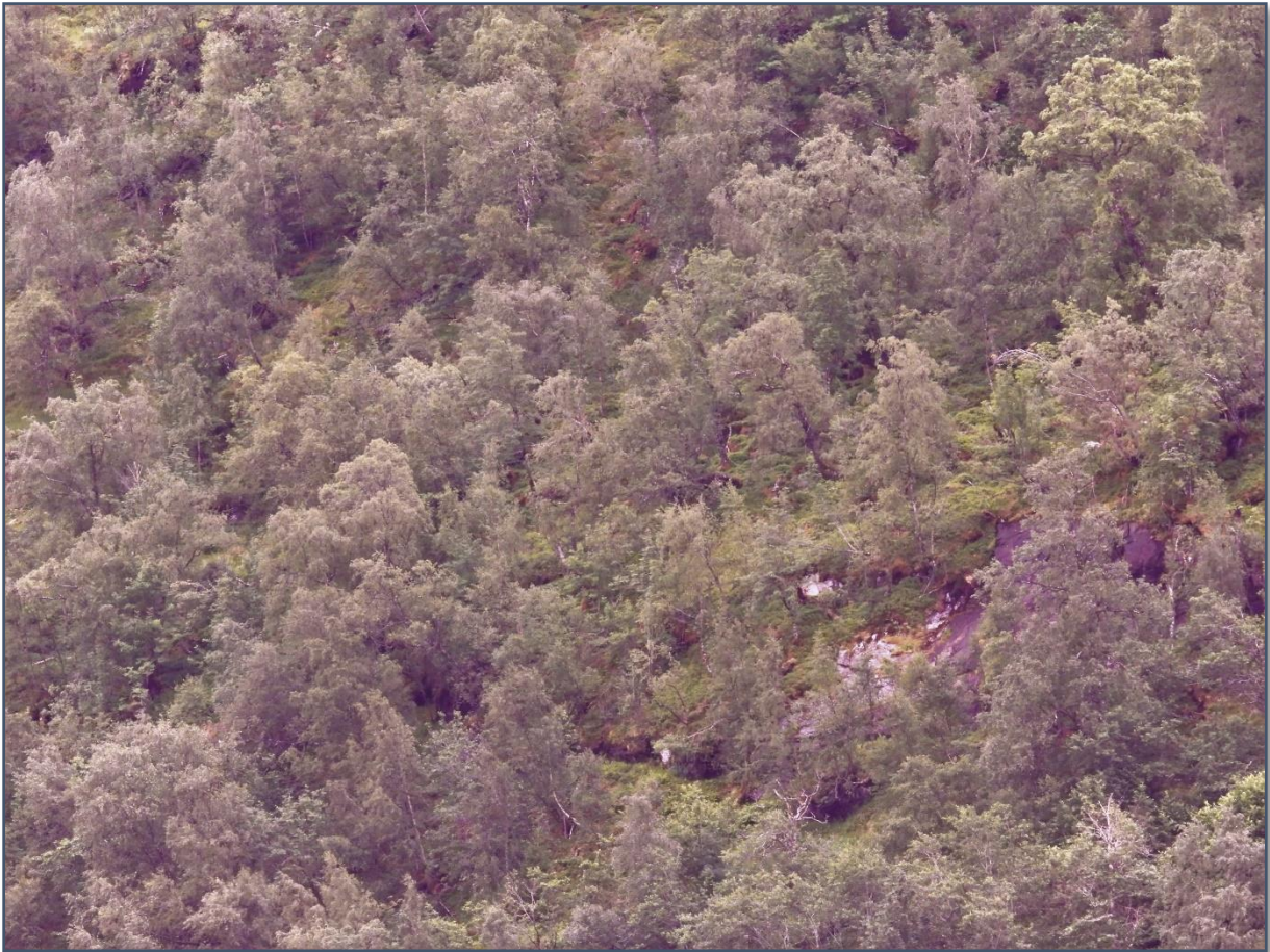
Boreonemoral regnskog ved Brusdalsvatnet.