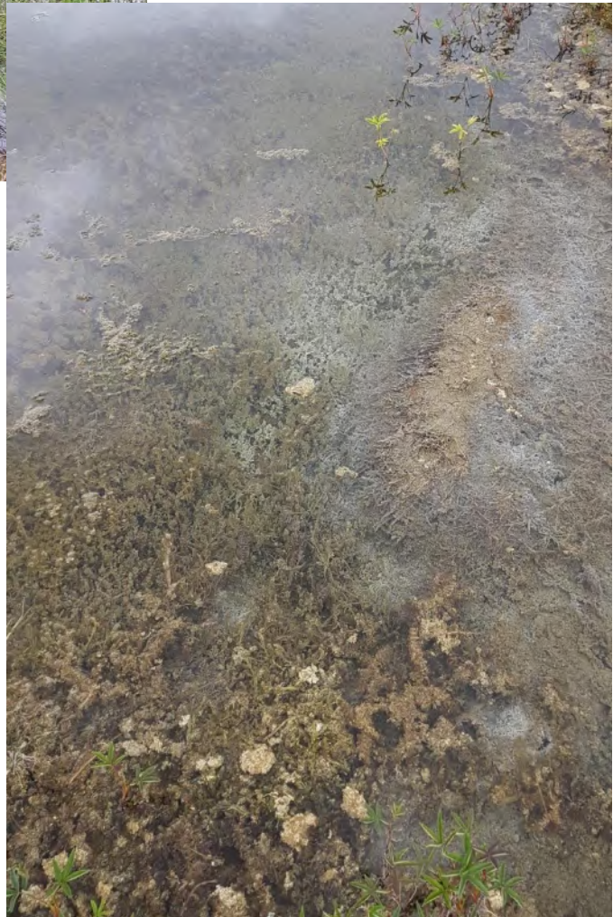
Bilde 6 viser gråe lag med finsedimenter som dekker vannvegetasjonen i Svanevatnet.