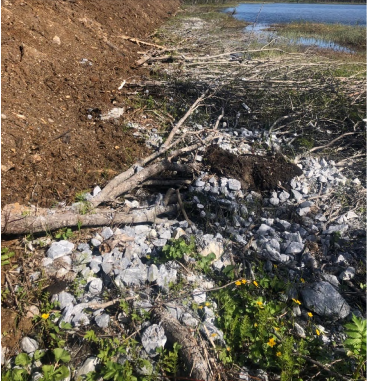
Bilde 1 er tatt nordover langs Svanevatnet av Fjelltjenesten under befarig 10.06.20. Her går fundamentet like utenfor verneområdet mens busker og pukk ligger inn Nautå naturreservat. Løsmassene skal fjernes av Forsvarsbygg.