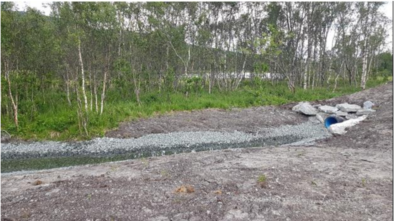
Bilde 4 viser nærbilde av dreneringsrør fra filteringsanlegg og parkeringsplass. Bildet tatt på befarings med Forsvarsbygg 08.07.20