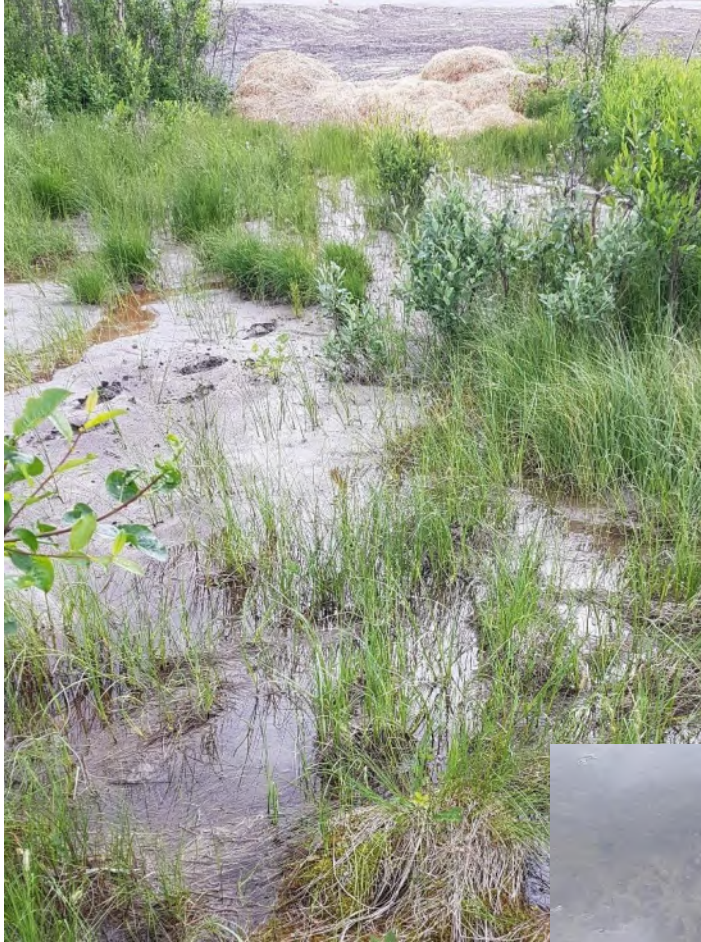
Bilde 5 er tatt mot fylling til nytt parkeringsareal. Utlagt halm vises i bakgrunnen. Det ligger tykke lag med finsedimenter i hele området, noe blant annet fotsporene viser. Bildet er tatt under befarings med Forsvarsbygg 08.07.20