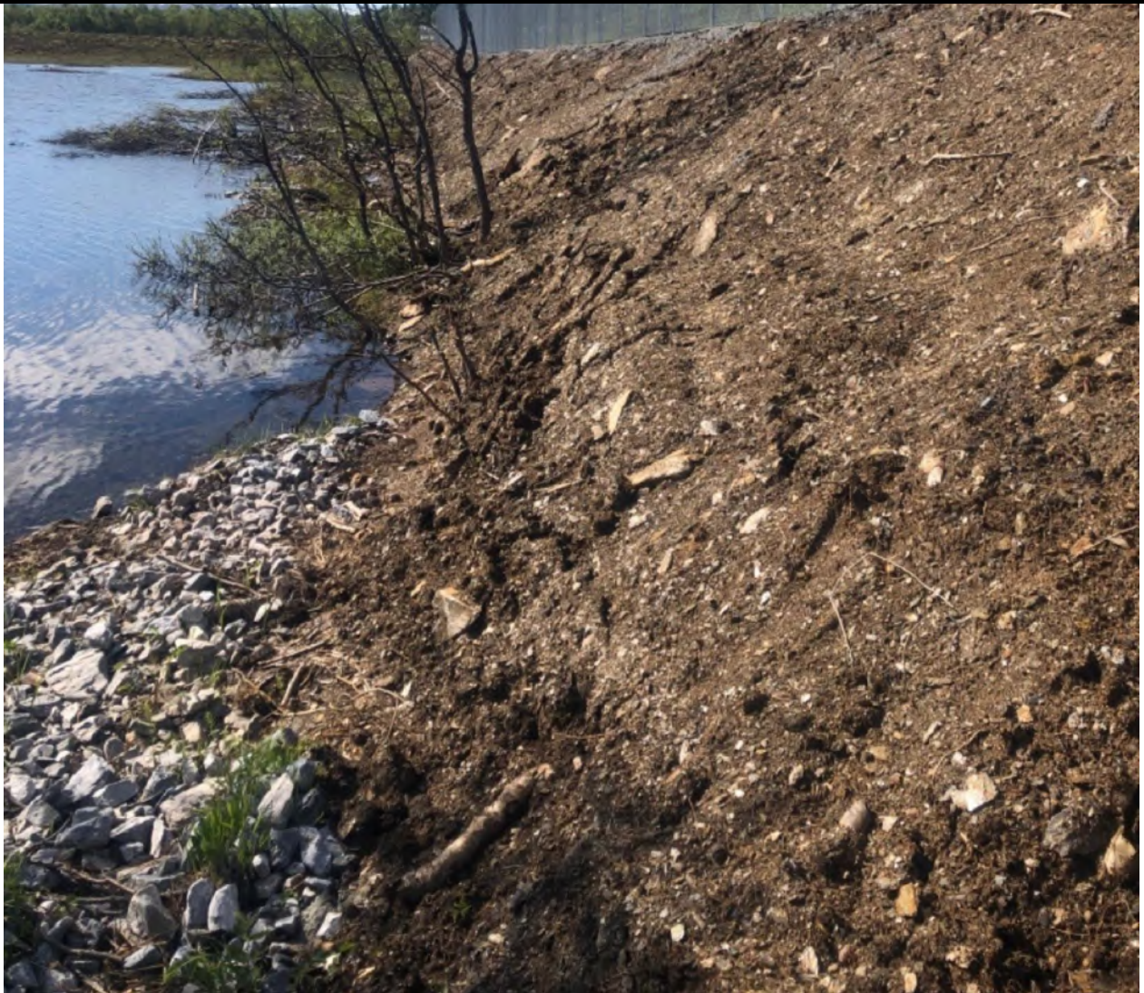
Bilde 2 er tatt sørover langs Svanevatnet mot det sørligste knekkpunktet i Nautå naturreservat. Bildet er tatt av Fjelltjenesten under befarings 10.06.20. Her ligger både fundament, busker og pukk inne i Nautå naturreservat. Gjerdefundament er lagt på duk. For detaljer på areal se figur 2.