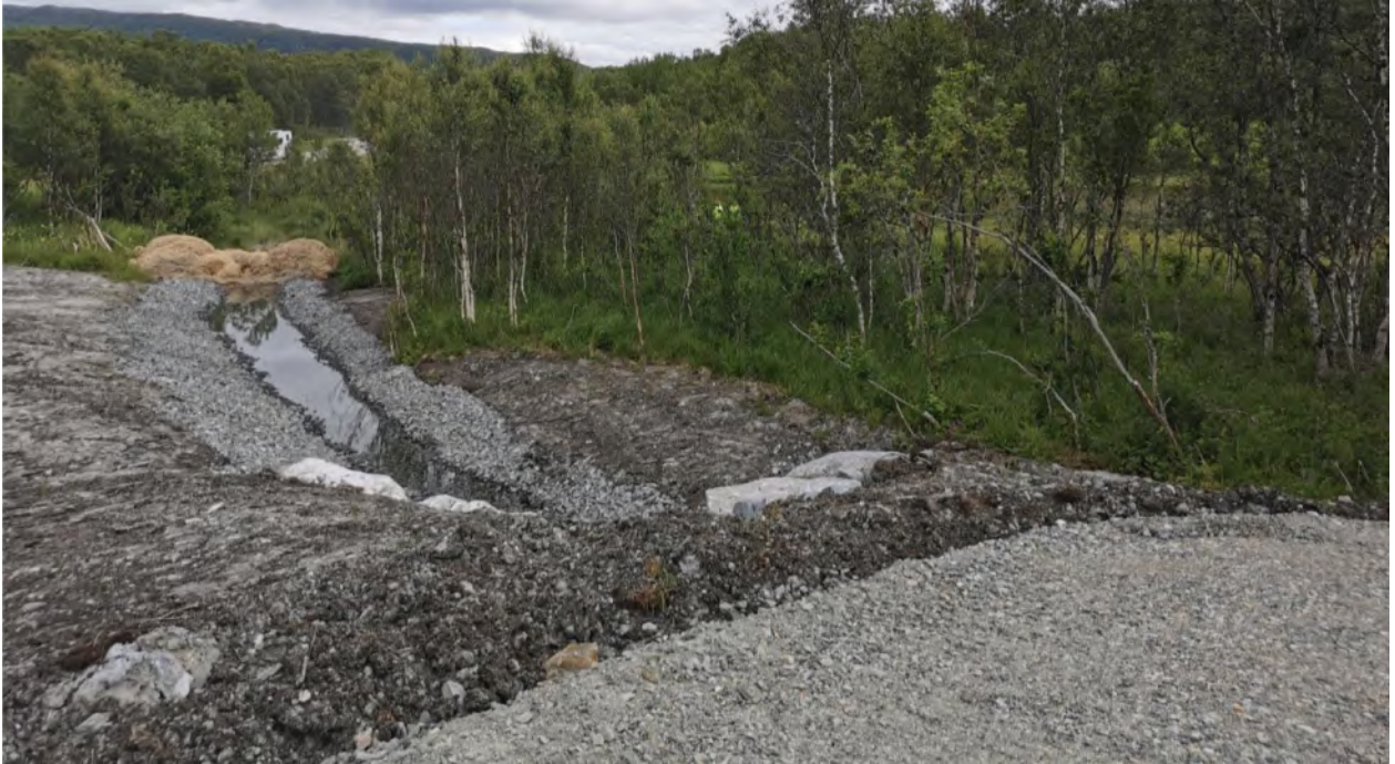
Bilde 3 er tatt fra fyllingen til nytt parkeringsareal og nordøst med Svanevatnet i bakgrunnen. Bilde viser kanaliseringen som er gjort mot Svanevatnet etter at dreneringsrøret slutter. Infiltrasjonshastighet i substrat ned mot Svanevatnet er ikke sjekket i forbindelse med prosjektering av parkeringsplass. Nederst ligger utlagt halm. Bildet er tatt under befarings med Forsvarsbygg 08.07.20.