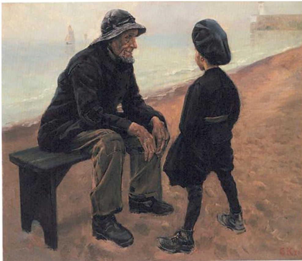
Christian Krogh: Gode venner