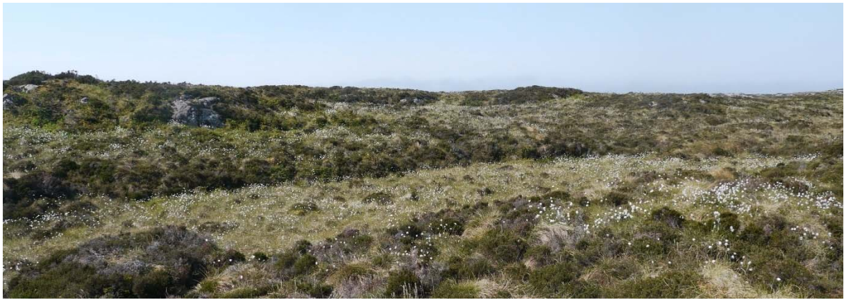
Figur 1. Spor etter tidlegare torvtaking. Foto: Solveig Kalvø Roald, 2.6.2016.

I leskråningar er lyngen høgvaksen og nokre stader har einer og småtre av furu fått etablere seg. Lyngheia på Fedje er likevel lite attgrodd samanlikna med dei fleste stader i Nordhordland, til dømes i Austrheim. Det kan vere fleire grunnar til det. Klimapåkjeninga er større på Fedje, og med mykje vind og kjølig lokalklima tek det difor lengre tid før det opne landskapet veks til med buskar og tre. På Fedje er det dessutan større avstand til eksisterande skog, og dermed er ikkje kjelda til frø så lett tilgjengeleg som på fastlandet innanfor (Moe, 2003).