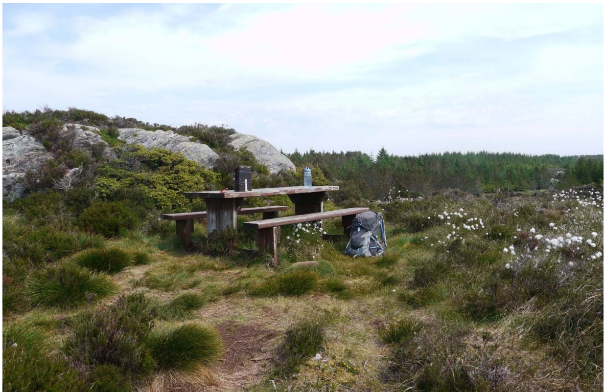
Figur 11. Endepunktet for den planlagde grusvegen og potensielt informasjonspunkt om lyngheidrift og vegetasjonshistoria på Fedje. Foto: Solveig Kalvø Roald, 2.6.2016.

Kommunen har signalisert at det per i dag ikkje er aktuelt med vidare tilrettelegging til Træneset for å lage ei rundløype gjennom landskapsvernområdet. Terrenget ved Træneset er for kupert og vil krevje større inngrep enn berre å gruse stien. Dersom det likevel skulle bli aktuelt med vidare tilrettelegging i Fedjemyrane, må dette skje som ei vidareføring av den nordaustlege traséen, medan den lengre, vestre traséen haldast i dagens enkle standard.