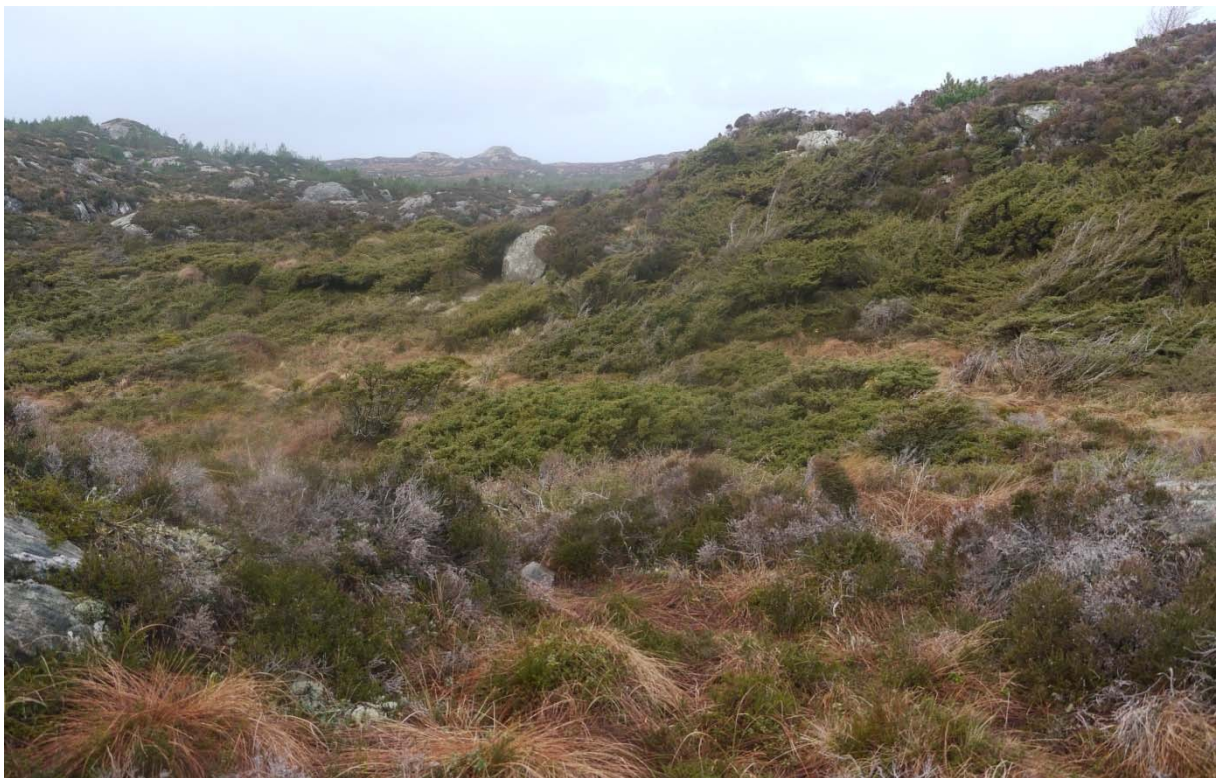
Figur 2. Gammal røsslyng og einer der skråningane ligg i le.