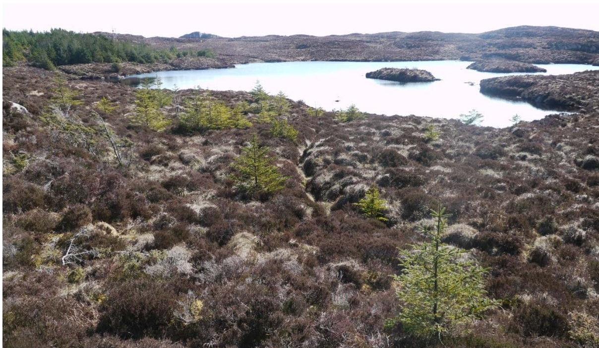
Figur 9. Sitkagran som har spreidd seg frå léplantasjen nord for Brurevatna.

På grunn av isolert lokalisering og lite areal er Fedje valt ut som eit prioritert område for fjerning av mink i Hordaland. Statens naturoppsyn har dei siste åra vore i land både på hovudøya og på dei andre øyane i Fedje kommune. Målet er at minken skal utryddast heilt frå Fedje kommune i løpet av dei neste åra. Dette vil innebere søk etter mink og uttak òg i sjølve landskapsvernområdet.