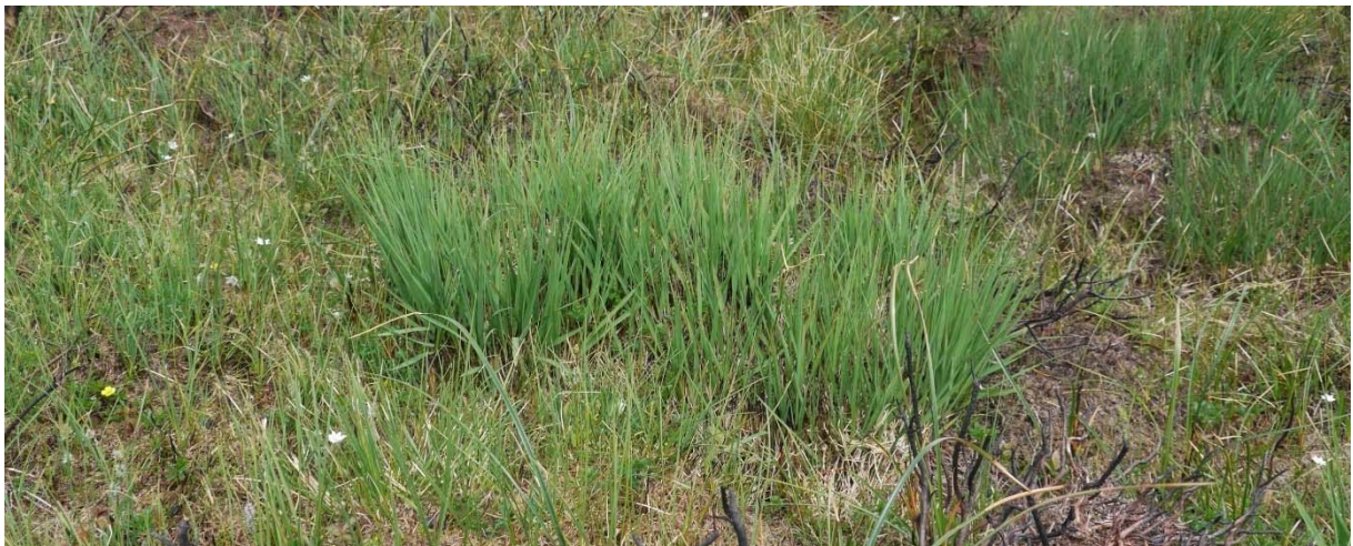
Figur 6. Blåtopp som kjem opp der det er nybrent. Foto: Solveig Kalvø Roald, 2.6.2016.

I området som blei brent i 2016, såg vi allereie i juli same året små spirar av ung røsslyng, sjå figur 5. I nokre område såg vi òg at det kom opp mykje blåtopp ( Molinia caerulea ). Blåtopp er eit gras som kan bli dominerande til ulempe for røsslyngen, særleg i område med god nitrogentilgang. Dersom blåtopp får dominere kan kystlyngheiene over tid endre seg i retning av grasheier. Dette er uønskt i Fedjemyrane sidan vi ønskjer at området skal fungere som beiteområde for sau. Beitedyra må ha tilgang på gode beiteplantar heile året og her spelar røsslyng ei heilt sentral rolle.