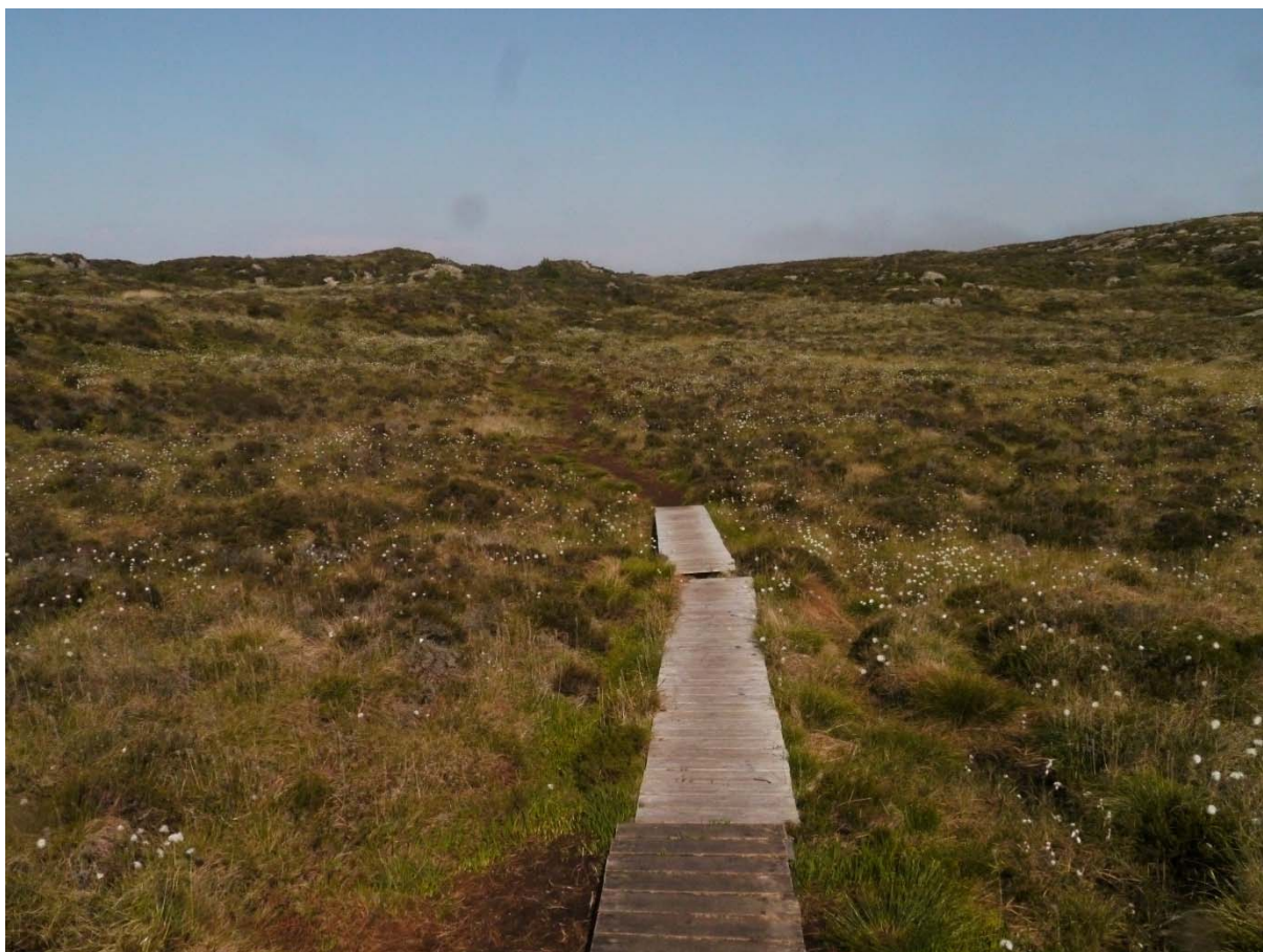
Figur 10. Dagens standard på stiane gjennom landskapsvernområdet. Foto: Solveig Kalvø Roald, 2.6.2016.