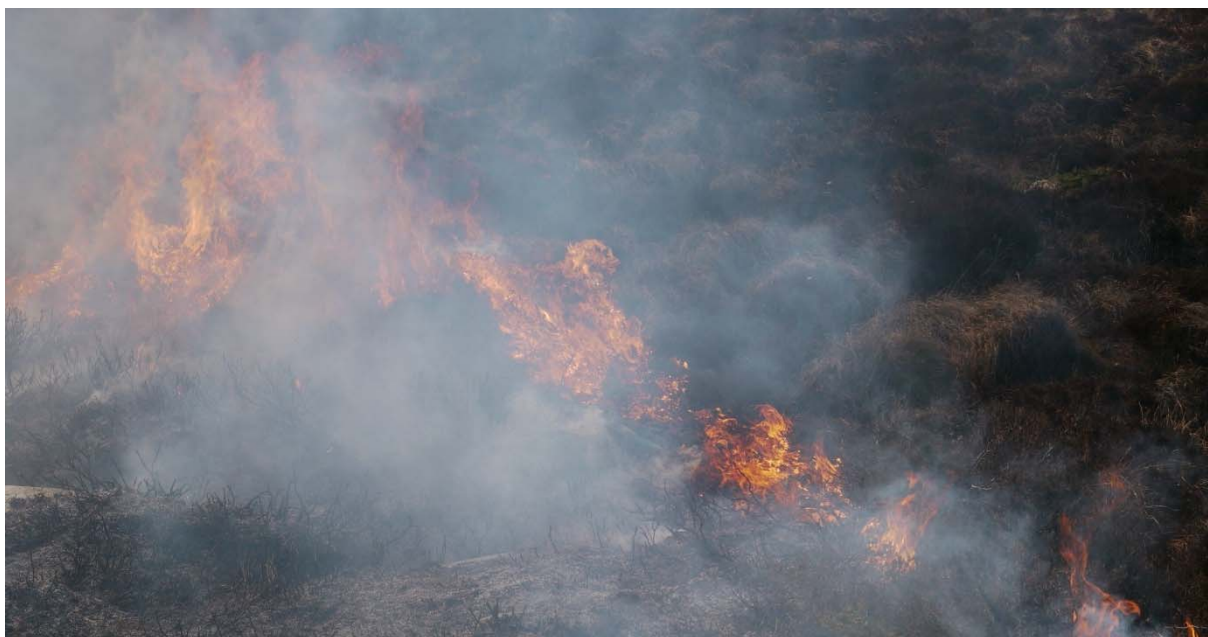
Figur 4. Skjøtselsbrenning april 2016.