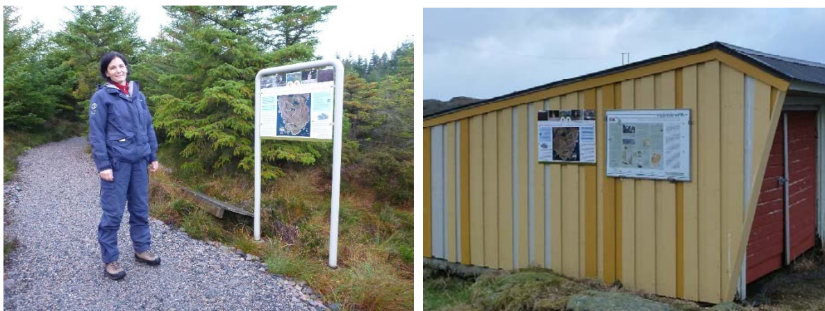
Figur 13 og 14. Gamle informasjonspunkt ved grusstien (venstre) og Fjellheim (høgre).

Ved innfallsportane i sør og aust vil vi ha store informasjonsskilt i 700 x 1000 mm liggjande format. Plakatane vil ønskje velkomen til området ha eit enkelt oversiktskart over søre delen av Fedje, og litt enkel informasjon om verneverdiane. Alle informasjonspunkt vil tilpassast det nye skiltssystemet for norske verneområde.