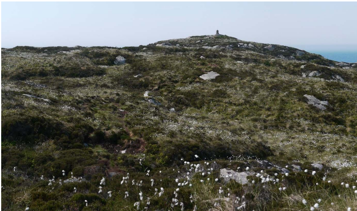
Figur 3. Mosaikk av terrengdekkande myr og fukthei vest i verneområdet. Foto: Solveig Kalvø Roald, 2.6.2016.

Store delar av myrane i området er påverka av torvuttaket, men enno er det nokre stader der det ikkje blei teke ut torv. Vest for Langevatnet er det bakkar som syner korleis det såg ut før dei starta med torvuttaket.