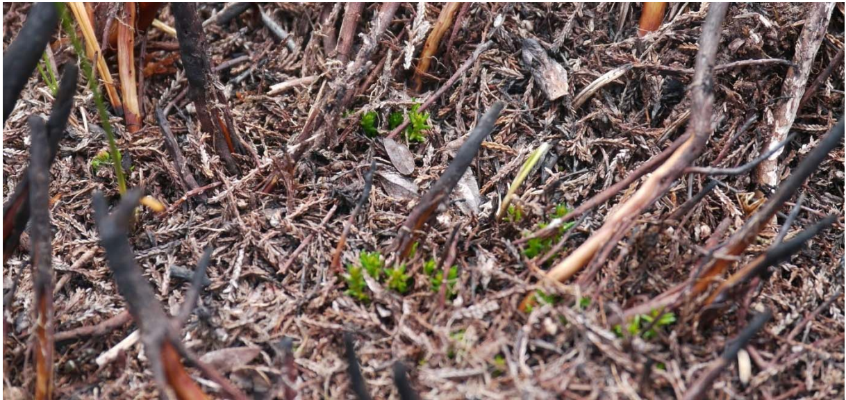
Figur 5. Nye røsslyngspirar kjem opp same året som det har blitt brent. Foto: Solveig Kalvø Roald, 2.6.2016.

Sjølv om lyngbrenning åleine vil bremse attgroinga vil det vere svært positivt å få i gang beiting med utegangarsau. Lyngheia er ein ressurs som kan utnyttast til beite dersom det finst vilje lokalt. Det er eit beitelag på Fedje som har vist interesse, og vi ønskjer å utvikle eit samarbeid med dei i løpet av planperioden. Vi legg stor vekt på å trekke inn krefter frå lokalt brannvesen, kommunen og lokale bønder. Målsettinga er å utvikle eit driftsopplegg som kan drivast vidare av lokale krefter og at beiteressursane i verneområdet blir utnytta.