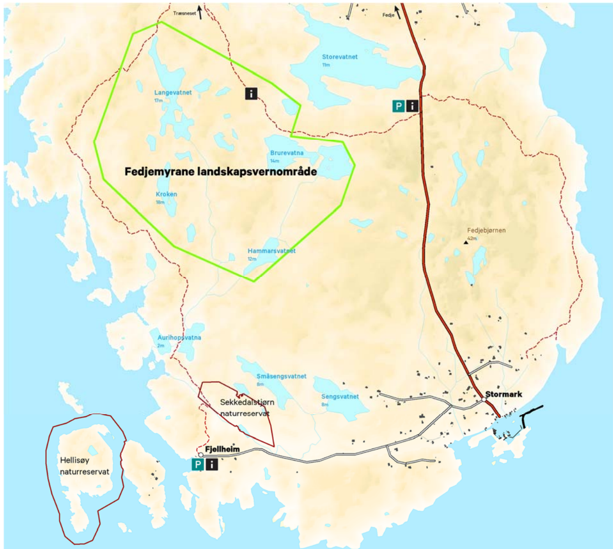
Figur 15. Kart som viser stiane gjennom Fedjemyrane landskapsvernområde, parkering og planlagde informasjonspunkt.