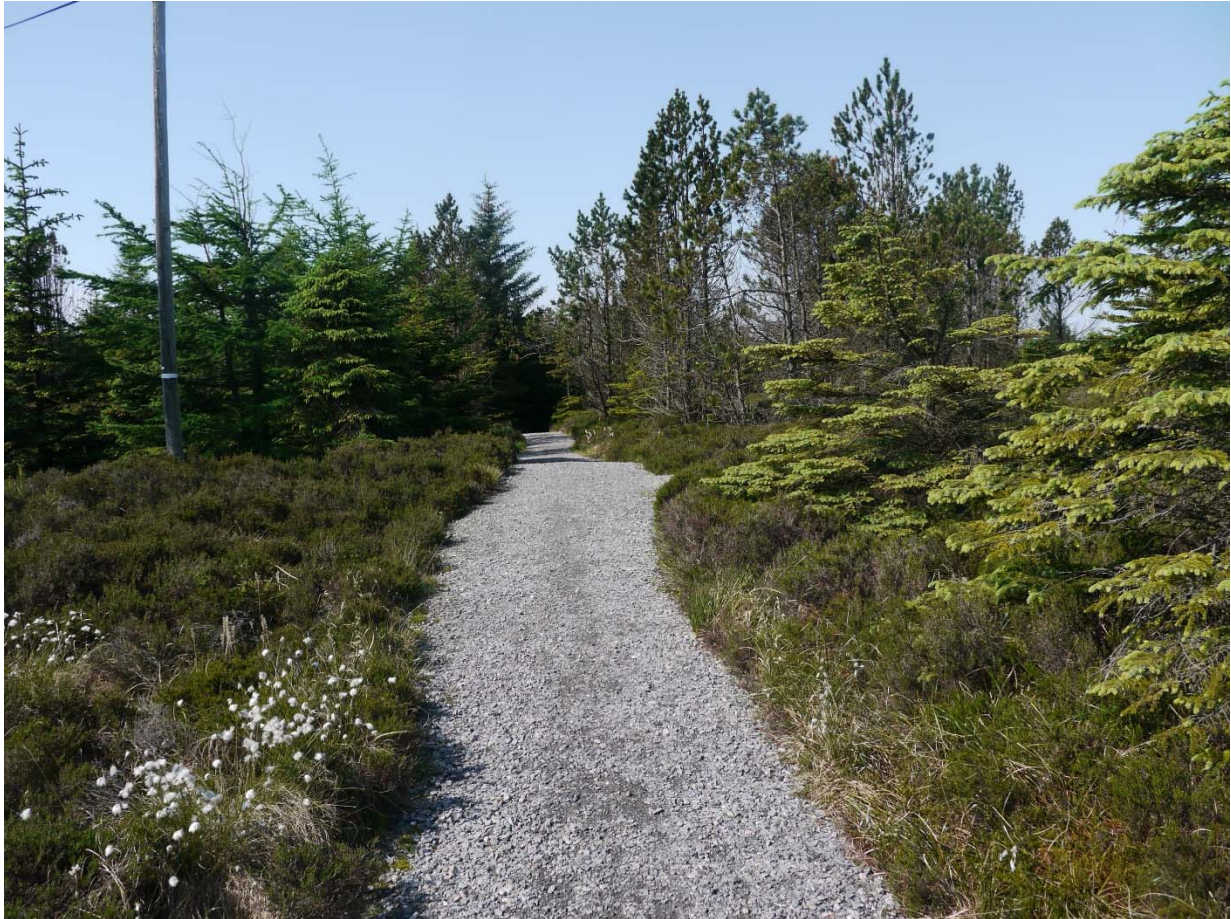
Figur 12. Grusstien frå parkeringsplassen og fram til vernegrensa framstår som lite inngripande og vil gjere Fedjemyrane tilgjengeleg for nye brukargrupper. Foto: Solveig Kalvø Roald, 2.6.2016.