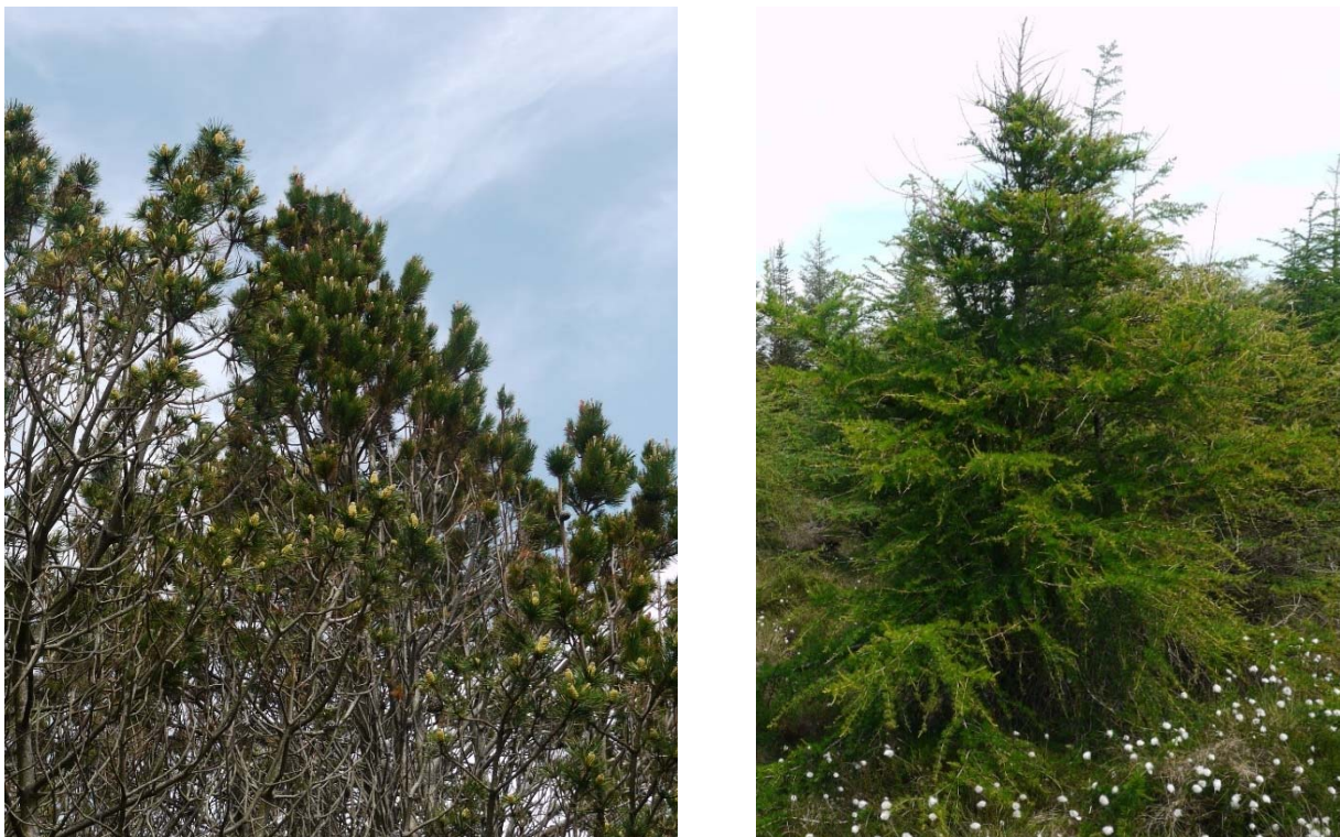
Figur 8. Venstre: Bergfuru. Høgre: Lerk. Foto: Solveig Kalvø Roald, 2.6.2016.

Vi legg opp til at jamleg brenning og beitedyr i lyngheia skal hindre vidare spreing av desse treslaga inn i verneområdet. Uansett vil overvaking av spreing av framande treslag ligge inne som eit fast oppdrag for Statens naturoppsyn.