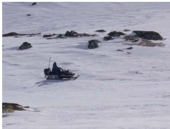
Motorferdsle i verneområda skjer i hovudsak med snøskuter på vinterføre.

Forvaltninga skal ha oversyn over korleis løyva blir nytta og kva som er det samla omfanget av motorferdsle i verneområda. Løyvehavarane skal difor rapportere nærare om kva køyring som skjer ved å fylle ut køyreskjema som sendes forvaltninga. Køyreskjema skal returnerast sjølv om ikkje løyvet er nytta. Forvaltninga orienterar SNO og DN om kven som har fått løyver og kva føremålet er.