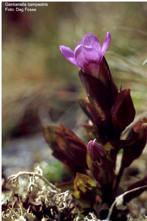
Bakkesøte ved Finse.

På toppen av Hallingskarvet er tilhøva så ekstreme at det berre er dei mest hardføre planteartane som kan leve der, som til dømes isssoleie. Det er i områda vest og sør for Skarvet at ein finn dei frodigaste og rikeste områda. På grunn av den næringsrike kalkgrunnen er botanikken rundt Finse særst interessant. På nordsida av Skarvet er jordsmonet i hovudsak dårlegare og fjellvegetasjonen er meir triviell. Men her kan ein og finne mindre område med rik fyllitt i grunnen.