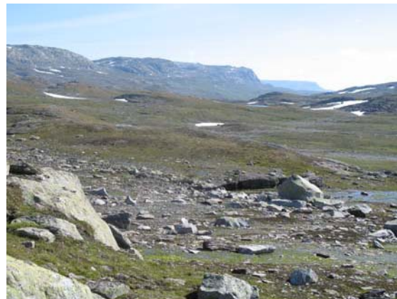
Lengjedalsbrotet sett frå Sandalsnuten.

Vernet hindrar ikkje tradisjonell turgåing, og heller ikkje organisert turverksemd til fots og på ski, så lenge naturmiljøet ikkje blir skadelidande.