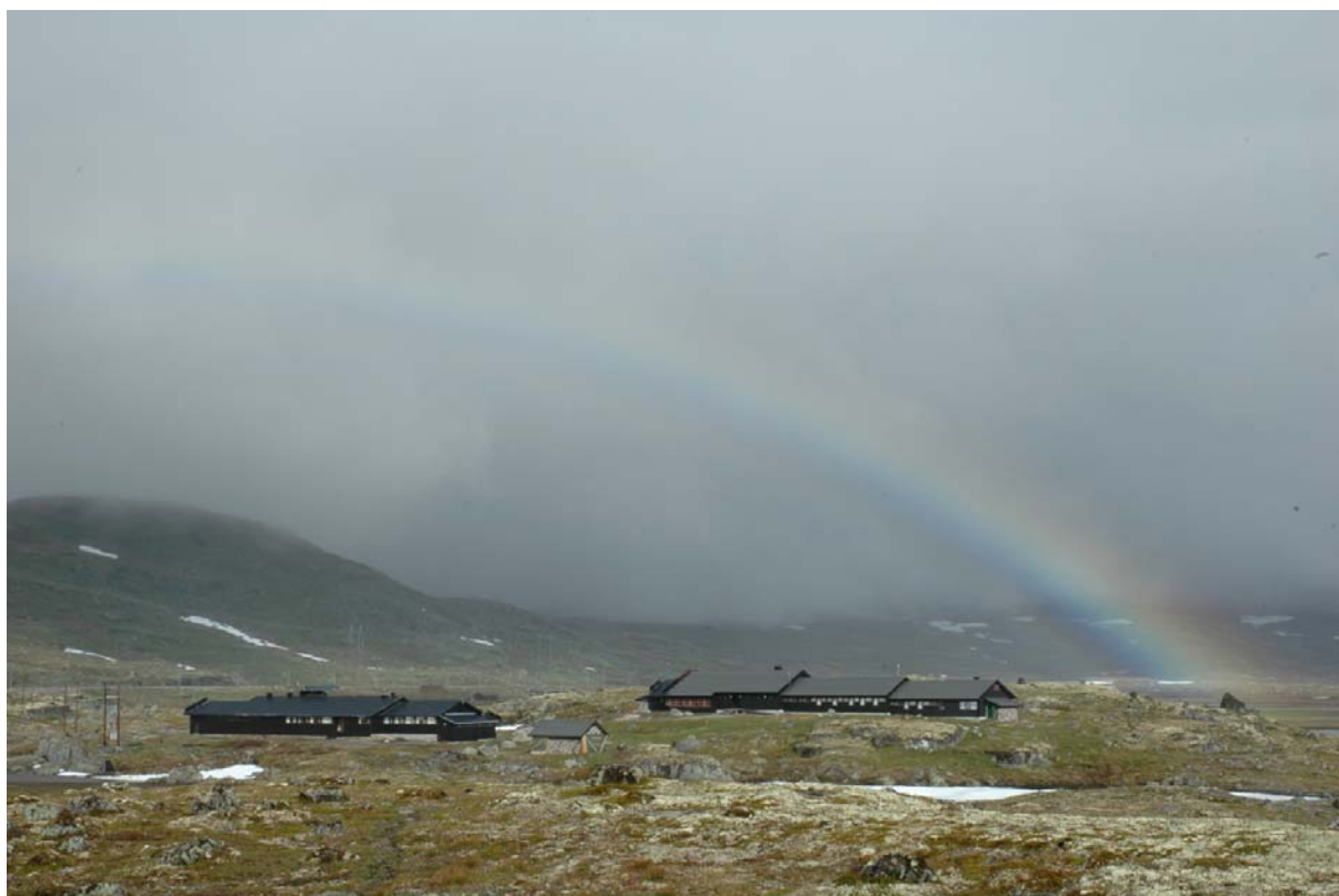
Forskningsstasjonen på Finse.

Forvaltninga skal ha ein oversikt over kva for forskningsprosjekt som går føre seg i verneområda.