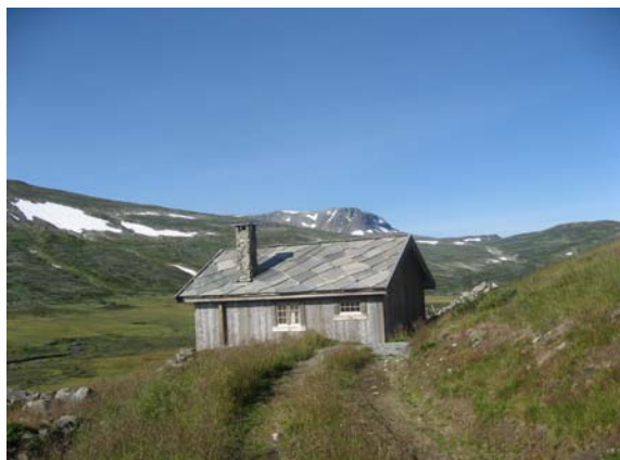
Ei restaurert bu i Raggsteindalen.

I nasjonalparken kan forvaltninga gje løyve til uttak av torv og/eller stein til vedlikehaldsarbeid på bygningar, (jf. HNP §3 pkt. 1.3 g). Staden kor uttaket skal skje skal godkjennast av forvaltningsstyresmakta.