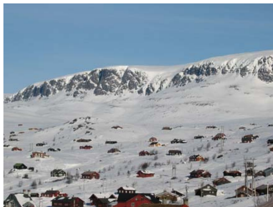
Hytter opp mot Skarvet ved Ustaoset.

Vernet i nasjonalparken og biotopvernområdet skal vere strengt. Føresegnene har derfor eit generelt forbod mot alle slags inngrep, jf. føresegnene § 3 pkt. 1.1. Oppføring av bygningar er som hovudregel ikkje tillate, men i heilt særskilde tilfelle kan forvaltninga vurdere løyve med heimel i naturmangfaldlova § 48. Det skal gjerast ei streng vurdering av søknader om byggjeløyve, med vekt på stadfesta behov og verknad på verneverdiane.