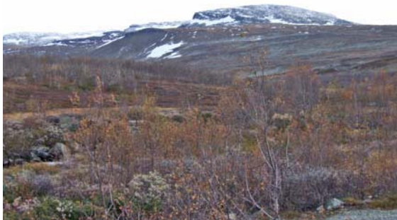
Innover Byrkjedalen med Storeskuta i bakgrunnen.

Verneområda ligg nære store reiselivsdestinasjonar og dette kan føre til ferdsle som er så omfattande og/eller konsentrert at omsynet til verneverdiane krev nærare regulering av ferdsla. Omsynet til villreinen er sentralt her.