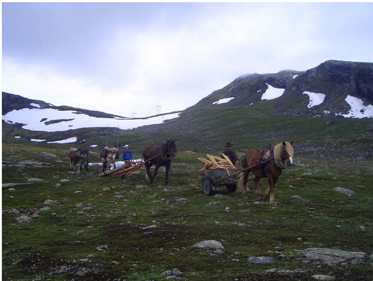
Til opninga av nasjonalparken vart alt utstyr frakta inn med hestar frå Geilo hestesenter.