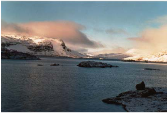
Vargebreområdet til venstre har ein markert avslutning mot Store Vargevatn.