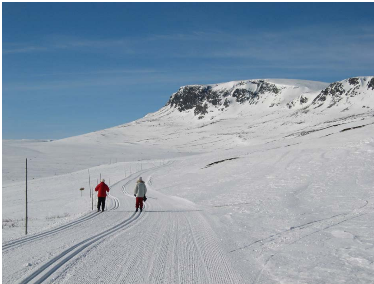
Skitur innover mot Prestholtseter frå Havsdalen.