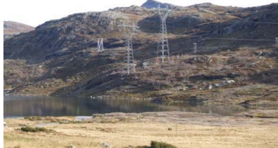
Kraftlina som følgjer riksveg 50 går rett på utsida av nasjonalparken. Her ved Vierbotnvatni.

Forvaltninga kan gje løyve til å setje opp nye snøskjermar i området ved Finse.