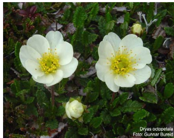
Reinrose. Frå plantefotoarkivet til Norsk Botanisk Foreining.

Førebels er det ikkje eit problem med atgroing av gammal kulturmark, men dette kan bli ei utfordring i framtida. Det er ei utfordring å hindre spreing av frammande artar.