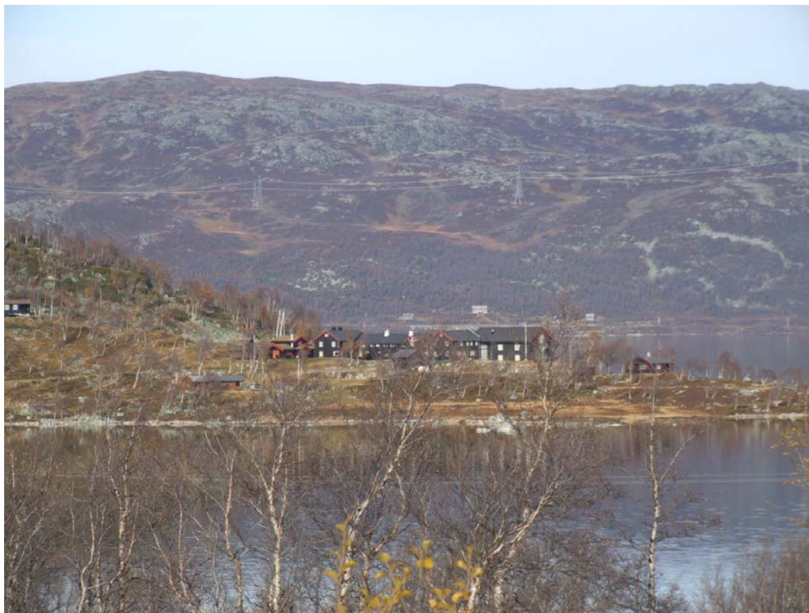
Raggsteindalen høvfjellstue ligg på DNT sitt løypenett med samband vestover til Geiteryggen, nordover til lungsdalen og sørover til Haugastøl. Høvfjellstua ligg utanfor vernegrensa, men gjestane nyttar verneområda både vinter og sommar.

Forvaltninga skal jobbe for å få til eit godt samarbeid med reiselivsnæringa i områda rundt Hallingskarvet. Det vil vere viktig for forvaltninga å halde oversikt over kva for aktivitetar som går føre seg i verneområda.