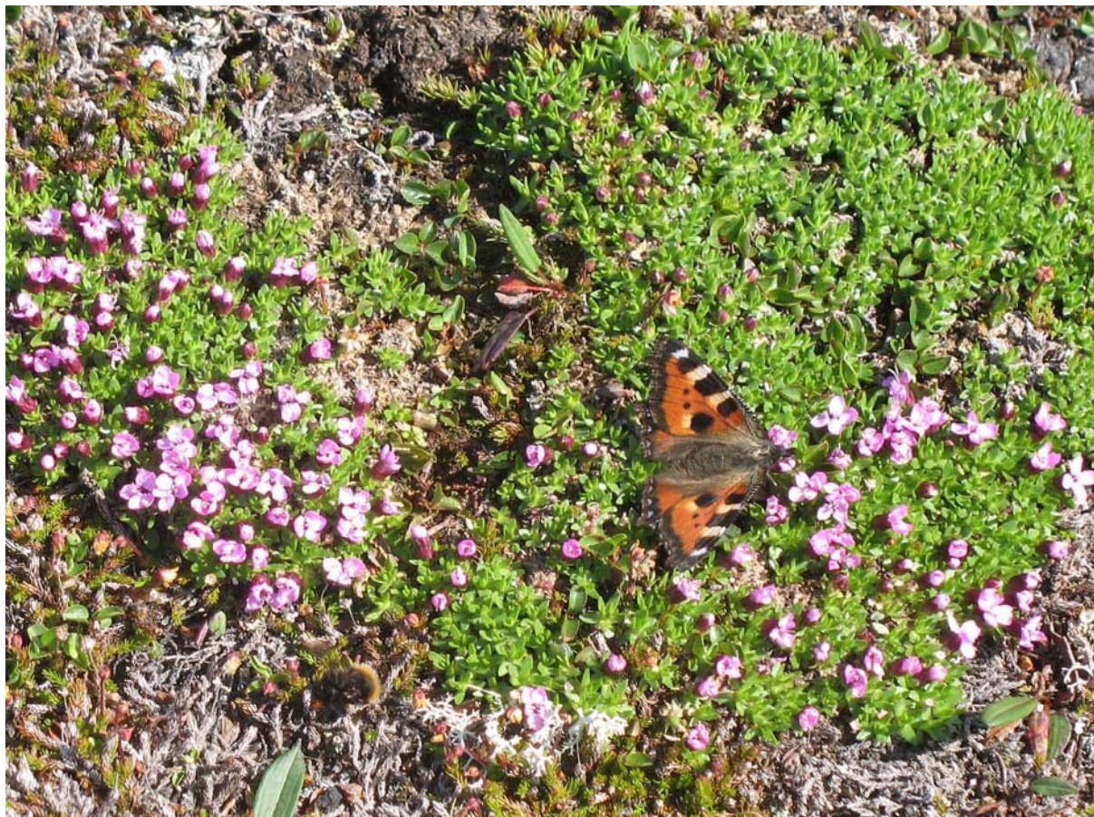
Neslesommerfugl på fjellsmelle.

Forvaltninga fører oversyn over transportomfanget og utviklinga i motorferdsle. Forvaltninga og SNO skal ha ein god dialog med dei som driv motorferdsle.