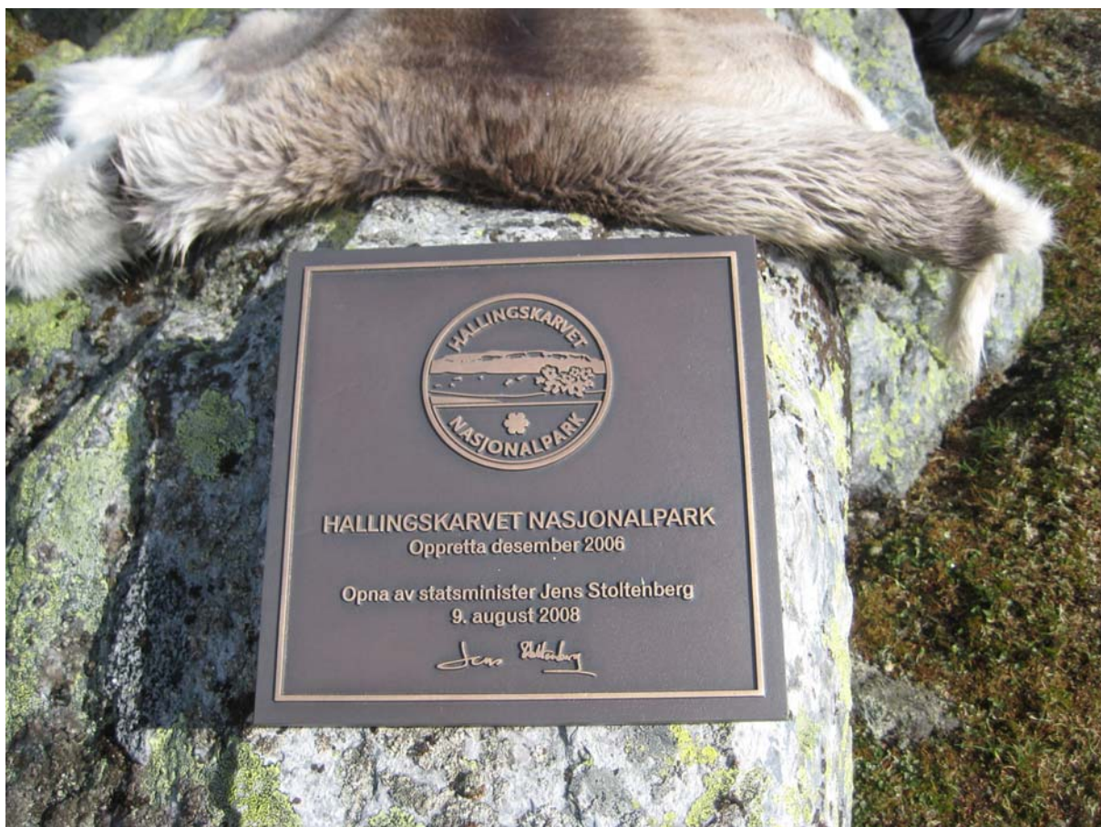
Nasjonalparken vart opna av statsministeren 9. august 2008. Opningsseremonien gjekk føre seg ved Sandalsnuten og mange folk hadde funne vegen dit i vekslande ver.