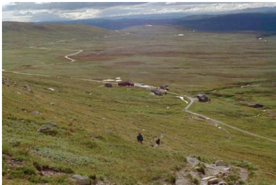
Prestholtseter ligg flott til ved dei flate myrdraga under Prestholtskarvet. Her er det kafé og stølsdrift.

nærleik til fjellet og fleire verneområde, mellom anna Hardangervidda nasjonalpark, Hardangerjøkulen/Skaupsjøen landskapsvernområde og Hallingskarvet nasjonalpark. Regionen har eit godt tilbod av hotell, restaurantar, fjellstuger/pensjonat, campingmoglegheiter og utleigehytter. Regionen har og eit stort tal fritidshytter.