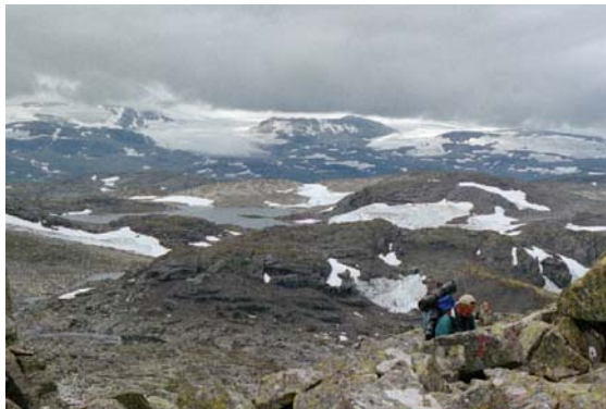
Utsyn frå høgdene langs DNT stigen sør for Kyrkjedøri, retning Finse.

Verneområda er ein viktig vinterbiotop for villrein. Areala under Skarvet er vinterbeiteområde, medan dei øvste botnene har gode sommarbeiter. Det er eit mål å sikre store urørde leveområde for reinen, kom-