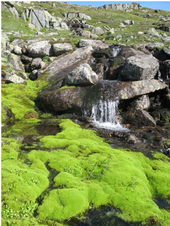
Sildrebekk under Finsenut.

Klemsbu blir drive som serveringsstad i helgene frå januar og ut mai. Det blir transportert opp varer til Klemsbu med snøskuter. Denne transporten må ansvarleg aktør (Finse 1222) halde på eit så lågt nivå som mogleg. Persontransport er ikkje tillate.