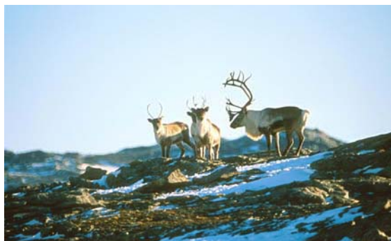
Villrein i brunst.

Det skal takast særleg omsyn til villrein, ved ei streng handheving av verneforskrifta og ved å sette naudsynte vilkår for løyva som gjes. Dei som har mykje transportoppdrag i verneområda bør ha jamnleg kontakt med oppsynet for å halde seg orientert om villreinen i området. Villreinemnda skal uttale seg før det vert fatta vedtak i saker som kan påverke villreinen.