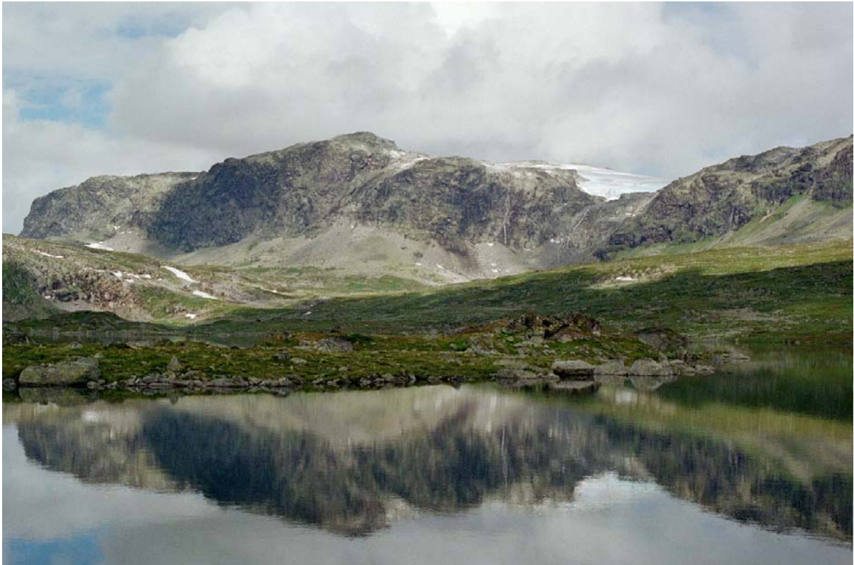
Naturen er mektig i Hallingskarvet. Øvre Hellevatnet med utsyn mot Hellevassfonne og stupa vest for Folarskardet.