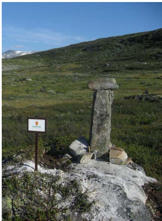
Grensebolt og nasjonalparkskilt ved Haugastøl. Rundt grensebolten er det bygd ein varde for å markere grensa betre og for å skjule bolten av aluminium.