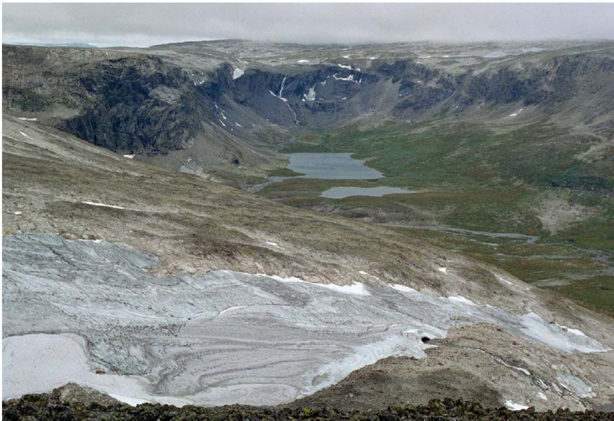
Utsyn over det mektige landskapet i Storekvelve.

Hallingskarvet er vasskiljet mellom Aust- og Vestlandet. Her er ofte raske vêrendringar. Tåka legg seg fort på dei høgaste toppane, og vinden skifter stadig i styrke og retning. Fleire stader i nordvende område ligg det snø heile året. Store delar av området har polarklima (dvs medeltemperatur for varmaste månad er lågare enn +10°C). Temperaturen i lufta kan variere frå -35°C om vinteren til 30°C om sommaren.