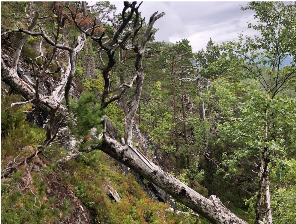
Figur 1 Kudalen ligg i ei sør-sørvestvendt li frå fjord til fjell i midtre Nordfjord og vil bidra til å delvis oppfylle manglane i skogvernet i Vestland.

Statsforvaltaren i Vestland tilrår frivillig skogvern av Kudalen i Stad kommune. Arealet dekkjer heile gradienten frå fjord til fjell i midtre Nordfjord og ligg i ei varm li vendt mot sør- sørvest. Kudalen består av gammal furuskog med bjørk og osp. Mykje lungenever og hengelav er jamt fordelt i området som vart kartlagt. At området ligg i boreonemoral sone, delvis lokalisert i lågareliggjande område og har ein del areal på høgare bonitetar gjer i tillegg området relevant i vernesamanheng. Kudalen har regionale til nasjonale verneverdiar (**/***) stjerner).