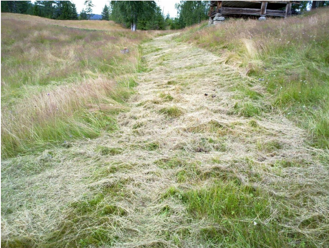
Foto 17 Kantone 11 , Aspeseter i Lurdalen i Øvre Eiker kommune kl. 13.53 den 20. juli 2020.