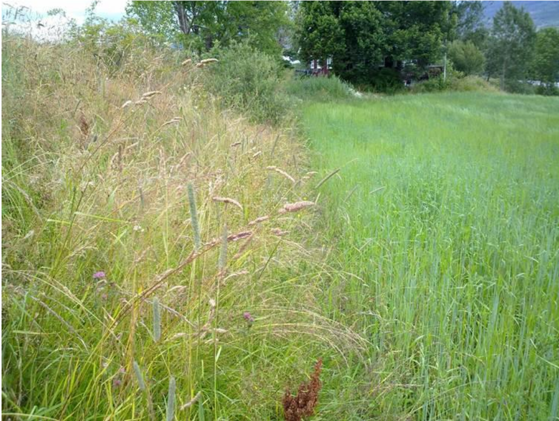
Foto 5 Kantzone 19A , Øvre Li på Efteløt i Kongsberg kommune kl. 14.43 den 17. juli 2020. Motsatt vei i forhold til forrige bilde.