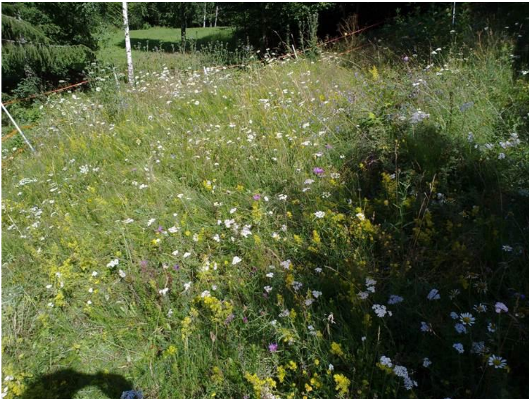
Foto 26 Kantone 4 , Enebærhaugen, Åker i Hokksund i Øvre Eiker kommune kl. 11.35 den 22. juli 2020. Innhegning for å beskytte noen planter mot beiting.