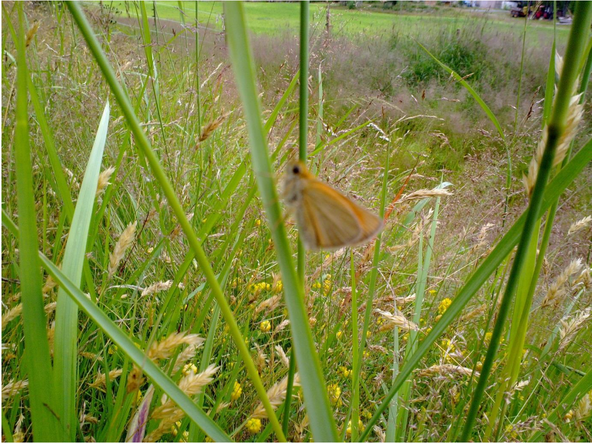
Foto 23 Kantsonen 14 , Øvre Hovenga på Bingen i Modum kommune kl. 17.10 den 20. juli 2020. Skogkanten. Den lille dagsommerfuglen timoteismyger.