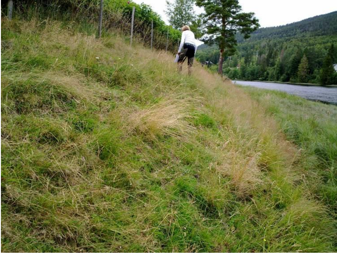
Foto 9 Kantsone 20 , Vetterstad på Passebekk i Kongsberg kommune kl. 15.51 den 17. juli 2020. Ann Norderhaug er med på bildet.