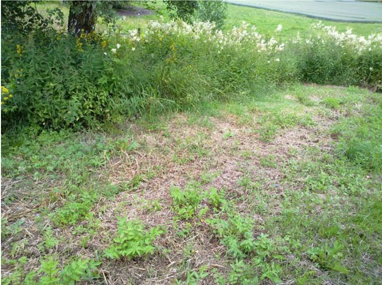
Foto 10 Kantsone 20A , Vetterstad, Passebekk i Kongsberg kommune kl. 16.07 den 17. juli 2020. Fra veien.