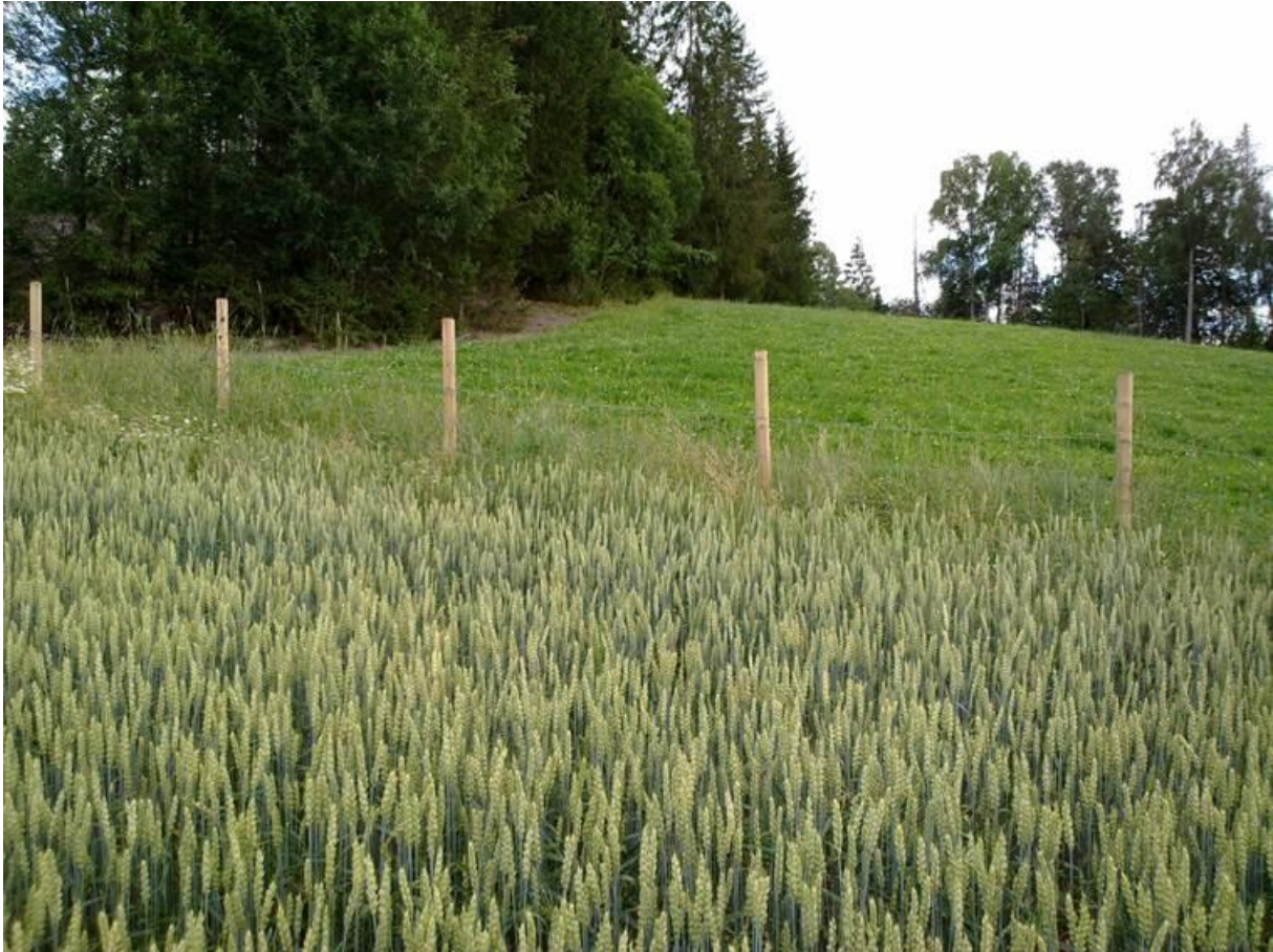
Foto 30 Kantsone 13 , Åker i Hokksund i Øvre Eiker kommune kl. 15.45 den 22. juli 2020. Fortsatt nedtråkket av sau og lite blomster, og ingen insekter sett.