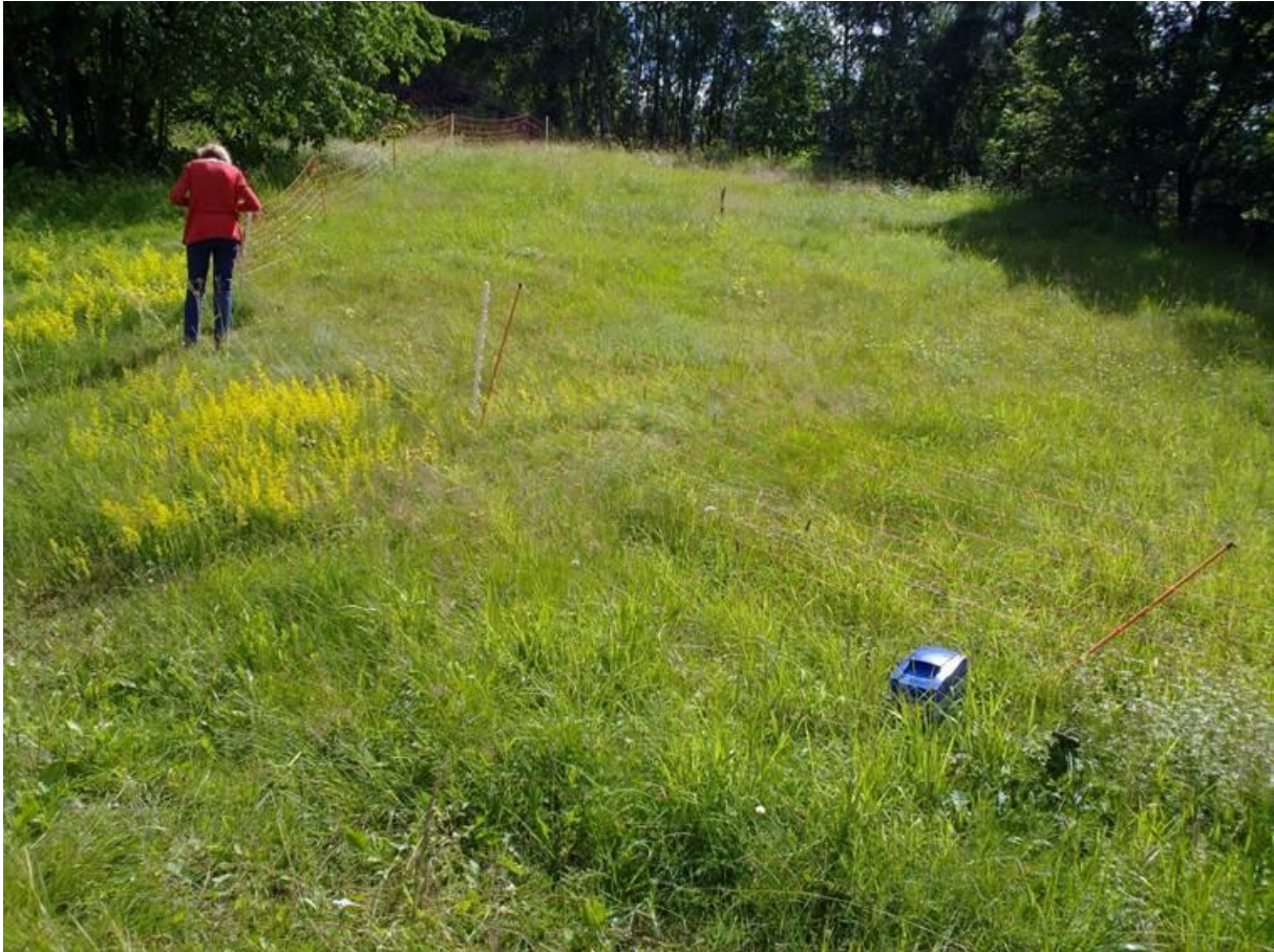
Foto 29 Kantsone 12 , Åker i Hokksund i Øvre Eiker kommune kl. 15.07 den 22. juli 2020. Bildet er tatt oppover skråningen.