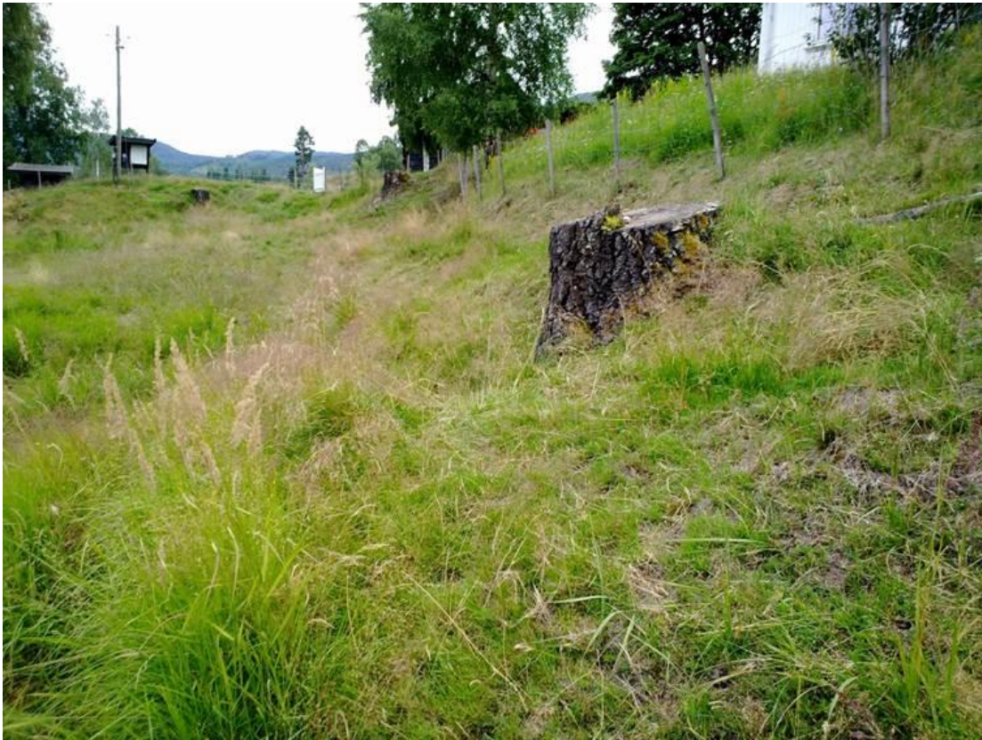
Foto 8 Kantzone 20 , Vetterstad på Passebekk i Kongsberg kommune kl. 15.51 den 17. juli 2020.

Enghumle Bombus sylvarum mørk arbeider på hvitkløver