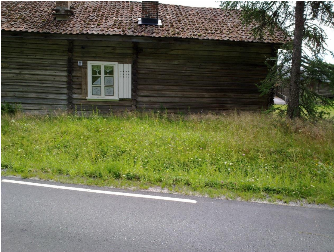
Foto 1 Kantson 23 , Gåseberg, Flesberg i Flesberg kommune kl. 11.47 den 17. juli 2020. Fra hovedveien og mot bygningen.