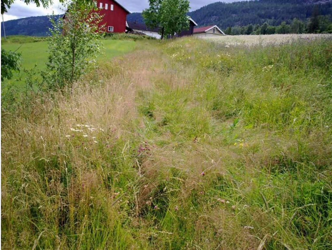
Foto 4 Kantsone 19A, Øvre Li på Efteløt i Kongsberg kommune kl. 14.37 den 17. juli 2020. Mot rød låve.

Areal 1,0 dekar, feltsjikt dominert av gress og urter, slås. Åker/eng ovenfor og nedenfor. Ca. kl. 14.35–14.55