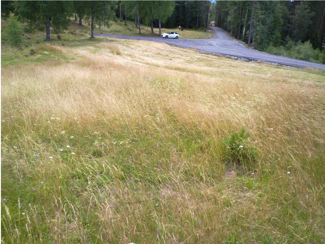
Foto 16 Kantone 11 , Aspeseter i Lurdalen i Øvre Eiker kommune kl. 13.22 den 20. juli 2020.