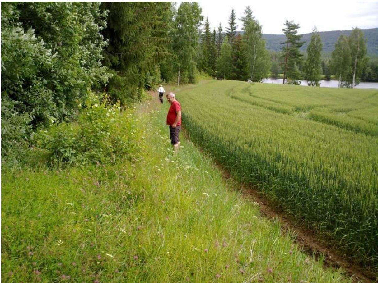
Foto 3 Kantsone 24, Gåseberg, Flesberg i Flesberg kommune kl. 12.27 den 17. juli 2020. Fra bjørk og nedover mot furu og Lågen. Svenn Anstensrud og Ann Norderhaug er med på bildet.