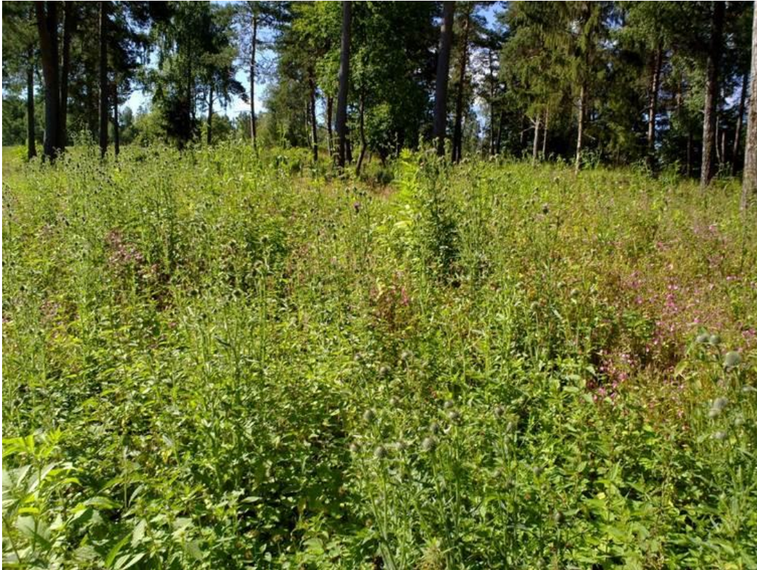
Foto 25 Kantone 4 , Enebærhaugen, Åker i Hokksund i Øvre Eiker kommune kl. 10.23 den 22. juli 2020.