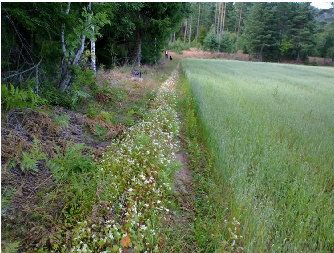
Foto 33 Kantsone 22, Søndre Moen i Hvittingfoss i Kongsberg kommune kl. 18.32 den 22. juli 2020.