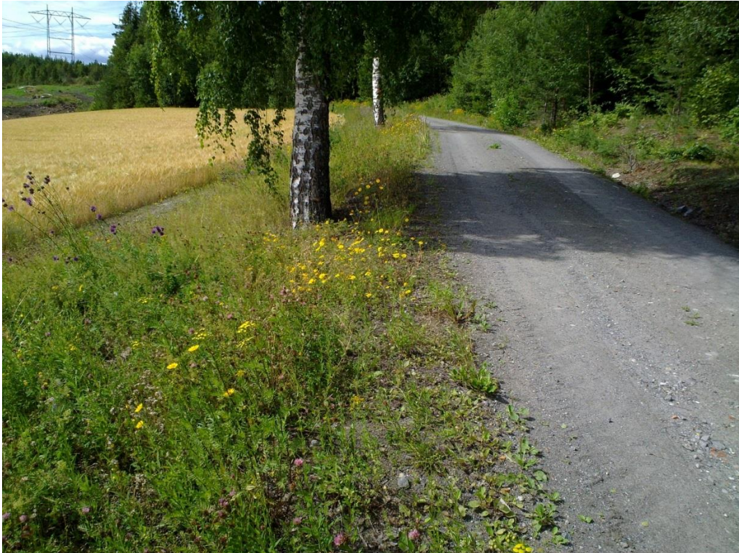
Foto 14 Kantsone 3A, Skarraenga i Vestfossen i Øvre Eiker kommune kl. 11.38 den 20. juli 2020. Mellom kornåker og vei.