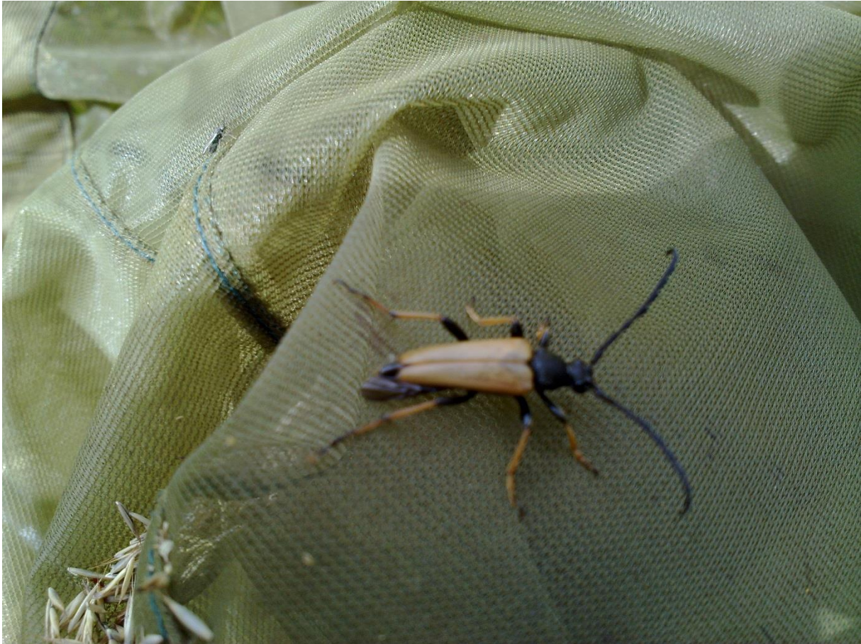
Foto 18 Kantsone 11, Aspeseter i Lurdalen i Øvre Eiker kommune kl. 13.42 den 20. juli 2020. Blomsterbukken Stictoleptura rubra hann. Uten norsk navn.