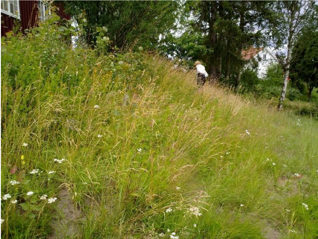
Foto 6 Kantsone 19 , Øvre Li på Efteløt i Kongsberg kommune kl. 14.58 den 17. juli 2020. Kårboligen oppe til venstre i bildet.