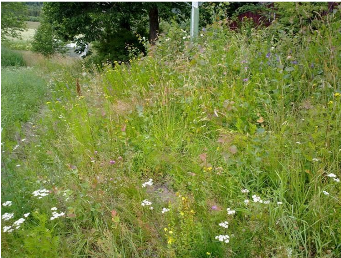
Foto 7 Kantsone 19 , Øvre Li på Efteløt i Kongsberg kommune kl. 15.13 den 17. juli 2020. Kårboligen oppe til høyre i bildet.