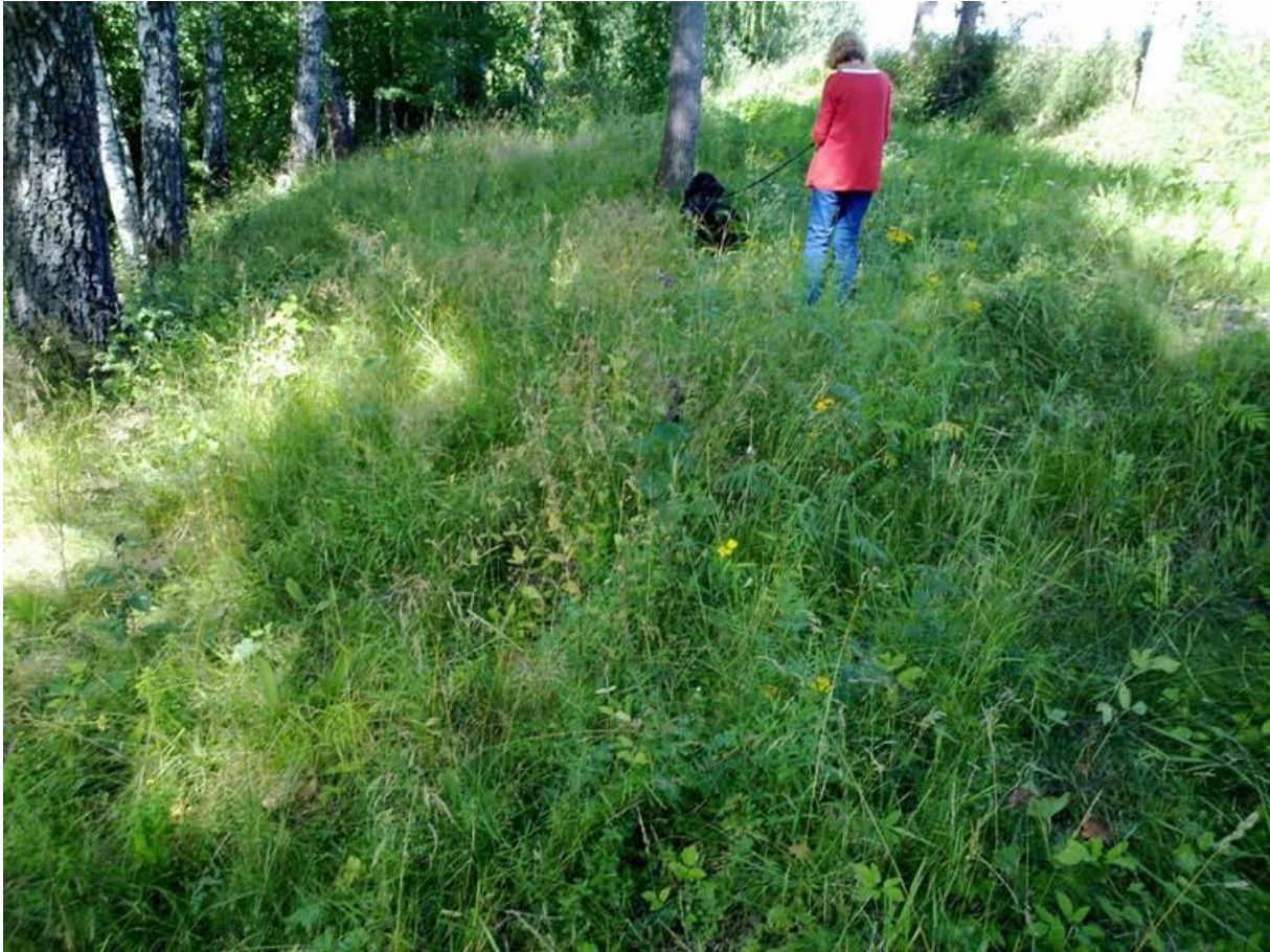
Foto 28 Kantsone 6 , ved Vestfosselva, Vølstad (Voldstad) i Hokksund i Øvre Eiker kommune kl. 13.51 den 22. juli 2020. Ann Norderhaug og hunden hennes, Kajsa.