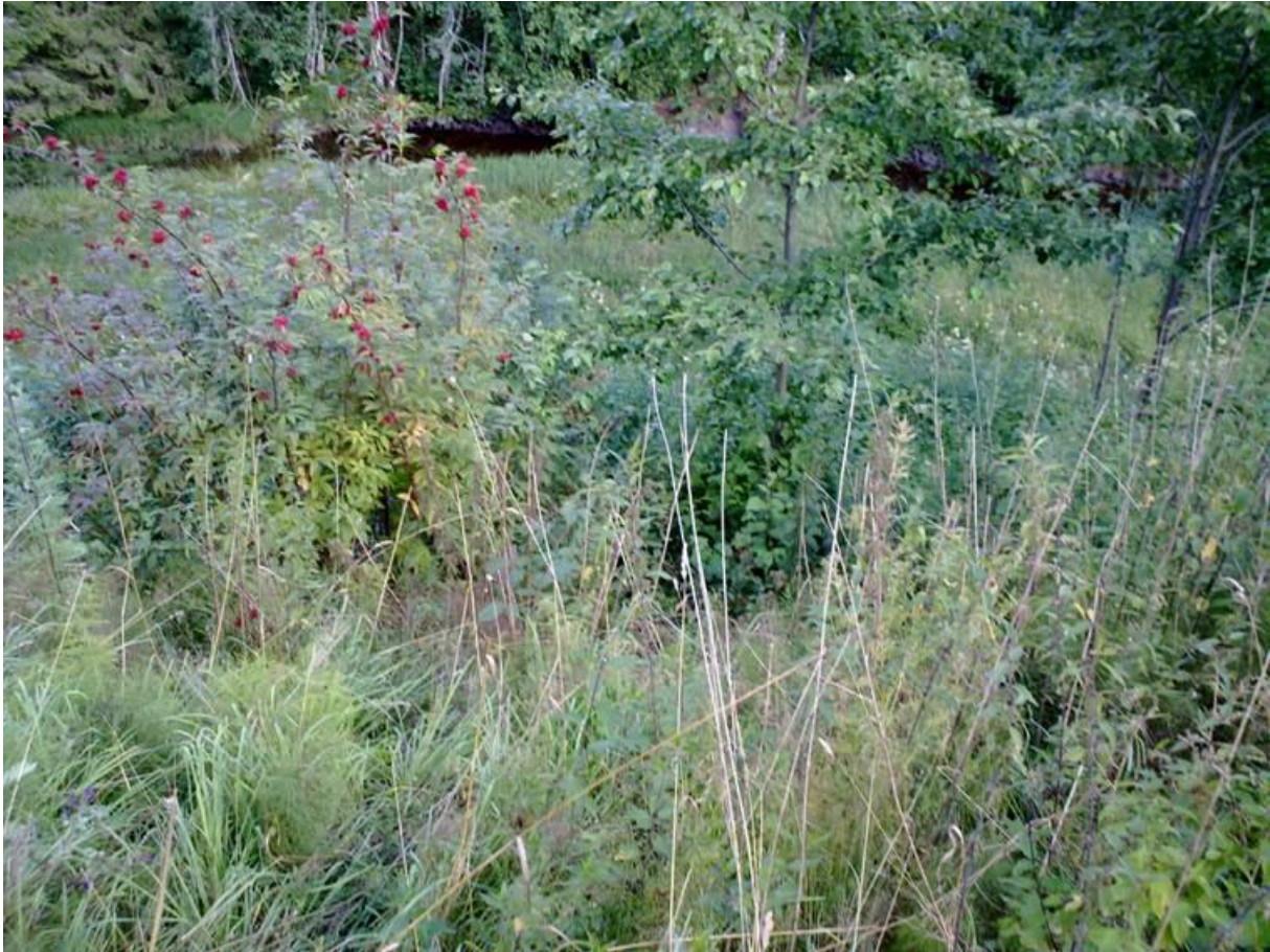
Foto 31 Kantsone 21 , Grønnvoll i Hvittingfoss i Kongsberg kommune kl. 17.56 den 22. juli 2020. Ned mot bekken som renner ut i Numedalslågen like ved. Lite er gjort, og dermed fortsatt veldig gjengrodd der.