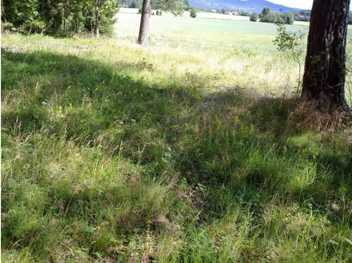
Foto 27 Kantzone 8 , ved Dramsrud i Hokksund i Øvre Eiker kommune kl. 12.48 den 22. juli 2020.

Timoteismyger Thymelicus lineola Liten kålsommerfugl Pieris rapae hunn Keiserkåpe Argynnis paphia hunn Gullringvinge Aphantopus hyperantus