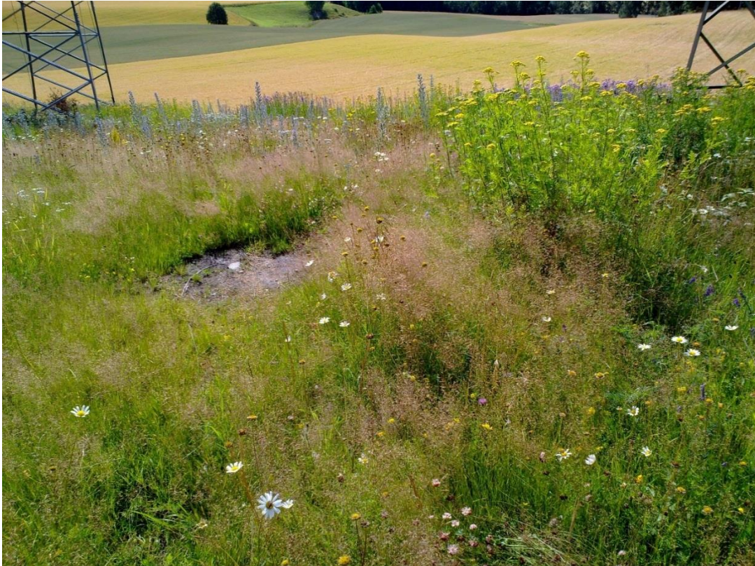
Fotos 13 Kantsone 3 , Skarraenga i Vestfossen i Øvre Eiker kommune kl. 10.54 den 20. juli 2020. Åkerholmen.