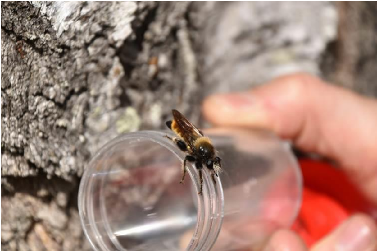
Foto 34 Kantsone 22, Søndre Moen i Hvittingfoss i Kongsberg kommune kl. 16.22 den 10. juni 2020. Gulhåret rovflue Laphria flava hann.

Gulhåret rovflue Laphria flava hann – Anne Bjørg Rian tok bilder (se ett av dem under)