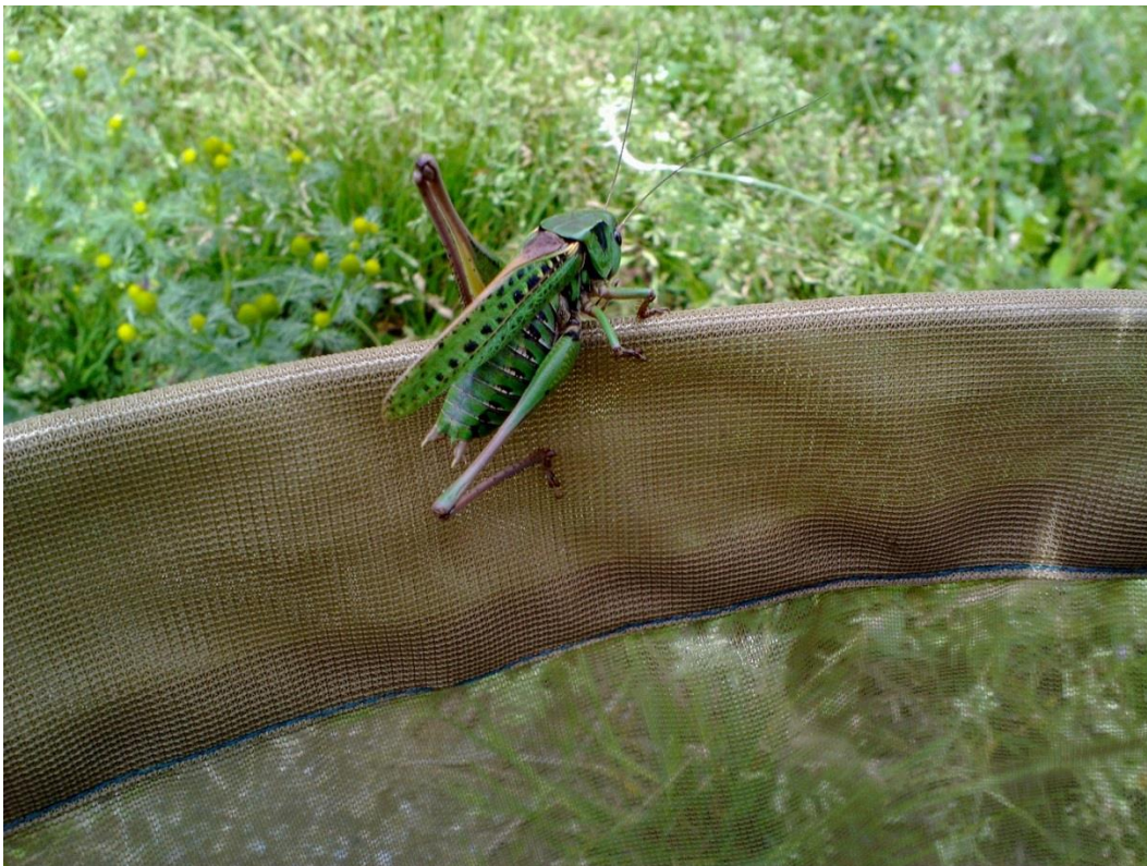
Foto 21 Vortebiter Decticus verrucivorus (rødlistet som nær truet) fotografert da vi var på vei fra åkerholmen (Kantsone 15) til skogkanten (Kantsone 14) kl. 16.47 den 20. juli 2020.