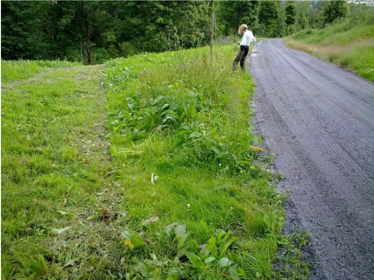
Foto 19 Kantsone 10, Darbu i Fiskum i Øvre Eiker kommune kl. 12.45 den 20. juli 2020. Ann Norderhaug er med på bildet.