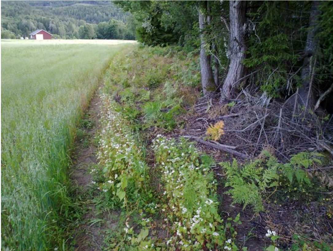
Foto 32 Kantsone 22, Søndre Moen i Hvittingfoss i Kongsberg kommune kl. 18.31 den 22. juli 2020.