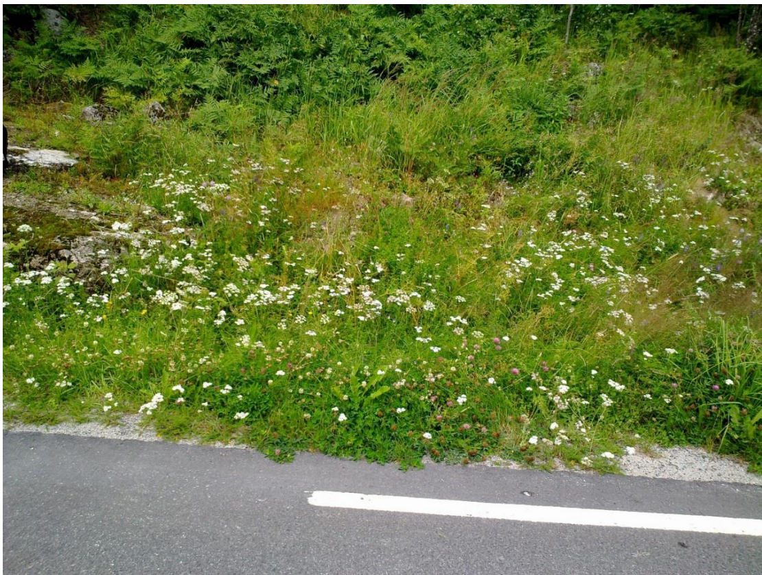
Foto 2 Kantson 23 , Gåseberg, Flesberg i Flesberg kommune kl 12.14 den 17. juli 2020. Fra bygningen og Kantson 23 mot veikanten på den andre siden.