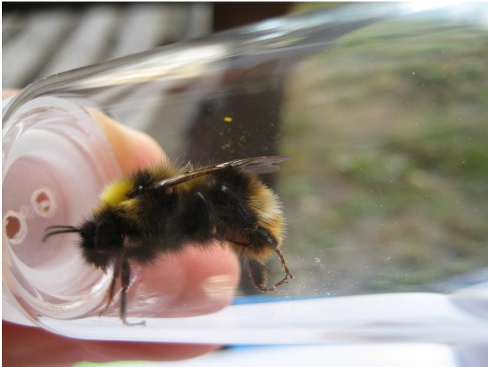
Foto 24 Lundgjøkhumle Bombus quadricolor hann funnet på blåknapp av Anna Arneberg i hennes kantsone ( Kantsone 14 ) rundt kl 15.00 den 2. september 2020. Dette er første og hittil eneste funn av arten i Modum kommune, og for øvrig er den i tidligere Buskerud fylke kun kjent fra én annen lokalitet (i Flå kommune). Rødlistet som sårbar .