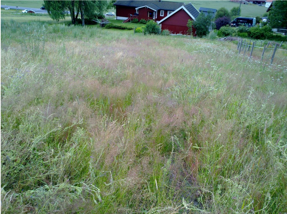
Foto 12 Kantsone 16, Sandbakken, Lia på Efteløt i Kongsberg kommune kl. 16.59 den 17. juli 2020 (foto nedover). Lite oksetunge i blomst der da.

32V5474256599795 (50 m radius) – Kantsone 16, Sandbakken, Lia, Efteløt Areal 7 dekar fordelt på dyrket mark og beite.