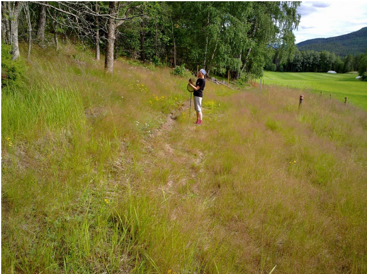
Foto 22 Kantsone 14, Øvre Hovenga på Bingen i Modum kommune kl. 16.53 den 20. juli 2020. Skogkanten. Anna Arneberg er med på bildet av kantsonen sin.