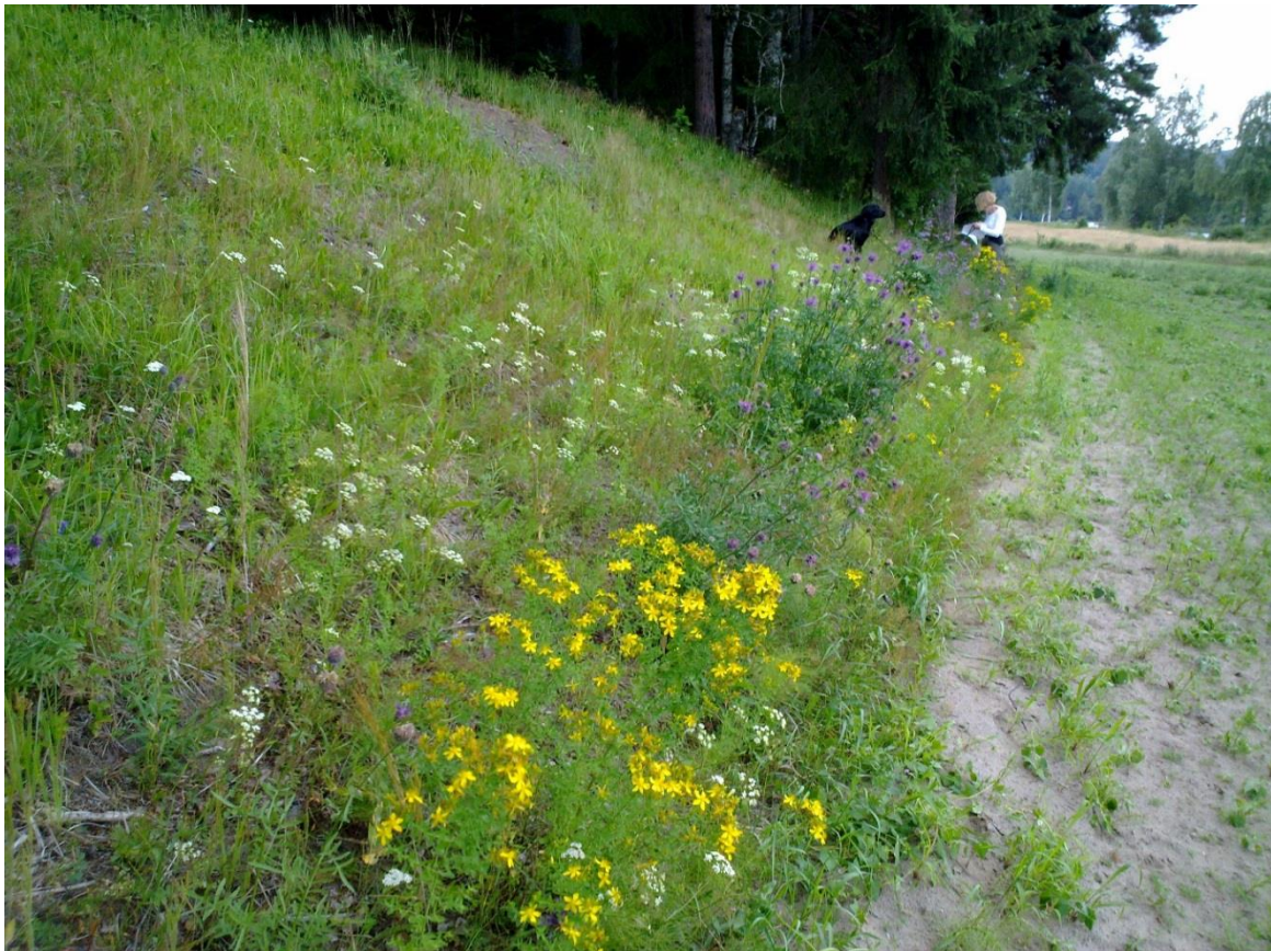
Foto 11 Kantsone 17, Sommerstadneset på Efteløt i Kongsberg kommune kl. 16.32 den 17. juli 2020. Fotografert fra kornåker og mot skogen. Ann Norderhaug og hundes hennes Kajsa er med på bildet.

Nesten kun blomster nederst i kantsonen Perikum, fagerknoppurt, gjeldkarve og stemorsblomst