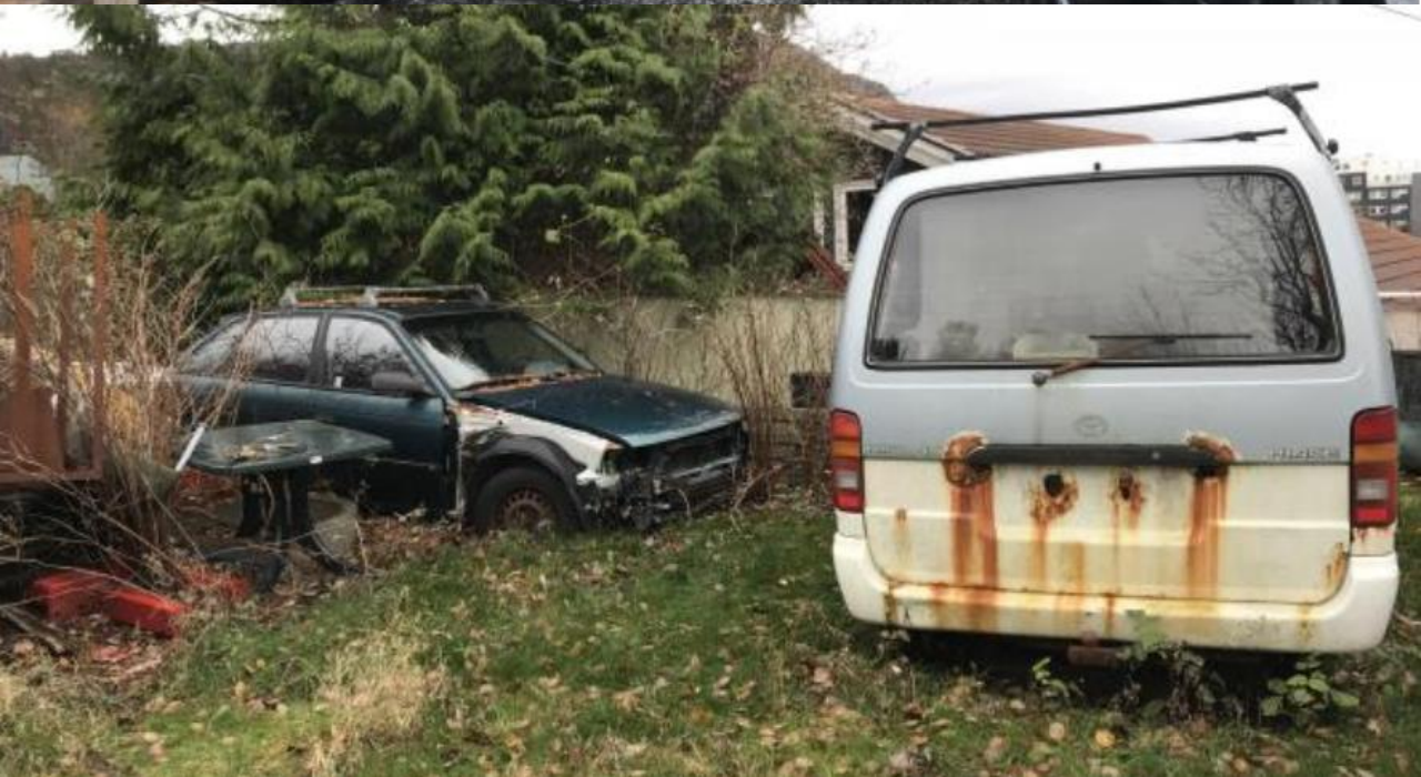
Foto: Dette er d me p  fors ppling. Her har privatpersonar i eit byggefelt lagra avfall som er skjemmande, fors plande og som kan f re til forureining p  eigedommen sin.