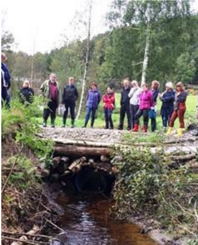
Foto: Kulturlandskapsdagen på Holt i 2017.

Hydrotekniske tiltak i SMIL-ordningen – og drenering/grøfting – hva er forskjellen?