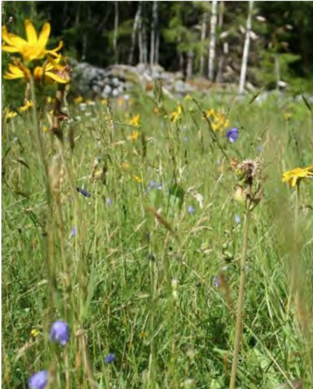
Foto: Flateland i Valle.

SMIL-tilskudd til å åpne gjengrodd areal («gammel kulturmark») – er det krav om spesielle natur- og kulturminneverdier?