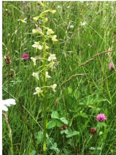
Blomstereng med nattfoll, Valle ved Mandal, Lindesnes kommune, 2020

Hjelpedokument lokale retningslinjer/tiltaksstrategi