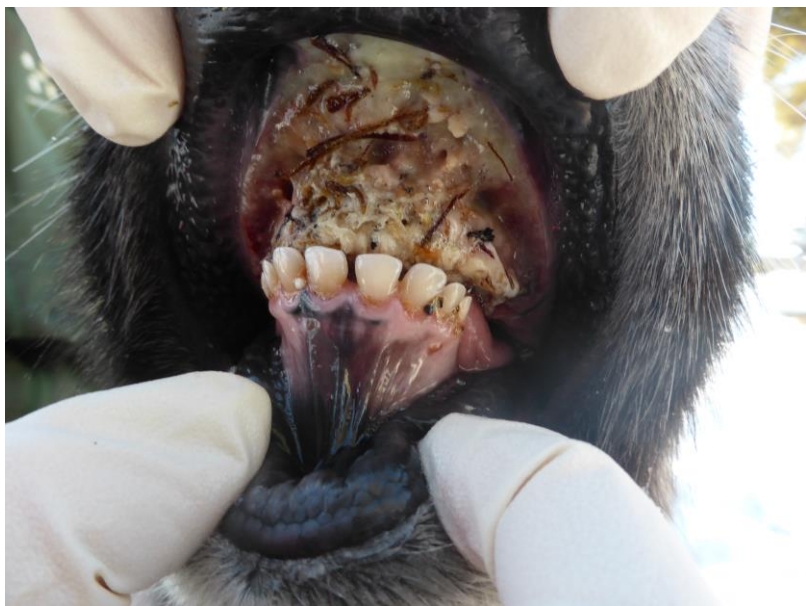
Undersøkelse av levende rein med betennelse i munnhule.