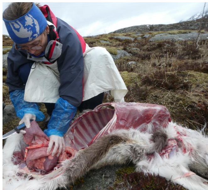
Obduksjon i felt.