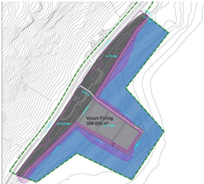
Figur 1 Rosa skravur viser planlagt fyllingsareal inkludert fyllingsfot. Grønn stipla linje er plangrensen.

Det er påvist forurensning i overflatesedimentene i mudrings- og utfyllingsområdet. I henhold til reguleringsplan skal forurensete masser tas på land og transporteres til godkjent deponi. Rene masser kan omdisponeres på anlegget dersom man finner egnet formål. Hovedandelen av mudringsmassene består av rene sedimenter.