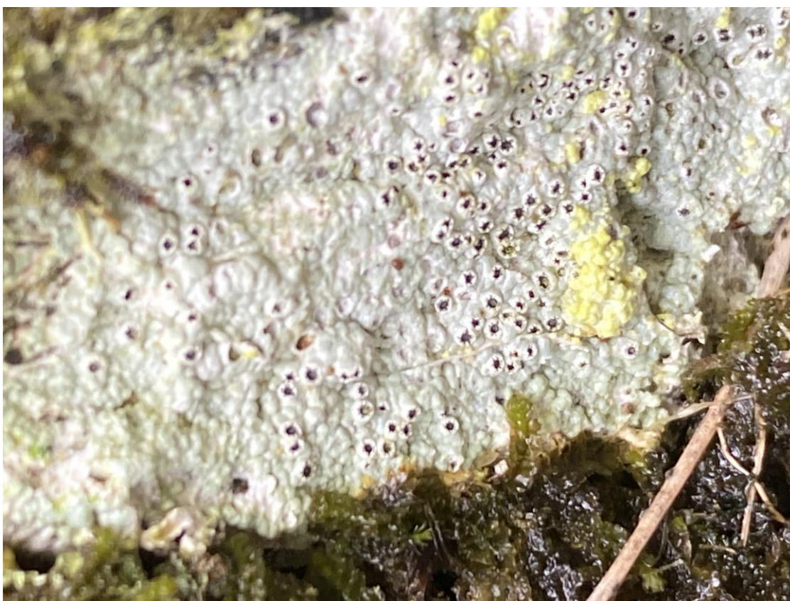
Figur 2. Bilde av en alminnelig rurlav ( Thelotrema sp.) sør for Norsk Stein.

ble gjort flere nye funn av arten under kartleggingen i 2022, de fleste av dem innenfor naturtypelokalitet Berakvam Ø (Figur 3). Av de registrerte lavene i området er de fleste knyttet til høy fuktighet, blant annet kystskoddelav (VU), skoddelav (NT) og kort trollskjegg (NT). Stjerneflekklav (VU) regnes som en regnskogsart med hovedutbredelse i de mest oseaniske områdene i Hordaland, og kan regnes som rimelig eksklusiv i Rogaland. Trelegglav (EN) og stuvlavene er knyttet til gamle og grove, gjerne styvede, trær. Det ble ikke gjort nye funn av rødlistede lav- eller mosearter i områdene sør og øst for Norsk Stein. Det ble ikke gjort noen nye funn av rødlistede lavarter i de områdene som ble undersøkt. Ikke alle områdene ble undersøkt, og kartlegger har begrenset erfaring med de vanskelige artene av skorpelav. Området sør og øst for Norsk Stein er imidlertid undersøkt av dyktige artskartleggere tidligere, og det forventes at de viktigste lokalitetene for lav i området allerede er kjent.