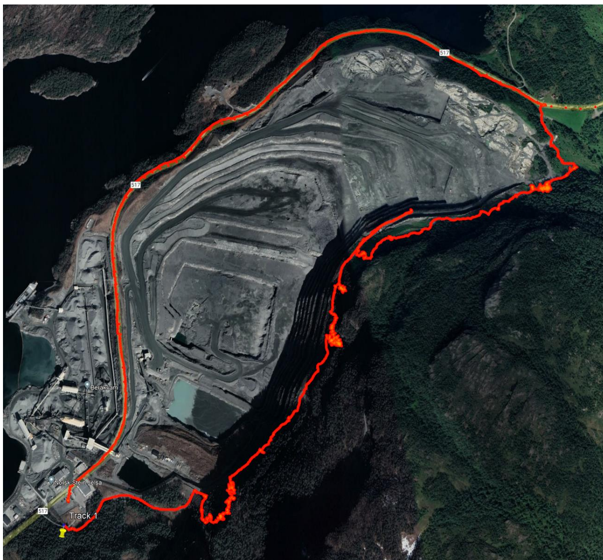
Figur 1. Sporlogg og oversikt over undersøkte områder ved Norsk Stein på Jelsa.

Videre er eksisterende kunnskap om naturmangfold i området hentet fra Naturbase og Artsdatabanken.