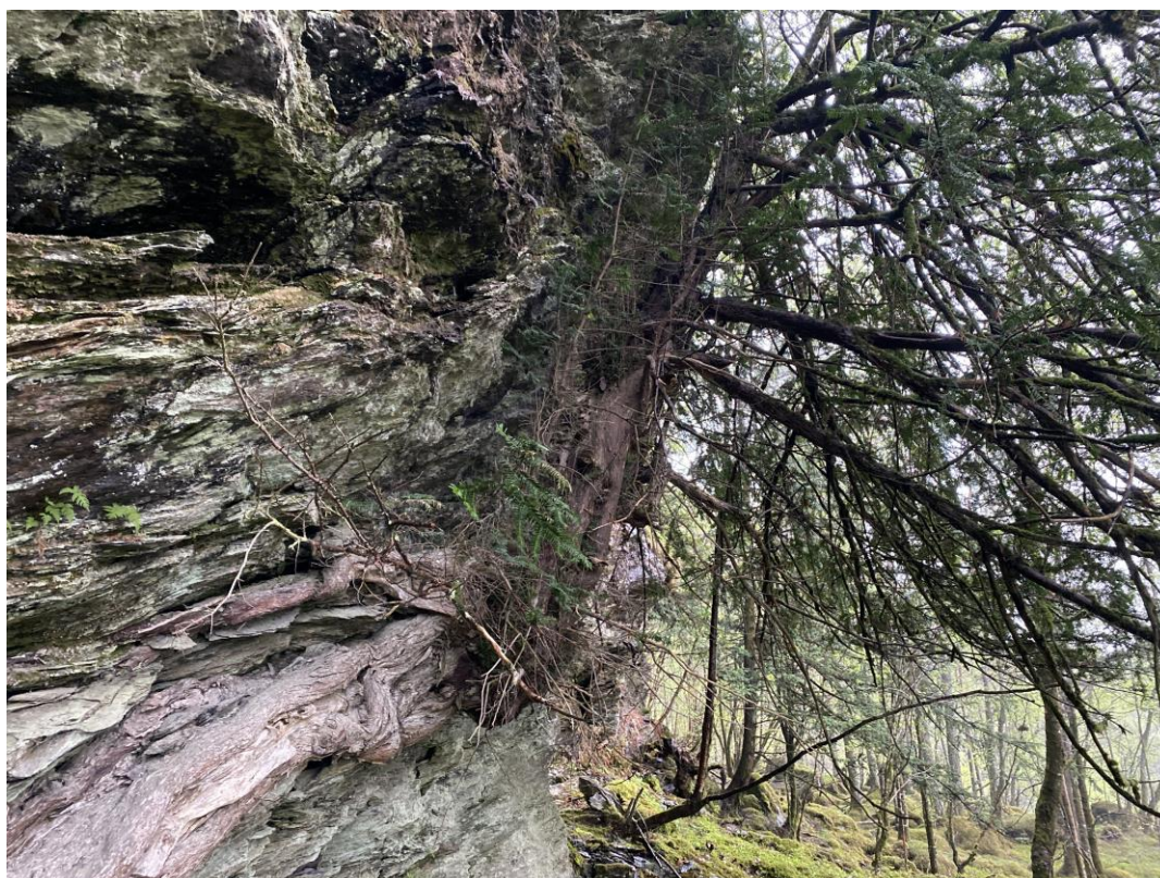
Figur 3. Bilde av en gammel og grov barlind (VU) innenfor naturtypelokalitet Berakvam Ø.