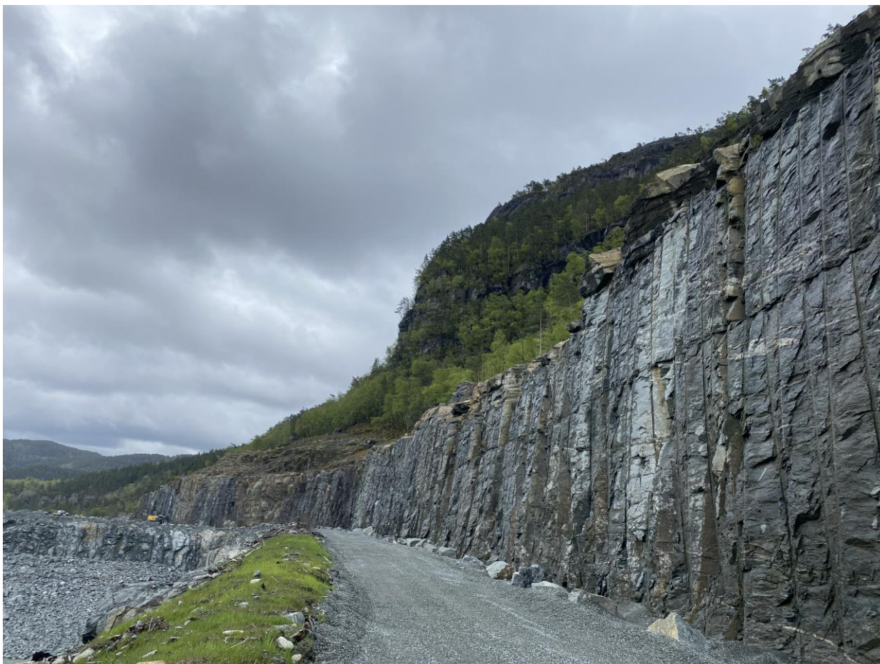
Figur 5. Bilde av steinbruddet på Norsk Stein opp mot naturtype Harastigfjellet N.