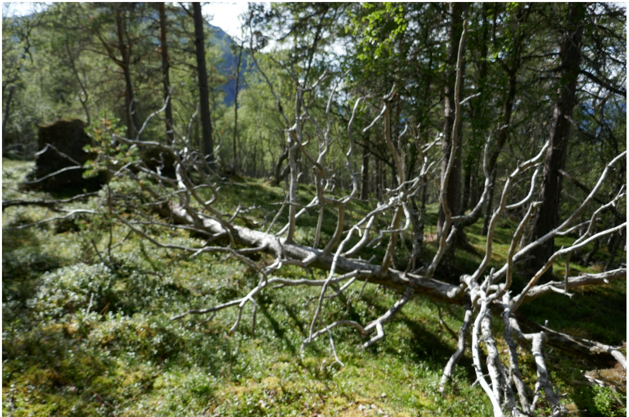
Figur 1 Kvitingsmorki naturreservat vart verna i 1999 og fyller 25 år i år. No set vi i gang arbeidet med å utvide naturreservatet. Eitt av kjenneteikna til Kvitingsmorki er store, gamle furutre.

Utvidingsområdet er ikkje kartlagt etter ny metodikk, men det tilgrensande området, Bermål, vart kartlagt av biologar i 2022. Det vart påpeikt i rapporten at arealet mellom Bermål og dagens naturreservat Kvitingsmorki også burde bli vurdert for vern for å sikre ei samanhengjande li langs Sognefjorden, noko vi med dette brevet har oppnådd etter god dialog med grunneigarane.