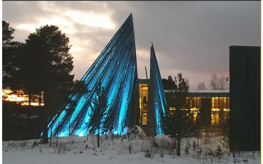
Avdelingstur til Karasjok

Lahkoe jávvlh jìh buerie orre jaepie! Vi vil ønske alle en riktig God jul og et Godt Nyttår!