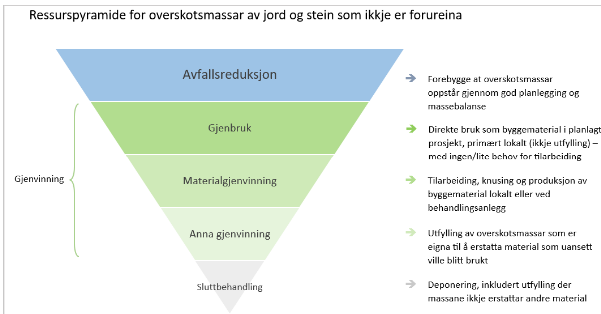
Figurtekst – Ressurspyramide for handtering av overskotsmasse av jord og stein som ikkje er forureina. Piler frå figuren viser til forklaring av dei ulike prioriteringane i pyramiden. Sjå innleiing for nærare beskriving. Figur: Statsforvaltaren i Vestland 2023.