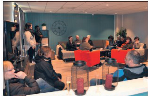
FINE LOKALER: Deler av stasjonsbygningen er nå leid ut til Flyktingtjenesten. Lokalene har blitt kjempefine.