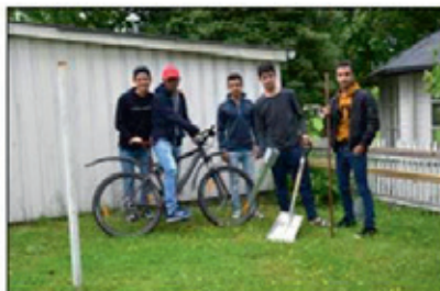
PRAKTISK ARBEID: Guttene på Fløya har sansen for litt praktisk arbeid. Her er de i gang med å bygge sitt eget sykkelkur.

- Jeg er veldig glad i barn, og kan gjerne tenke meg å passe noen. Jeg liker også å lage mat og å ser-