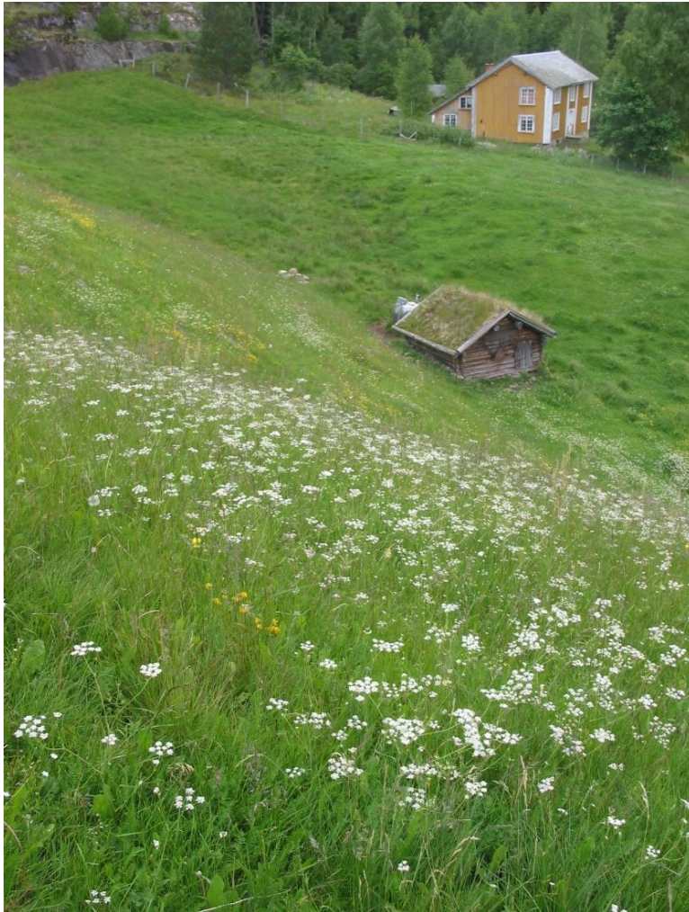
Blomstereng – slåttemark