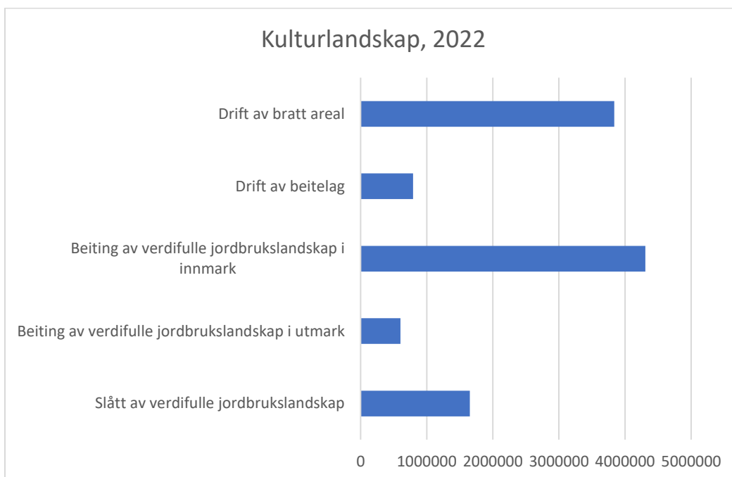
Figur 3 Fordeling av midler til de ulike tiltakene under miljøtema Kulturlandskap for søknadsomgangen 2022.

Figuren nedenfor viser fordeling av tiltakene i utbetalt tilskudd innen miljøtema Kulturlandskap. Det blir en betydelig omfordeling av midler fremover ved de endringene som er foreslått for kommende programperiode. Se mer om endringene i kapittel 6. Tiltaket beiting av verdifulle jordbrukslandskap i innmark er det enkelttiltaket som det er brukt mest av RMP-midlene til.