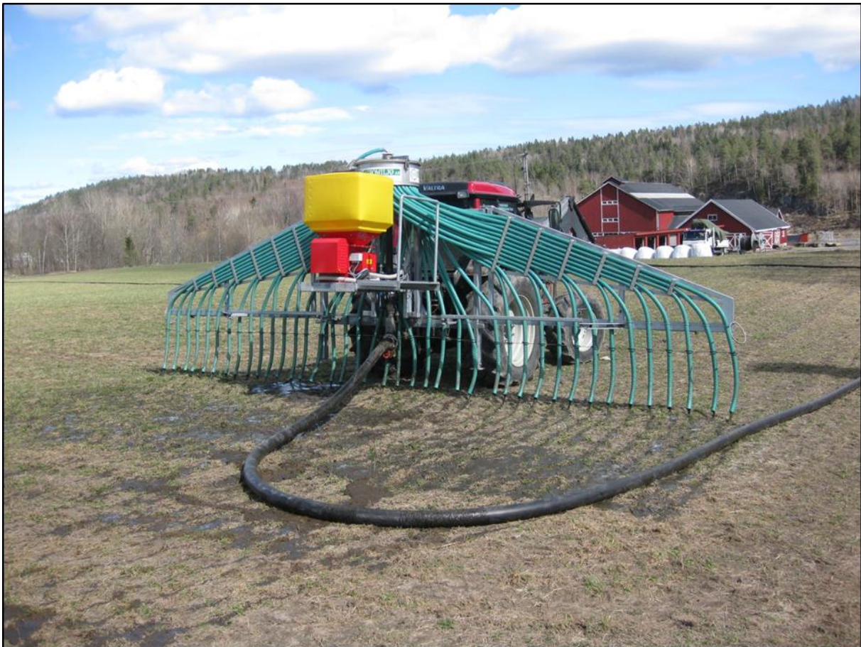
Slangespreder med tilførselsslange