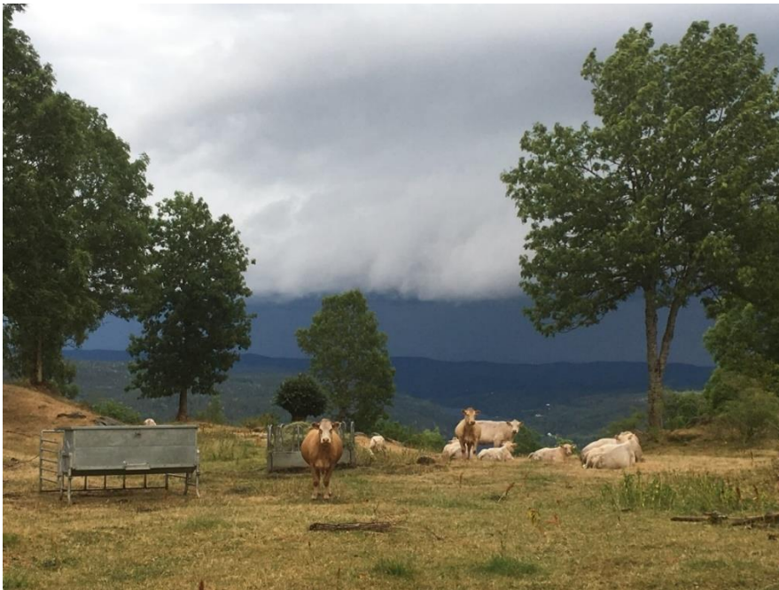
Melås i Gjerstad, foto: Knut Erik Ulltveit

Tilskudd til dette tiltaket skal videreføres i 2023 og deretter fases ut med en gradvis nedtrapping av satsene i løpet av resten av programperioden. Se nærmere omtale om hvorfor dette tiltaket utfases i kapittel 6.1.