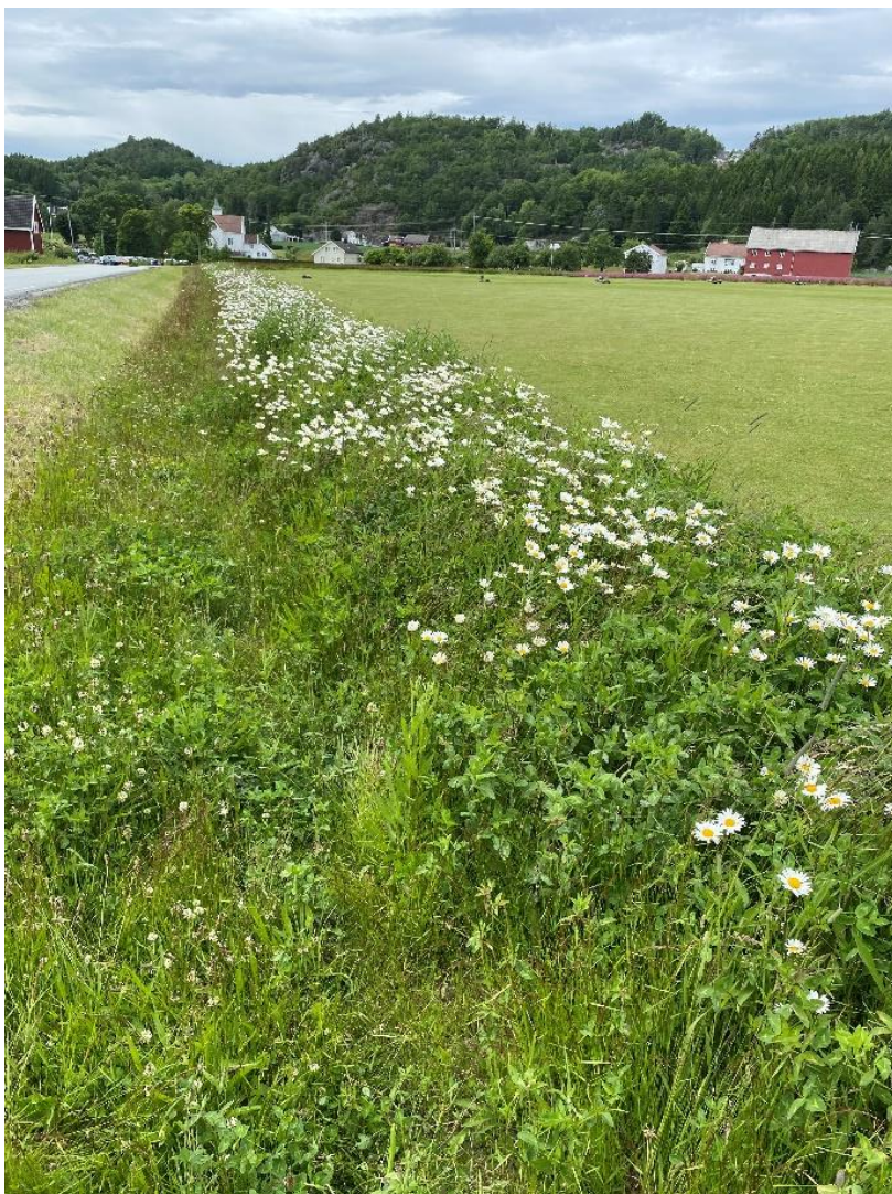
Pollinatorzone på Landvik i Grimstad