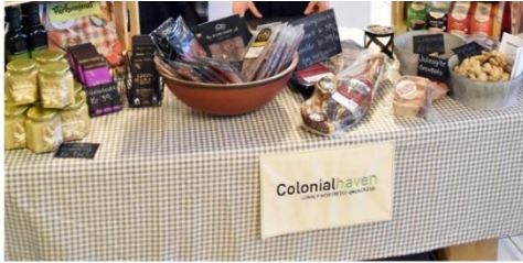
Gunn Søyseth fra Colonialheaven var på plass med lokal, kortreist og økologiske matvarer