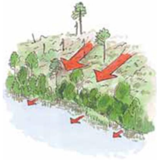
Figur 2. Kantvegetasjon hindrar avrenning, og tar opp næringsstoff frå nedbørfeltet. Illustrasjonar frå «Skogbruk vid vatten». Skogstyrelsens förlag 2000.

Røter av buskar og tre bind jorda saman og hindrar at jorda forsvinn ut i vassdraget ( figur 3 ). Eit breitt belte av kantvegetasjon kan redusere skader ved flaum, blant anna ved at mindre vatn når inn på dyrka mark eller inn til busetjing. I større elvar kan eit breitt belte med vegetasjon kanalisere isgangen og hindre skadar på landbruksjord, hus, veg og jernbane.