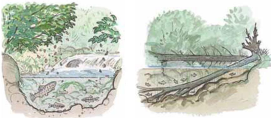
Figur 1. Kantvegetasjon gjev skjul, skugge og næring. Illustrasjon frå «Skogbruk vid vatten». Skogstyrelsens förlag 2000.

Kantvegetasjon er rik natur mellom vassdrag og land, og fungerer som leveområde til mange dyr og planter. Langs vassdrag kan tettleiken av fuglereir i kantvegetasjonen vere like stor som i ein tropisk regnskog. Kantvegetasjon gjev skjul og skugge, og særleg i mindre bekkar er skuggeeffekten på varme sommardagar viktig. I små bekkar kan soloppvarminga vere betydeleg. For høg vassstemperatur kan få negativ verknad på vekst, utvikling og overleving for larver og yngel av fisk. Frå vegetasjonen fell insekt ned i vatnet og blir til mat for fisken. Røter og nedfallstre i vatnet gjer gode skjul- og oppvekstområde for yngel, og organisk materiale som lauv gjer gode næringsforhald for blant anna botndyr ( figur 1 ).