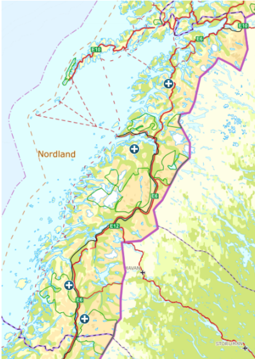
Kart over jerv felt på lisensfelling i Nordland i 2019/2020, per 5. februar 2020.

Av en lisensfellingskvote på 16 jerv er det per 5. februar felt 4 dyr (se kart nedenfor).